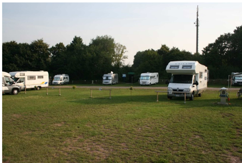
Gigiotta nella Area di Xanten

1 settembre: In mattinata ripartiamo in direzione Altamura. La vacanza è ormai terminata, ma conserviamo nei nostri cuori i tanti ricordi legati ad ognuna delle splendide città visitate!