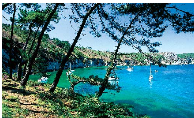
LA PRESQU'ÎLE DE CROZON

Les mesures de restriction d'accès et de stationnement visent donc à préserver leur