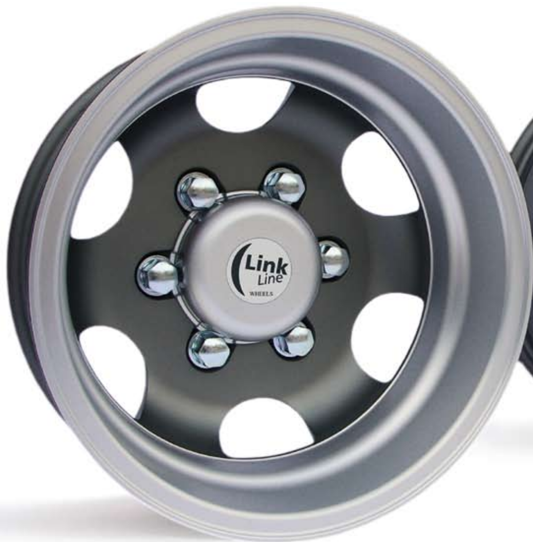
ORO 28 P