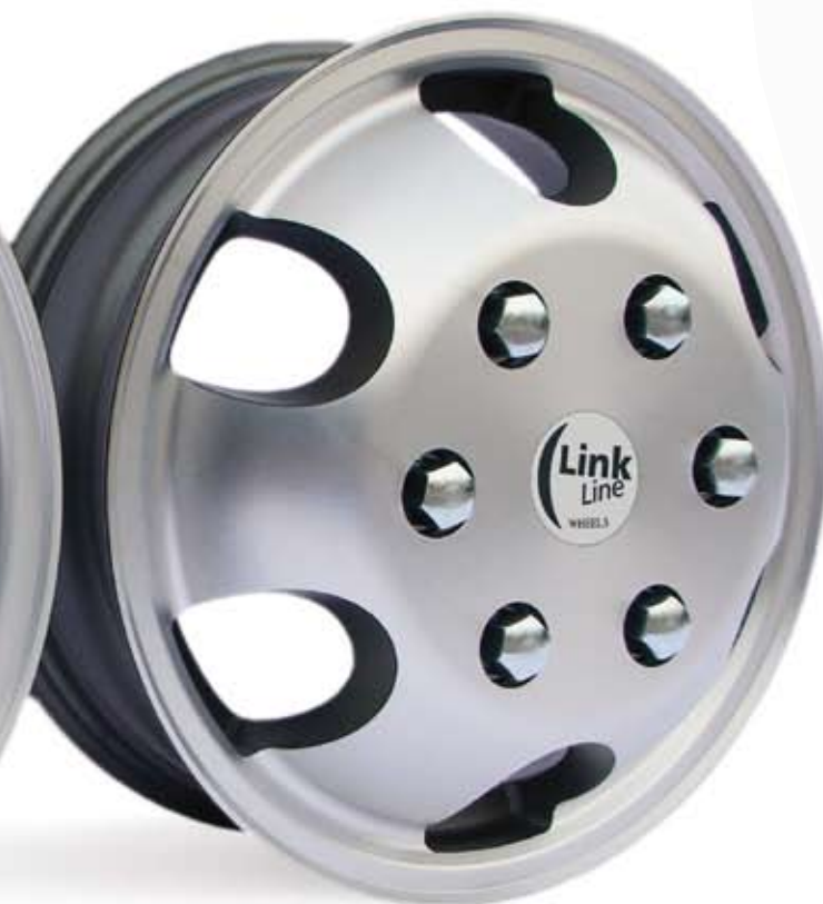
ORO 28 A