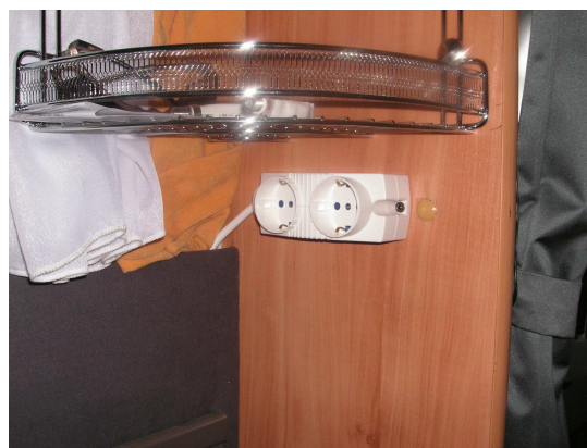
Scarpetta posizionata sul montante verticale, davanti al tavolo semidinette