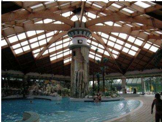
Un particolare di uno dei tre ambienti della struttura coperta delle terme di Čatež

Le Terme di Čatež sono un complesso formato da tre alberghi (tutti con SPA, usufruibili anche per i non clienti degli alberghi), bungalow e appartamenti di vario taglio e campeggio; all'interno due strutture con piscine di vario genere (tipo Acquapiper o Acquafan, con tutti i pregi e difetti di questo tipo di strutture), una