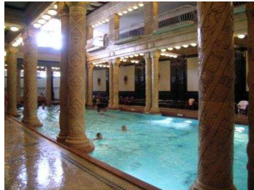
Una delle piscine del Gellert

Visita città. Prima tappa Parlamento per prenotazione (solo giorno stesso). Rinviando al giorno successivo. Visti i nostri gusti la scelta degli itinerari è in base alle architetture Liberty. Decidiamo di cominciare dal Museo Arte Applicata (bellissima la costruzione e le collezioni) e zone limitrofe. Impedibile una sosta al Caffè New York: per il locale, per il servizio, per la qualità dei dessert (Erzsébet krt. 9-11).