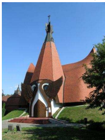
La Chiesa evangelica di Siofók

Poi ripassando per Budapest per andare in direzione opposta verso Gyor. Ci fermiamo al campeggio di Tata, un complesso bellissimo con molti bungalow che è quasi deserto. Le piscine all'interno sembrano in disuso: parte vuote, una sembra un stagno. Venendo abbiamo visto alberi che ci sono sembrati pieni di nidi di uccelli. Abbiamo letto che qui lo spettacolo del volo degli uccelli sul lago in inverno è imperdibile.