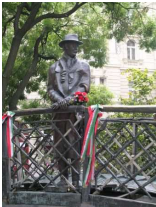
La statua di Imre Nagy di fronte al Parlamento