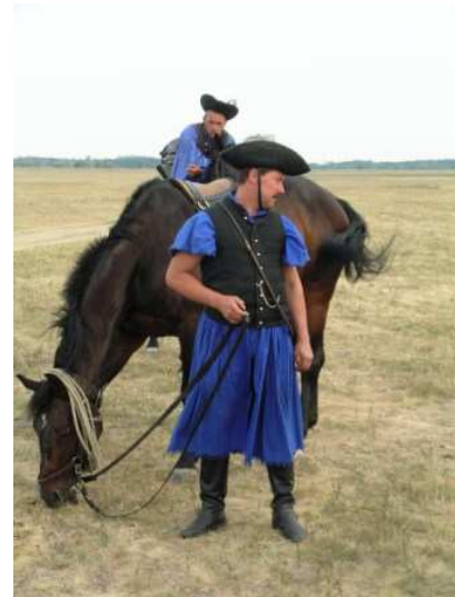
Mandriani della Puszta

Cena alla Hortobágy Csarda: locale semplice, musiche popolari ungheresi (suonate da due suonatori) non invadenti (di solito non apprezziamo i classici locali per turisti con chiassose orchestre, ma qui è molto soft); cibi: vino Merlot di Villany 2004 (Teleki), Bogracsgulyas (goulash), Magyaros bivalyotokany (filetto di bue grigio con contorno: eccezionale!) pasztortarhonyaval (filetto di bufalo con contorno: altrettanto buono) e borjujava joasszony modra (grey cattle), dessert strudel e palacinta con ciliegie e cioccolato tutto per 10.000 ft con la mancia (40 euro in due!).