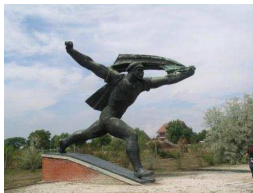
Parco delle Statue

Ultimo giro per il centro tra un ritorno al Museo di Arti Applicate per comprare altre cornici liberty in un negozietto di fronte al museo, il Mercato Centrale e Váci Ut, poi al campeggio.