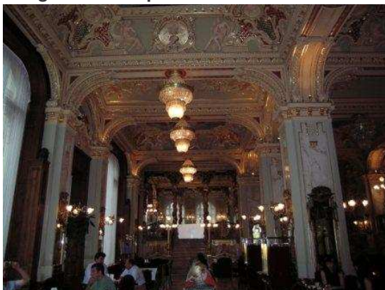
Una sala del Caffè New York

Tempo brutto. Stanotte ha piovuto e stamattina non promette nulla di buono.