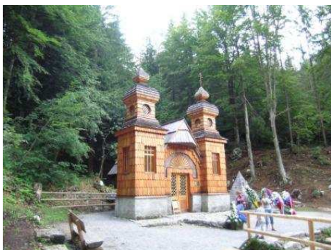
Cappella dei Russi

A Nova Gorica inizia il percorso lungo l'Isonzo, passiamo per Kanal (spiagge vicino al piccolo campeggio), Tolmin, Kobarid, Bovec, Soča, Trenta (la strada sembra chiusa dal Triglav, che si para davanti imponente), Il fiume è bellissimo; tra Soča e Trenta molte organizzazioni di rafting. A Trenta due campeggi di montagna piccoli e tranquilli.