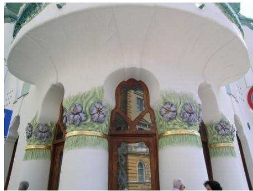
Architetture liberty sulla Tisza Lajos Körút

Ritornati al camper usciamo dalla città poco dopo le 16 direzione Gyula dove giungiamo due ore dopo. Tra il campeggio Thermal, un po' decentrato ed il campeggio Mark scegliamo questo, a due passi dalle terme, molto piccolo in verità, ma la nostra piazzola è fin troppo grande. Andiamo a vedere dove sono le terme per capire come funzionano ma tutto è in ungherese, rumeno e tedesco e non riusciamo a capire le varie scelte offerte per gli ingressi. Lo capiremo solo più tardi collegandoci al sito delle terme che è anche in inglese.