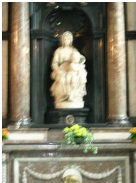
La madonna col bambino - Michelangelo