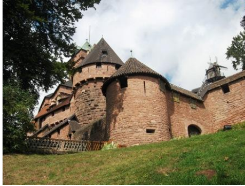
Il castello di Haute Koenisbourg

Facile parcheggio per i camper lungo la strada e in uno spazio abbastanza ampio per una quindicina di V.R. a 600 metri dal castello.