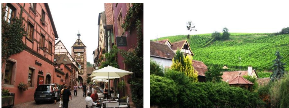
Immagini di Riquewhir

Camping intercomunale Riquewhir - 2 km dal paese - anche area camper in paese