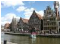
immagini da Gand o Gent