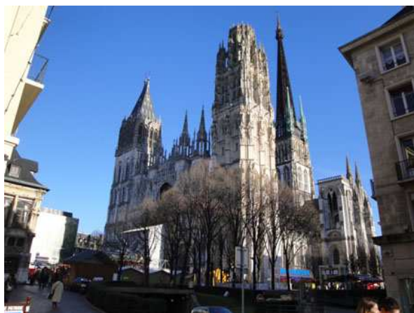
Rouen Notre Dame