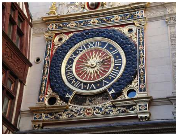
Rouen il grande orologio