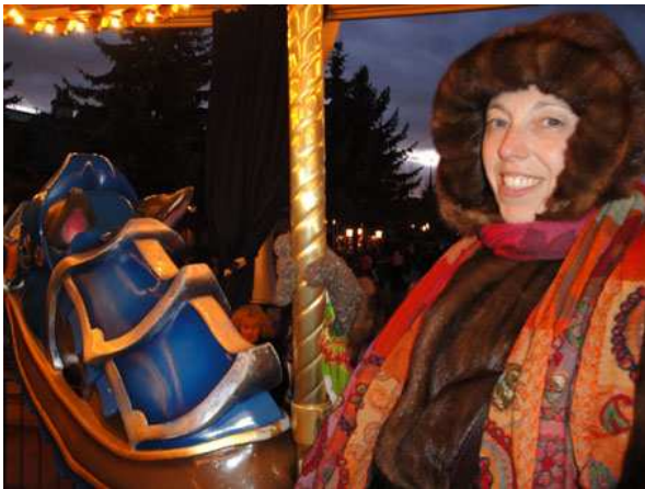
Eurodisney la giostra dei cavalli