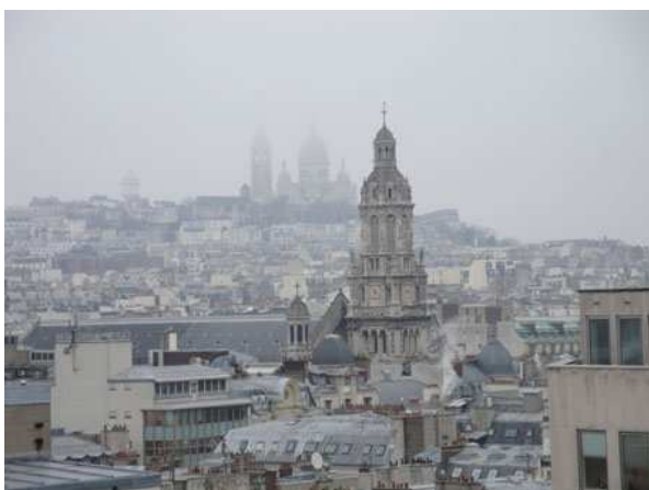
Paris dalla terrazza del Printemps

* PARIS, CAMPING BOIS DE BOULOGNE, ALLEE DU BORD DE L'EAU 2. 435 PIAZZOLE, NAVETTA DEL CAMPEGGIO O BUS 244 A CIRCA 400 METRI PER RAGGIUNGERE LA LINEA 1 DELLA METROPOLITANA A PORTE MAILLOT TEL. 0033145243000 HTTP://WWW.CAMPINGPARIS.FR GPS N 48.868 E 2.23435