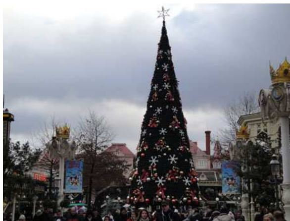
Eurodisney l'albero di Natale