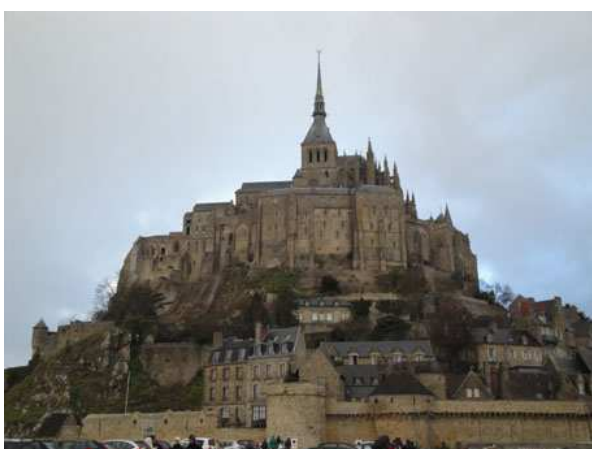
Le Mont St. Michel