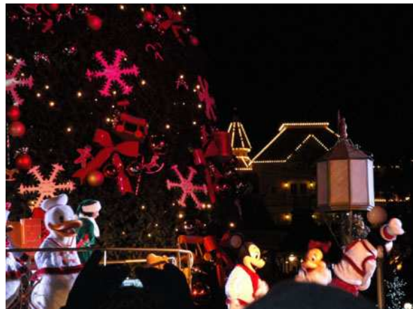
Eurodisney la sfilata