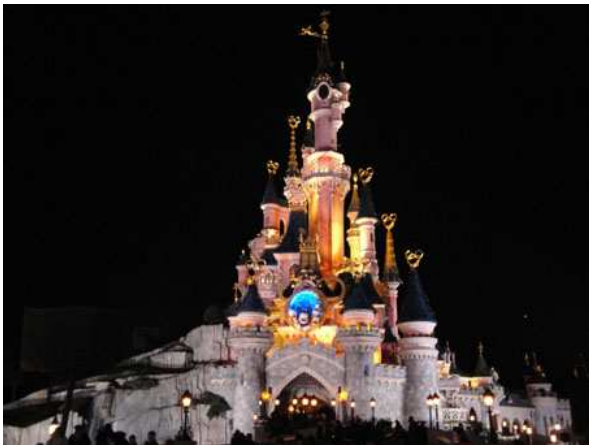
Eurodisney il castello