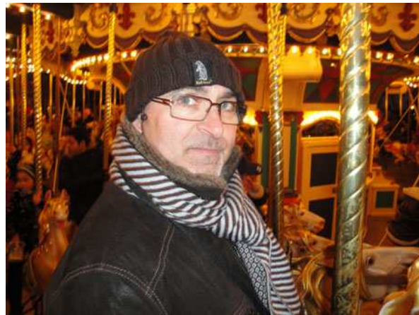
Eurodisney la giostra dei cavalli