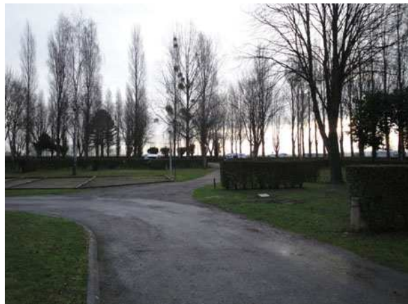
Le Mont St. Michel Area Attrezzata