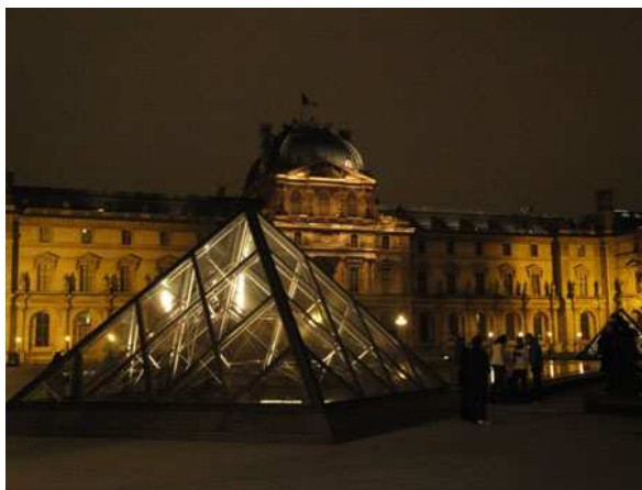
Paris il Louvre la sera del 31/12