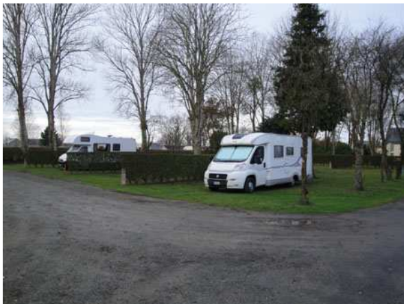
Le Mont St. Michel Area Attrezzata

* SAINT MALO, PS VICINO AL PORTO TURISTICO E ALLA CAPITANERIA DI PORTO, A CIRCA 1 KM DAL CENTRO. VIETATO DALLE 9,00 ALLE 19,00 MA IN INVERNO LA SOSTA E' TOLLERATA. PER LA NOTTE DALLE 19,00 ALLE 9,00 SOSTA GRATUITA IN RUE HENRI LEMARIE'