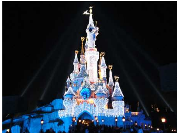
Eurodisney il castello