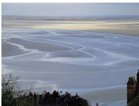
Le Mont St. Michel la spiaggia