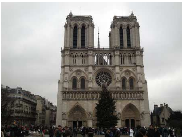
Paris Notre Dame