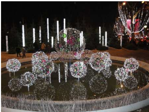
Paris fontana sugli Champs Elysees