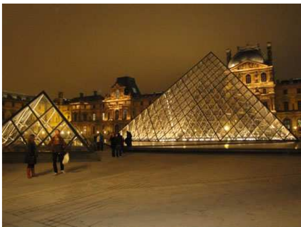
Paris il Louvre la sera del 31/12

435 PIAZZOLE, NAVETTA DEL CAMPEGGIO O BUS 244 A CIRCA 400 METRI PER RAGGIUNGERE LA LINEA 1 DELLA METROPOLITANA A PORTE MAILLOT TEL. 0033145243000 HTTP://WWW.CAMPINGPARIS.FR GPS N 48.868 E 2.23435