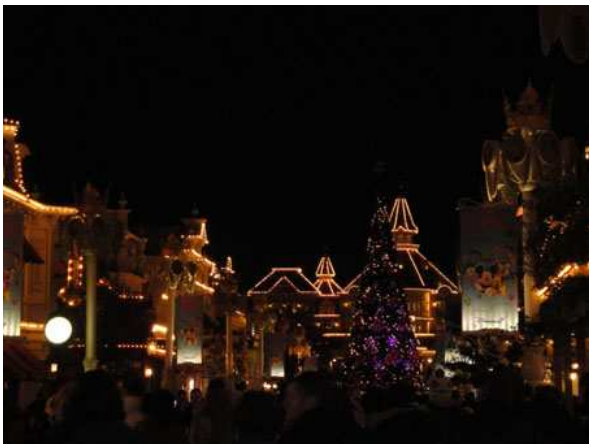
Eurodisney Main Street