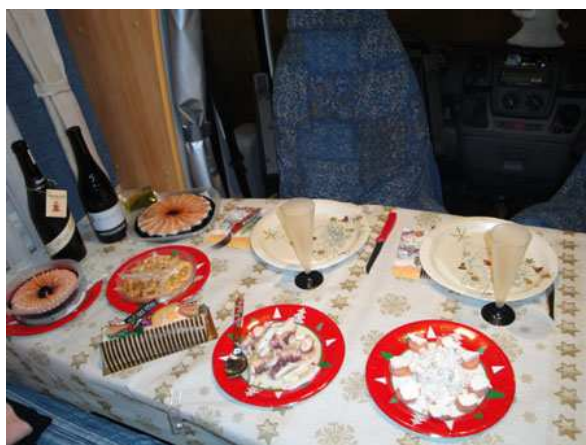
Cena vigilia di Natale