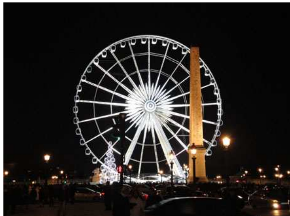
Paris la ruota