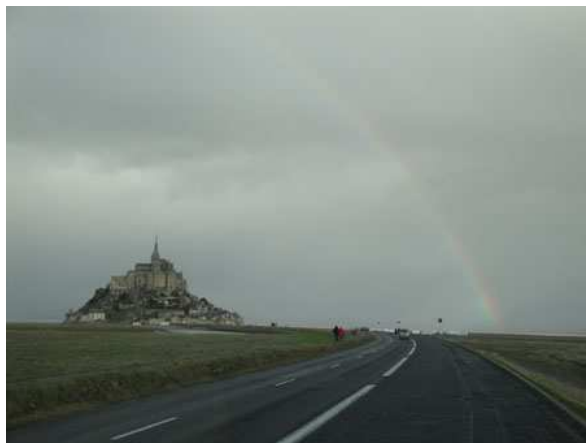
Le Mont St. Michel arcobaleno