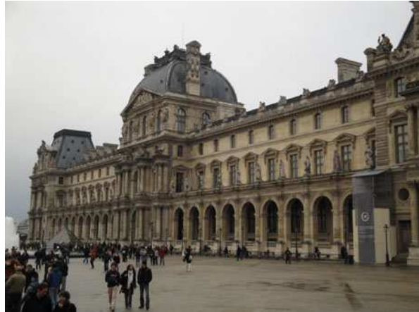
Paris il Louvre