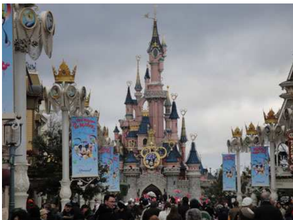
Eurodisney il castello