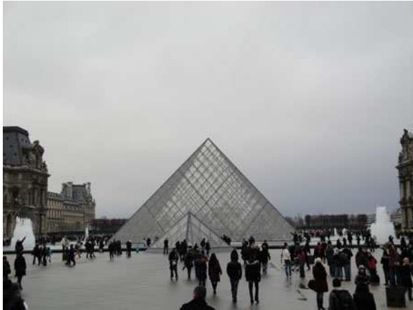
Paris il Louvre

* PARIS, CAMPING BOIS DE BOULOGNE, ALLEE DU BORD DE L'EAU 2. 435 PIAZZOLE, NAVETTA DEL CAMPEGGIO O BUS 244 A CIRCA 400 METRI PER RAGGIUNGERE LA LINEA 1 DELLA METROPOLITANA A PORTE MAILLOT TEL. 0033145243000 HTTP://WWW.CAMPINGPARIS.FR GPS N 48.868 E 2.23435