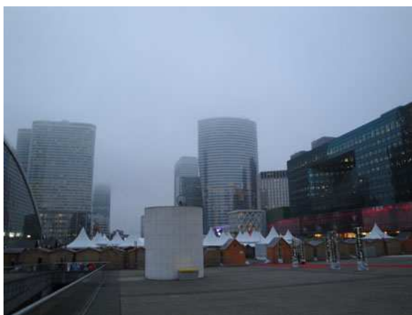
Paris la Defense