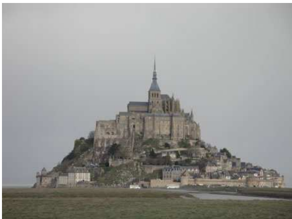
Le Mont St. Michel