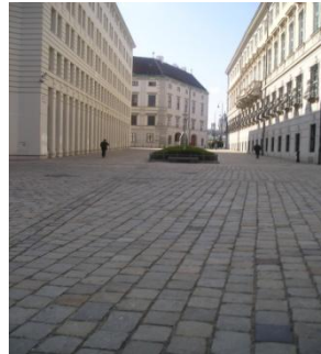
QUARTIERE DEI MUSEI