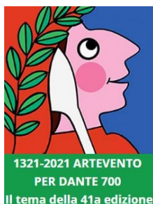
1321-2021 ARTEVENTO PER DANTE 700 Il tema della 41a edizione