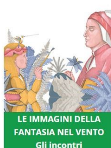
LE IMMAGINI DELLA FANTASIA NEL VENTO Gli incontri