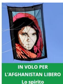
IN VOLO PER L'AFGHANISTAN LIBERO Lo spirito