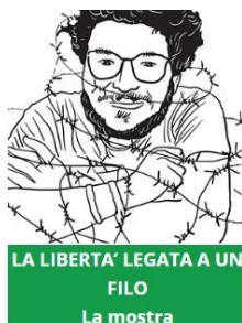
LA LIBERTA' LEGATA A UN FILO La mostra