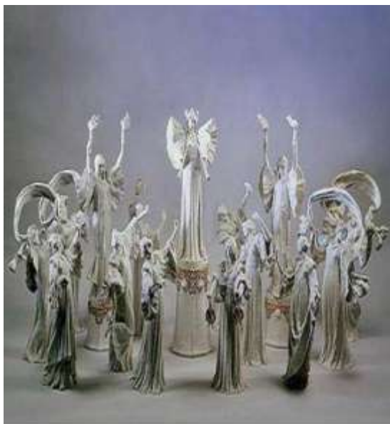
Agathon Léonard van Weydenfeld - La danse de l'écharpe - 1900 - décoration de tavola, porcellana di Sèvres - h. figure cm 40-50 - courtesy Hermitage, Amsterdam

Contiene ceramiche dal Medioevo al '700 ( 12.000 oggetti ) di ceramica islamica di Iznik, di ceramiche ispano-moresche, tutta la produzione italiana del Rinascimento ( Faenza, Firenze,Siena, Venezia ) e naturalmente una straordinaria collezione di ceramiche francesi da Nevers a Rouen, da quelle di Strasburgo a quelle di Marsiglia, la porcellana cinese e quella di Meissen ( tedesca ) e tutte le paste tenere francesi di Saint-Cluod, Chantilly, Vincennes, Sevres e Parigi .