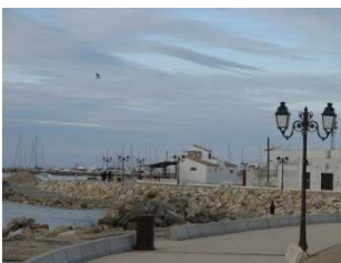
Saintes Marie de la Mer