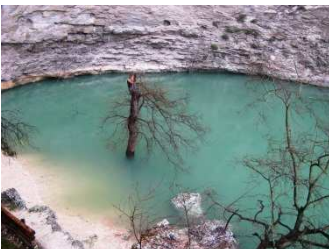
Sorgenti della Source

04/01 Il risveglio è in mezzo alla nebbia , ma ci gustiamo il panorama del luogo veramente ricco di fascino. Spettacolare la passeggiata lungo la Source e le sorgenti che hanno ispirato il nostro poeta Petrarca. Anche se siamo fuori stagione riusciamo ad acquistare parecchio ( tovaglie e tovagliette).Tornati a casa sicuramente ci rallegreranno l'inverno con il tipico stile provenzale. Ci dirigiamo verso Le Baux che ci riserva una bella sorpresa: molto bello e ben tenuto il borgo medievale. Altro paese tra i borghi più belli è Lourmarine. Decidiamo ci avvicinarci ancora un po' verso il confine e ci ritroviamo dopo varie peripezie a Port Grimaud, villaggio e porto turistico che cerca di riprodurre l'architettura veneziana. Le Baux