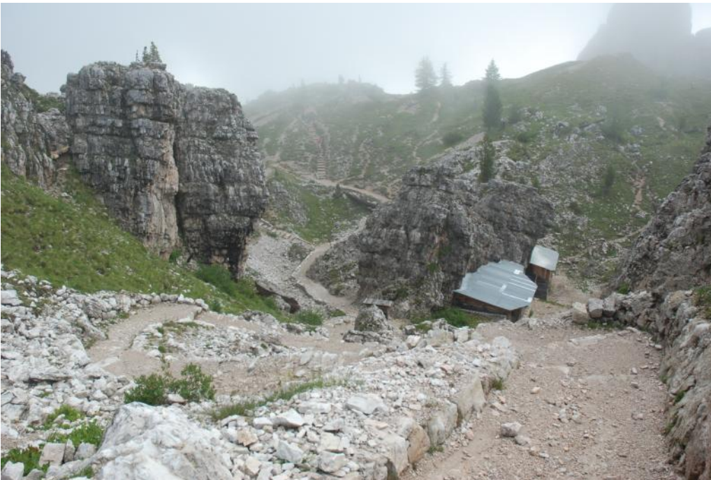
Museo della grande guerra alle 5 Torri