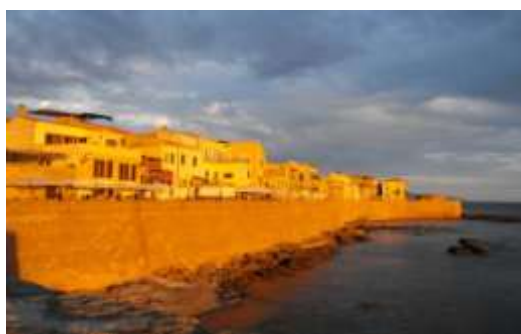
Tramonto sui bastioni di Alghero

31 maggio 2011 – tempo incerto, non andiamo in spiaggia, ma in vespa ci spingiamo fino a Capo Caccia e poi andiamo ad Alghero . Notte ad Alghero in una piazza vicino al porto con altri camper e serata sui bastioni, con una luce indescrivibile ... Notte tranquilla.