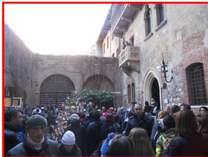
La Casa di Giulietta

bar o sbircia sulle bancarelle del mercato. Proprio lì vicino c'è la famosa Casa di Giulietta con il celeberrimo balcone, che ha visto il contrastato amore fra la giovane fanciulla dei Capuleti ed il rampollo sedicenne dei Montecchi, Romeo. Amore