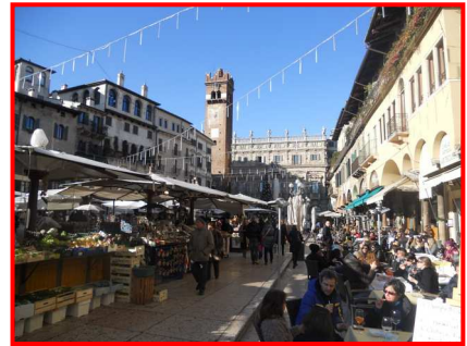
Piazza delle Erbe

sacco di gente che cammina, che si rilassa al tavolo di un