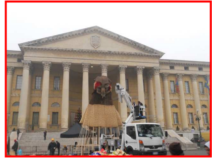
"Brusa la Vecia"

della città, ed in effetti il movimento non manca: vicino all'Arena è stato allestito una pista di pattinaggio su ghiaccio che è presa letteralmente d'assalto da giovani di ogni età. Su un lato della piazza stanno montando una Befana di grosse dimensioni, che il giorno successivo, verrà data alle fiamme, come tradizione vuole. L'evento, che si svolge in Piazza Bra prende il nome di "Brusa la vecia" e chiude il periodo delle feste natalizie. Vediamo dei volantini che riportano le ore 18.00 come orario della manifestazione. Ci ripromettiamo di essere presenti in piazza il giorno successivo, all'ora stabilita, per essere partecipi di questo evento. Intanto, dopo un giretto in zona, visto il freddo che si fa sempre più pungente, decidiamo di rientrare sul camper, dove ci aspetta un calduccio che ci ritempra dal freddo patito.