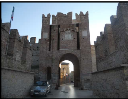
La Porta del Borgo

titolo di "Bandiera Arancione" dal Touring Club Italiano, per cui marchio di qualità turistico-ambientale. Troviamo l'area di sosta non senza difficoltà, per colpa di una segnaletica non proprio chiarissima. Lasciato il camper, entriamo nel Borgo dalla porta a nord del paese. Non c'è