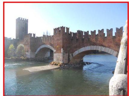
Il Ponte Scaligero

Fiancheggiamo Castelvechio, (originariamente chiamato Castello di San Martino in Arquaro) ed il suo Ponte Scaligero. Attualmente il castello ospita l'importante