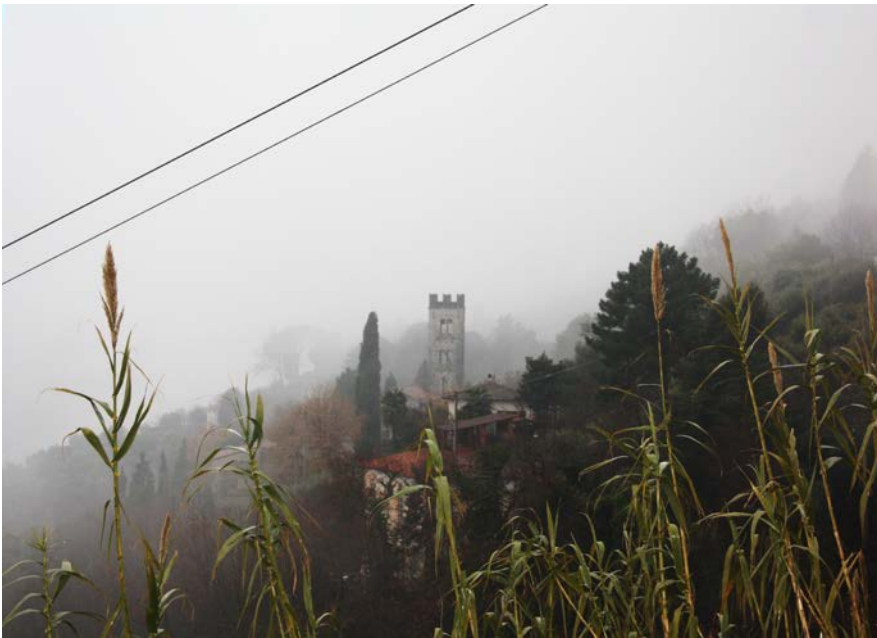
(pieve di Brancoli)

La pieve di S. Giorgio di Brancoli è una delle più belle Pievi Romaniche di Lucca, venne fondata probabilmente nei sec. XI-XII. (una leggenda locale la vorrebbe fra le 28 chiese fondate dal Vescovo Frediano, il più grande e famoso Vescovo di Lucca, vissuto nel VI secolo) Siamo fortunati è aperta! Si visita l'interno, ma è l'esterno che c'incuriosisce: una strana figura scolpita nell'architrave. Secondo una tradizione popolare rappresenterebbe la figura di "Brancolo" , mentre alcuni esperti d'arte medievale in questa strana figura, hanno identificato una riproduzione rozza del Demonio.