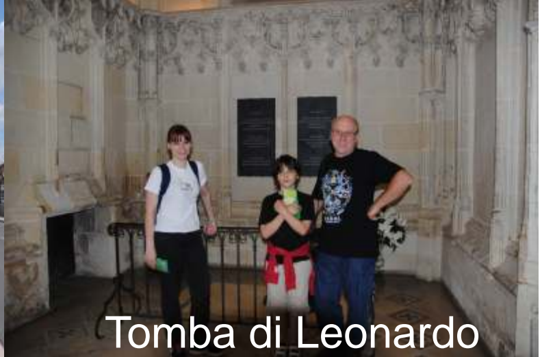
Tomba di Leonardo