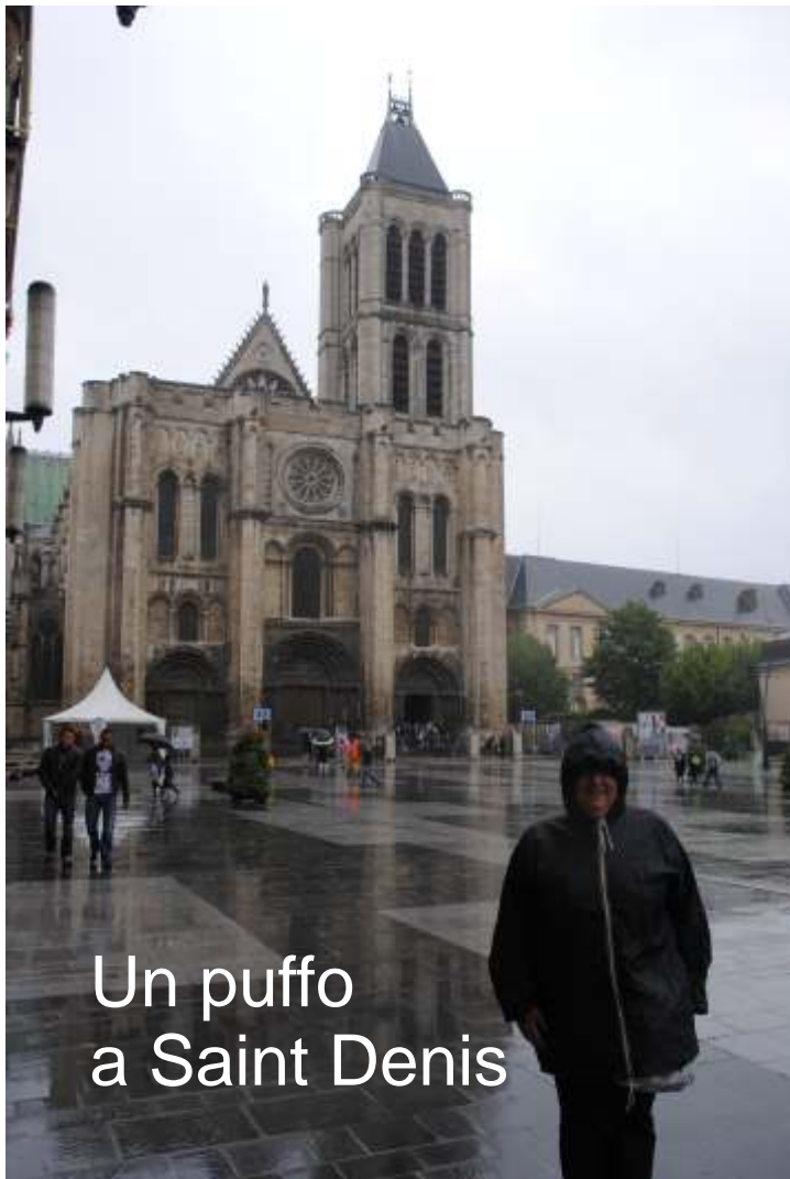
Un puffo a Saint Denis