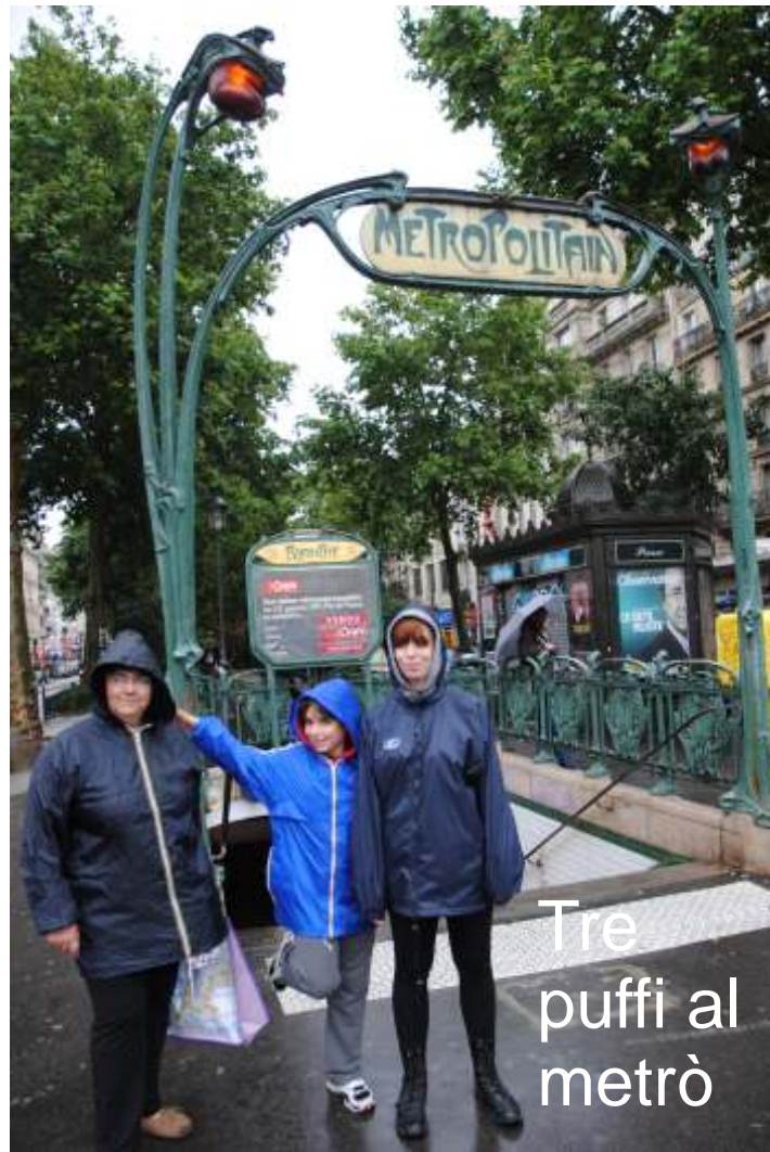
Tre puffi al metrò