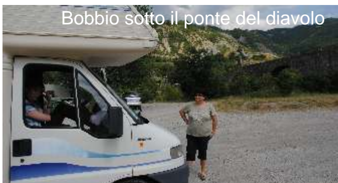
Bobbio sotto il ponte del diavolo

in tarda sera, fermata a Rivoli per la notte, nell'apposita area di sosta.