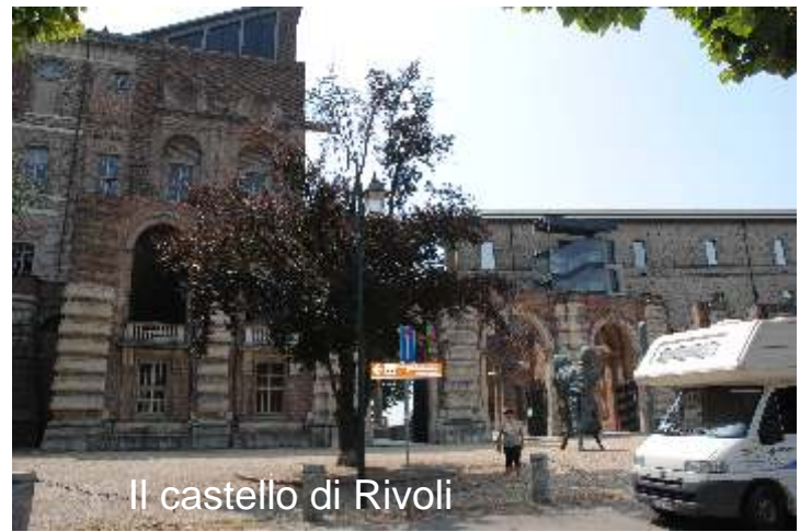
Il castello di Rivoli