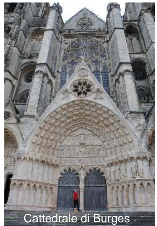
Cattedrale di Burges

Piccola visita mattutina alla cattedrale e si riparte, direzione Culan per vedere l'ultimo castello della Loira. Visita esterna anche perché era chiuso apriva di pomeriggio e il tempo programmato non coincideva con il rientro. Piano piano per le vie normali che sono tenute benissimo arriviamo a Lione per prendere l'autostrada che ci ha riportato in Italia