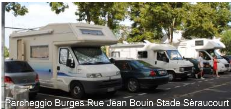
Parcheggio Burges Rue Jean Bouin Stade Sèraucourt