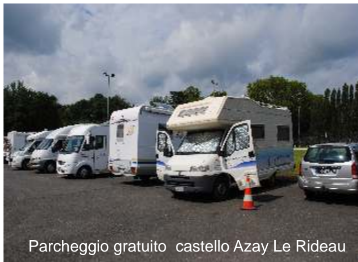
Parcheggio gratuito castello Azay Le Rideau