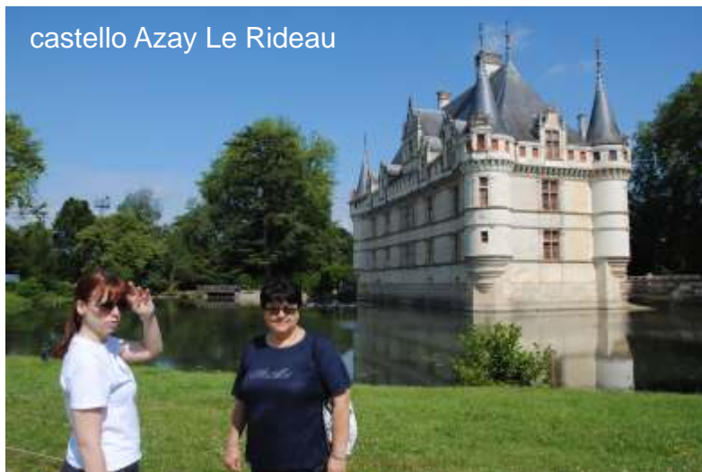
castello Azay Le Rideau