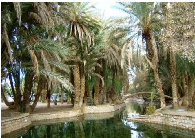
L'Oasi della Sorgente Blu a Meski.