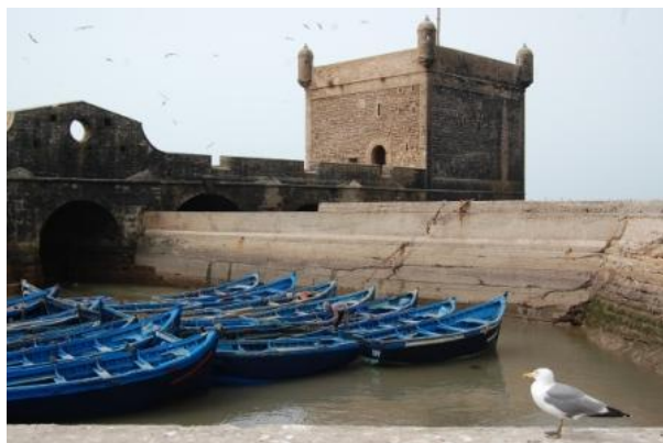
I bastioni portoghesi di Essaouira