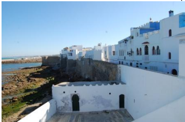
La Medina di Asilah

arriviamo al nuovo porto di Tangeri (Tangeri Med) alle 18 (cioè alle 19 ora italiana). Lunga attesa alla dogana per far timbrare i permessi di importazione temporanea dei camper. Usciamo dalla dogana alle 21 e, effettuato il cambio di valuta a un box immediatamente dopo la dogana ed il pieno di gasolio poco oltre, arriviamo, con