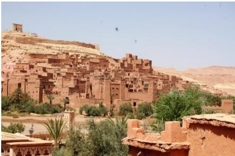
La Ksar di Ait Benhaddou

Dopo giorni abbastanza impegnativi, oggi, relax! Bighelloniamo con tranquillità per Ouarzazate: la kasba, la Medina, il Museo del Cinema (molte scene di celebri film sono state girate qui). Per entrare nella suggestiva Ksar di Ait Benhaddou occorre guardare (passando su un percorso di pietre) un torrentello. Fantastica è la vista della ksar (patrimonio dell'umanità – UNESCO) e altrettanto il panorama che si gode dalle sue torrette. Pernottamento al "Camping de Ouarzazate". km 78