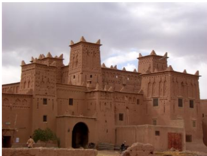
La Kasba di Ameghidil