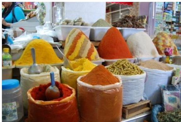
Banchetto di spezie nel suq di Meknes

L'andamento climatico è sempre lo stesso: alle 7 ci sono 10.5°C, alle 9 sono diventati 12°C, all'ora di pranzo farà decisamente caldo. Uscendo dal campeggio ammiriamo il bel panorama sulla vallata verdissima e sulle colline fitte di uliveti. A Meknes visitiamo (con la guida) la città berbera, la città araba con la scuola coranica, i granai, la Medersa Bou Inania e il Mausoleo di Moulay Ismail. Pranziamo (300 DH) sulla grande terrazza di un ristorante di fronte alla imponente Porta di Bab Mansour. La mia Pastilla è favolosa, ma anche le altre portate soddisfano i commensali. Al mercato delle spezie e dei dolci grande varietà di frutta sempre, come vedremo in tutti i mercati marocchini, disposta in maniera molto scenografica. Ma tutto il suqè da vedere ed esplorare; singolare è il tratto