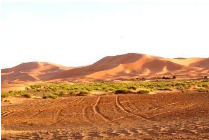
Le dune dell'Erg Chebbi

dopo lunga trattativa vari fossili per 550 DH cioè 50€ (avevano chiesto 150€). La strada verso le gole presenta ampie aree di sosta con tende di venditori di artigianato e pozzi per estrarre acqua (grandi cumuli di sabbia con in cima un verricello). All'ora di pranzo fa caldo (25°C, la mattina alle 7 erano 9,5°C). A Thineir ci accoglie il campeggio "Le Soleil de Thinerir" (buoni servizi, anche scarico per wc nautico). Constatiamo di non ricevere più il segnale TV e sarà così fino a Casablanca. In pratica al di sotto della catena del Medio Atlante la parabola non riceve. Al ritorno a Roma abbiamo saputo che occorre modificare l'angolo di skew, ossia ruotare l'illuminatore della parabola (v.note) Veramente, in seguito, a Essaouira, ci hanno proposto di fare quella operazione, ma abbiamo preferito soprassedere. km 216