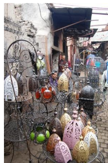
Il suq del ferro battuto a Marrakesh

Agadir percorre un paesaggio desertico ed è deserta anch'essa (100 DH), poi, all'improvviso, ecco una distesa di coltivazioni di argania, la pianta dai cui frutti (una specie di nocciola ovoidale) si ricava il famoso "olio di argan". Queste coltivazioni sono tutelate dall'UNESCO per la protezione della biosfera. Uno spettacolo curioso è costituito dalle capre che si arrampicano sugli alberi di argania per cibarsi dei frutti. Per essere precisi loro mangiano la polpa, il "mallo" e scartano il nocciolo (che è quello da cui si ricava l'olio). Da Agadir a Tafraoute la strada è sempre dritta in un panorama sempre desertico; si sale, fino al passo del Kardous (1200m s.l.m.), poi si scende ma sempre in una strada deserta. Camping Tazcka. km 442