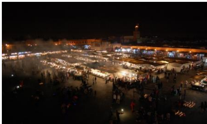
Place Jemaa el-Fna a Marrakesh

Si vede che siamo scesi a sud, alle 7 c'erano 13°C. Verso Marrakesh attraverso lo spettacolare Passo Tizi-n-Tichka (2260m s.l.m.), ma la giornata non è delle migliori: tira un forte vento, piove, fa freddo (8°C), la visibilità è ridotta. A Marrakesh incontriamo il primo supermercato di tipo europeo (Marjane). Fatta la spesa ed entrati in campeggio, usciamo (in maxi-taxi perchè il campeggio è molto lontano dal centro città) per vedere, di sera, la celeberrima Place Jemaa el-Fna. Superata la moschea della Koutoubia con il suo bellissimo minareto, si accede all'immensa piazza. Place Jemaa el-Fna non è semplicemente una piazza, è "la piazza", il cuore e il ventre di Marrakesh, un grandissimo microcosmo, un caleidoscopio di colori, odori, sapori e varia umanità. Incantatori di serpenti, giocolieri, venditori di ogni cosa, donne che tatuano con l'henné, gazebo dove si mangia di tutto a prezzi irrisori, negozi di artigianato, vestiti, e altro, bancarelle di frutta fresca e secca, spezie, olive e altro, tutto allestito in maniera molto scenografica. Vista la folla e, in alcuni punti la calca, tenere ben strette borsette e macchina fotografica. Dalla terrazza del bar/ristorante sito in un lato della piazza si gode una spettacolare visione notturna della stessa. Pernottamento al Camping Ferdaous, sulla strada per Casablanca – buoni e completi i servizi. km 226