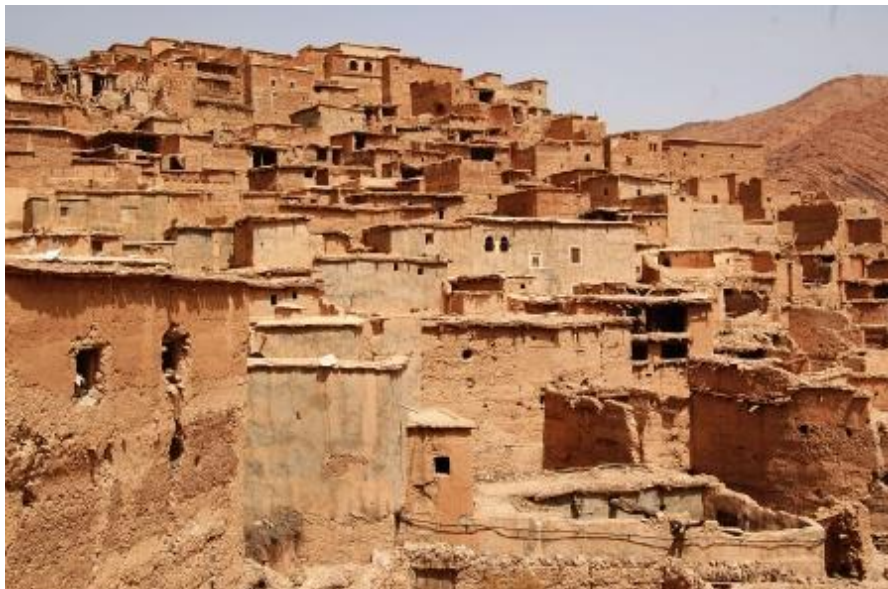
Villaggio berbero nella Valle dell'Almen con le case di paglia e fango impastati

caldo e, all'inizio della giornata, il panorama era offuscato da sabbia in sospensione prodotta da una tempesta nel deserto e arrivata fin qui. Pranziamo in una piccola, minimalista e rustica trattoria, all'aperto, sotto le palme; menù: tajine di pollo, acqua minerale, frutta e caffè (180 DH vale a dire 5€ a testa). Al ritorno ci facciamo lasciare a Tafraoute (a 5' a piedi dal campeggio). Facciamo spese nella graziosa, linda e tranquilla cittadina; il nostro bottino: babbucce e olio di argan presso una piccola produttrice. La cittadina è molto curata nell'arredo urbano e, ci hanno riferito che ci sono molte seconde case di ricchi commercianti berberi che hanno sostituito gli ebrei quando questi sono andati in Israele. Camping Tazcka