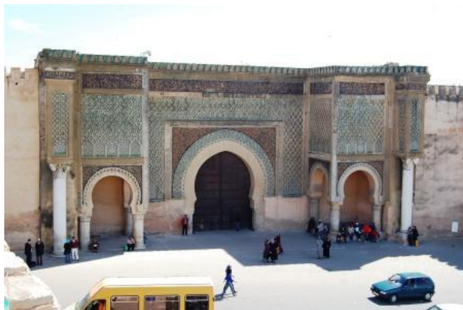
La Porta di Bab Mansour a Meknes

dove decine e decine di botteghe (in realtà tendoni lungo la stradina già di per se stretta) dove un gran numero di sarti, sia giovani che anziani, cuciono su macchine di 30-40 anni fa i variopinti vestiti delle donne marocchine. Autostrada da Meknes est a Fes (19€) e poi, seguiamo le indicazioni per il campeggio "Diamant Vert" (all'interno di un parco acquatico). i servizi sono molto scadenti (c'è però il pozzetto per wc nautico) . km 91