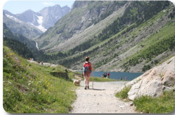
Lac de Gaube