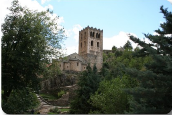
Saint Martin du Canigou

attraversiamo l'abitato seguendo le segnalazioni, poi imbocchiamo il ripido sentiero cementato, dove frequentemente siamo superati dalle jeep che fanno da navetta per i turisti più pigri e gli immancabili giapponesi. La sudata è assicurata dall'alto tasso di umidità presente nel sottobosco e dovuta, in buona parte, ai salti effettuati dal Cady, che qui forma delle gorges spettacolari.