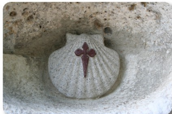
Bagnères de Bigorre

Di fianco alla chiesa di Saint Vincent scoviamo l'inconfondibile conchiglia simbolo del Camino de Santiago, così scopriamo che Bagnères è su uno dei tragitti francesi per Santiago de Compostela. Si tratta del cammino Piemonte che, iniziando a Saint Lizier, attraverso Saint Bertrand de Comminges, Bagnères de Bigorre, Lourdes, Betharram, Bruges, Arudy, Oloron, Mauleon Licharre, arriva fino a Saint Jean Pied de Port. Diversi esercizi commerciali espongono orgogliosi foto d'epoca dei numerosi episodi e arrivi del Tour de France a Bagnères de Bigorre. Arriviamo fino alle terme, poi torniamo indietro acquistando qualche souvenir fino a decidere, visto che il caldo è tornato predominante, di sederci nel ristoro presente nel mercato coperto a prendere una bibita fresca e riposare le gambe.