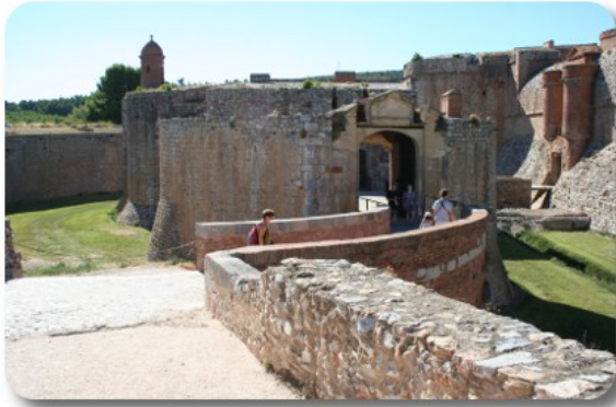
Salses le Château

facciamo il giro delle mura, gratis, sperando che i due euro pagati per il parcheggio debbano servire per curare dei dolorosi mal di denti intervenuti di sabato pomeriggio a farmacie chiuse.