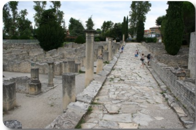
Vaison la Romaine

Partiamo alle 16.45. Per uscire da Vaison, Tomtom ci fa percorrere una strada quasi più stretta del camper. Dirigiamo su Nyons, che raggiungiamo rapidamente data la scorrevolezza della strada. Quindi dirigiamo su Serres, seguendo il corso dell'Eygues e percorrendo le sempre spettacolari Gorge de Saint May. Poco prima di Remuzat, ancora stretti nelle gole, scopriamo la gradevole Arie de Repos du Planas con panche, tavoli e fontana. Arrivati a Serres prendiamo la direzione per Aspres sur Buech e da lì dirigiamo su Veynes. Alle 18.50 siamo piazzati all'area municipale di Veynes, un poco difficile da trovare essendo posta dopo i due campeggi in riva al Plan d'Eau.