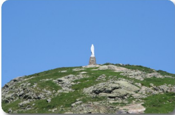
Cirque de Troumouse

Girovaghiamo senza meta, anche perché le due più prestigiose, il Lacs des Aires e la statua della Vierge, sembrano essere fuori della nostra portata temporale. Ci godiamo, insieme a Blonde, assolutamente rivitalizzata, i prati del pascolo e il placido scorrere dei vari ruscelli. La giornata è splendida, il cielo è limpido, l'aria è tersa, questo ci favorisce nell'avvistamento di un paio di stambecchi sulle pendici di uno dei ghiacciai.