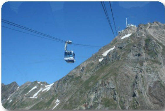
Pic du Midi

Difficile riuscire a descrivere e documentare tutte le emozioni che si provano in questa rapida ascesa. Partiamo sotto le nubi e, dopo un cambio di cabina a metà strada, sbuchiamo sopra di esse, raggiungendo e superando la quota di volo degli avvoltoi. Lo spettacolo comincia dunque ammirando la coltre ovattata che copre le valli sottostanti, mentre al di sopra il cielo è assolutamente sereno e limpido. Pian piano il caldo dissolve le nubi e il Pic du Midi ci offre, dai suoi 2877 metri di altitudine, panorami sconfinati. Dalla guida apprendiamo che verso la Francia è possibile avere una visuale intorno ai 300 chilometri. Di fronte a noi si erge il massiccio della Neuvielle, con i suoi ghiacciai, più in là si vede il Vignemale, da cui originano i corsi d'acqua di Pont d'Espagne, in mezzo ai due si distingue nettamente la Breche de Roland, che si trova sulla corona rocciosa che contorna il Cirque de Gavarnie.