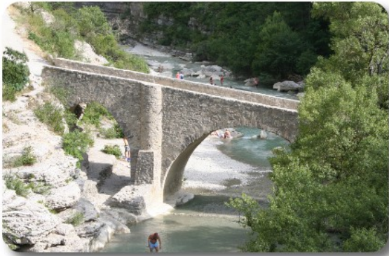
Gorge de la Meouge

per dirigerci verso Laragne Monteglin. Nella zona di Ventavon la strada attraversa una parte di territorio intensamente coltivata a frutteto. Superata Laragne, poco dopo Chateaneuf de Chabre imbocchiamo la D942 e subito troviamo l'indicazione delle Gorge de la Meouge. La strada si fa subito stretta e piena di curve. Fortunatamente, in prossimità di uno dei migliori punti di vista, troviamo miracolosamente un posto in uno slargo fuori carreggiata, in modo da non creare neanche intralcio alla circolazione. Scendiamo al torrente che qui, sotto uno scenografico ponte in pietra, forma delle vasche e delle cascate che, oggi, sono piene di gente. Solo noi non troviamo un posto adeguato per fare il bagno, tutti gli altri ne fanno in abbondanza! In compenso scattiamo un bel numero di foto, il sito si presta, e Blonde è felice di sgranchirsi le zampe e bere acqua fresca.