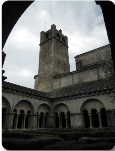
Vaison la Romaine

scopriamo che la chiesa affonda le sue radici su un precedente edificio di chiara origine romana. Proseguendo nel percorso suggerito dalla nostra guida arriviamo al vasto sito archeologico de la Villasse, con la strada dei negozi, ancor oggi lastricata, le numerose colonne ancora al loro posto e la vasca delle terme. Ancora qualche metro e siamo di nuovo in centro. Il mercato è in fase di smobilitazione, allora noi approfittiamo per pranzare sotto la veranda de Le Bar A Thym in Avenue Général de Gaulle 18, spendendo quello che definiremmo un prezzo giusto. Finito di pranzare, alle 15.30, troviamo una nuova cittadina, libera dall'oppressione commerciale ambulante e restituita alla propria vocazione turistica. Arriviamo fino al teatro romano poi di nuovo all'area camper.