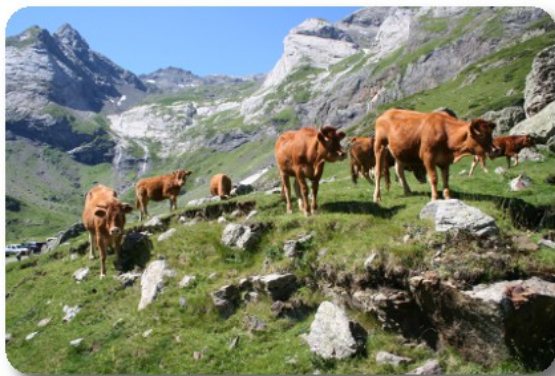
Cirque de Troumouse