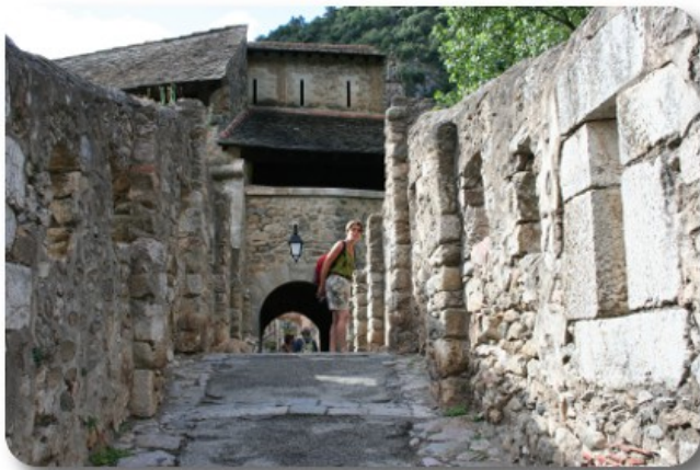
Villefranche de Conflent

Sveglia alle 8.00, stanotte ha piovuto più volte mentre stamattina il cielo è sereno con qualche nube. Alle 9.00 il sole ancora non ha raggiunto il piazzale della stazione e si trova ancora dietro le cime dei monti. Assistiamo alla partenza della prima corsa del Train Jaune poi, alle 10.00, partiamo per visitare Villefranche. Dal piazzale della stazione si percorre un sentiero pedonale che fiancheggia la ferrovia e la Tet per circa 200 metri poi si arriva ad un piazzale dove, da una parte c'è l'entrata sotterranea per le scale di salita al Fort Liberia e dall'altra, attraversando i binari, si entra nella cinta muraria e nella cittadella. L'abitato, con edifici per lo più costruiti in pietra, ricorda molto Carcassone ed è una forte attrattiva turistica. I commercianti riescono ad autoregolarsi, rispettando spazi e architetture, oltre a mantenere i prezzi abbordabili, sia per i souvenir, che per il mangiare. La giriamo in lungo e in largo.