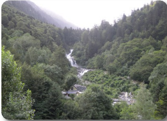
Cascade du Lutour

allo chalet in riva al lago, due mezze baguette prosciutto e formaggio e due birre medie ben 18 euro, meglio portarselo da casa.