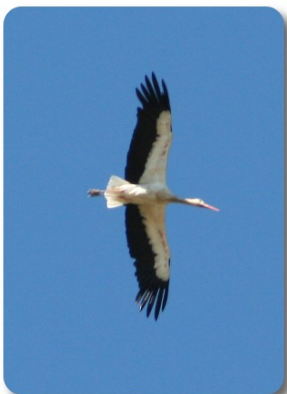
Peyriac de Mer

Sveglia alle 8.00, cielo sereno e temperatura, tutto sommato, fresca, abbiamo 21 gradi in camper. Notte tranquilla, nonostante ieri sera fosse sorta qualche preoccupazione dovuta alla assoluta mancanza di illuminazione. Il passaggio pedonale aperto ha permesso l'accesso ad alcuni campeggiatori in tenda. Stamattina sembra di essere in un altro posto.