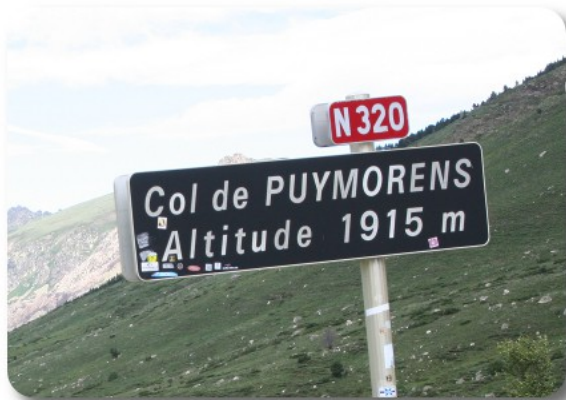
Col de Puymorens

Bourg Madame è ben visibile la vallata e l'intreccio di tornanti della strada. La salita da Ax è stata agevole, nonostante che l'abbiamo fatta a passo d'uomo.