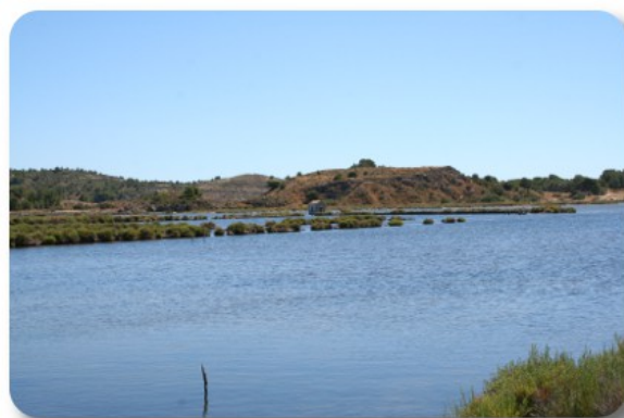
Peyriac de Mer

Usciamo alle 9.30, ci incamminiamo per il sentiero da 2 ore e trenta minuti, quello corto, attraversando il piccolo stagno della ex salina su una passerella di legno, fiancheggiando il più grande Etang de Doul, fino ad arrivare al porticciolo sull'Etang de Bages. Rientrando passiamo per il paese,