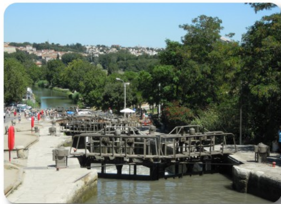
Les Neuf Ecluses de Fonseranes