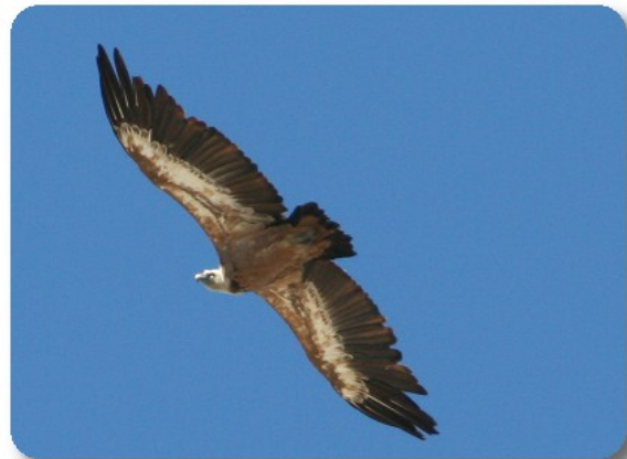
Pic du Midi