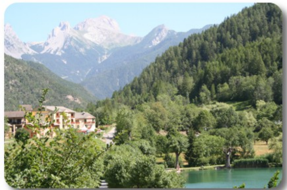
Le Lauzet Ubaye

Ci muoviamo alle 16.05 risalendo sulla D900 in direzione Gap. Presto cominciamo a vedere il Lac de Serre Poncon, che aggiriamo e, al bivio per Gap, seguiamo le indicazioni per Tallard. Non prendiamo l'autostrada, ma proseguiamo sulla D1085, che lasciamo all'altezza di Monetier Allemont