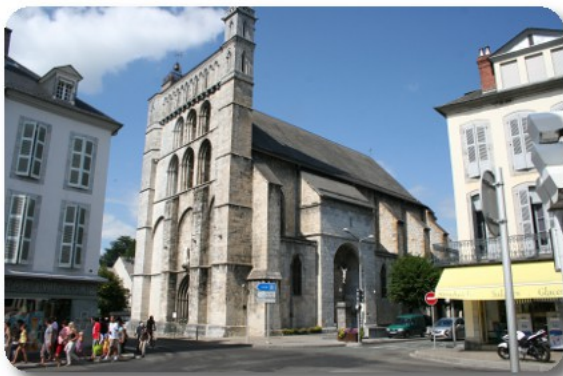
Bagnères de Bigorre

Pranziamo comodamente, poi andiamo verso il centro dirigendo a senso, causa mancanza completa di indicazioni. Percorrendo tutta Rue Rene Cassin, superiamo i binari della linea ferroviaria evidentemente abbandonata, e arriviamo in Rue du General de Gaulle dove giriamo a destra. Troviamo diverse abitazioni e negozi abbandonati e decadenti poi, superato il complesso della piscine comunali, arriviamo al ponte sull'Adour che, con la sua cornice fiorita, ci introduce al centro storico. Troviamo una cura e una animazione in netto contrasto con quanto percepito nel quartiere periferico attraversato. E' pieno di gente, i negozi sono tutti aperti, sembra di essere in piena festa. Intanto il sole comincia a vincere la sua guerra con le nuvole.