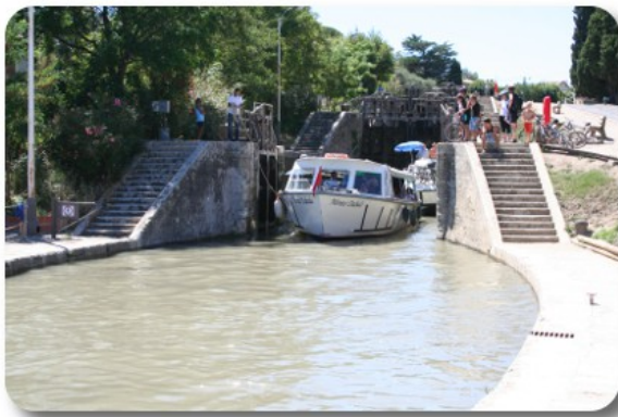
Les Neuf Ecluses de Fonseranes