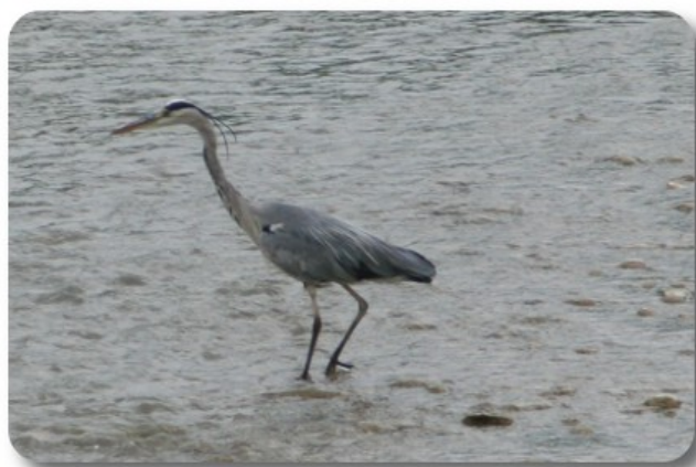
Vaison la Romaine

Scendiamo a valle, sempre seguendo il percorso turistico consigliato, ed arriviamo al Pont Neuf, attraversando il quale abbiamo la fortuna di osservare alcuni aironi grigi intenti a pescare nell'Ouveze. Arriviamo così alla cattedrale romanica di Notre Dame de Nazareth, nel cui chiostro troviamo un piccolo museo di reperti archeologici, lapidi, steli, sarcofagi. Facendo il periplo dell'edificio