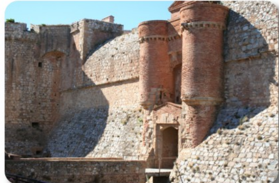
Salses le Château

Ripartiamo alle 18.30 e dirigiamo verso il mare prendendo la litoranea D6009. Viaggiamo con regolarità, pur constatando una intensificazione del traffico e sempre sotto l'influsso di improvvise folate di vento. Alla ricerca di un posto per dormire, lasciamo la statale e seguiamo le indicazioni per Bages e il suo stagno. Raggiunto il villaggio, troviamo difficoltà anche a fermarci, quindi lo superiamo e percorriamo un piacevole tratto di D105, una stradina stretta e quasi intransitata, di fianco e in mezzo allo stagno, con tratti inondabili, fino ad arrivare all'area attrezzata di Peyriac de Mer, posta all'interno dello stadio di calcio, con entrata con sbarra automatica attivata da pagamento con Bancomat di 5 euro per 24 ore. Siamo alle spalle della vecchia salina e, da qui, partono tre sentieri di diverse lunghezze che si sviluppano in mezzo allo stagno e rientrano attraversando il villaggio. Per cena evapora una mezza bottiglia di Cabernet d'Anjou.