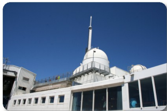
Pic du Midi

Su tutto questo spettacolare panorama volteggiano, sopra e sotto di noi, numerosi avvoltoi la cui acuta vista è in grado di individuare una carogna alla distanza di trenta chilometri. Il cielo limpido consente al sole di dardeggiarci a dovere, siamo saliti ben coperti, con maglie e paile, e finiamo in