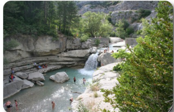
Gorge de la Meouge

Ripartiamo alle 18.30 seguendo la direzione per Sederon. La strada è veramente impegnativa, con curve molto strette, un arco di roccia in piena curva e, a tratti, larga come un single track scozzese ma senza piazzole. Passati gli otto chilometri delle gorges, la situazione migliora, anche grazie alla valle che si allarga, serve comunque molta attenzione. Entrati nel dipartimento della Drome, la strada migliora sensibilmente e riusciamo a riprendere un'andatura decente. Incontriamo qualche campo di lavanda in fiore e scattiamo alcune foto. Alle 19.10 arriviamo, con qualche apprensione per alcuni passaggi all'interno dell'abitato, al Camping Municipal Les Biaux di Sederon. Alla reception non c'è nessuno, per cui prendiamo posto in una delle piazzole libere, il camping è semivuoto. Camping spartano, ma efficiente e pulito, posto proprio in riva alla Meouge, che qui è poco più di un canaletto. Il locale dell'unica doccia per gli uomini è grande quanto tutto il camper. Allacciamo la corrente, apriamo tavolo e veranda, ci docciamo e consumiamo una gustosa cenetta. Prima di buio è arrivata la signora che gestisce il camping, così paghiamo i 15.40 euro per la notte e domattina possiamo partire a nostro piacimento.