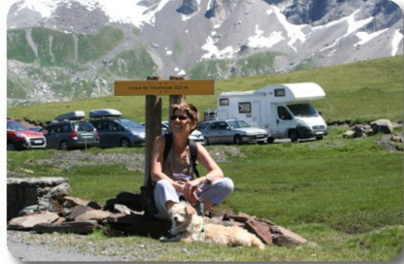
Cirque de Troumouse

Alle 14.45 iniziamo la discesa. In quindici minuti percorriamo i tre chilometri che ci separano dal Plateau du Maillet, a non più di 10 chilometri l'ora in prima marcia, l'unica a riuscire a produrre l'effetto di freno motore. Altri venti minuti li impieghiamo per discendere fino alla Chapelle de Heas, ancora in prima e seconda marcia. Per le 15.45 siamo parcheggiati nel parcheggio alle spalle dell'Hotel des Pyrenees a Gedre. Prendiamo un caffè, mentre il motore riposa, e rilasciamo la nostra tensione al termine della parte più impegnativa della discesa. Ripartiamo alle 16.30 e, dopo un'ora e dieci minuti siamo nuovamente posizionati al Camping du Loup a Lourdes. Qui a valle fa un caldo indecente, 36 gradi in camper, l'umidità è alta e il vento completamente assente, già ci rimpiangiamo la frescura goduta al Cirque. Il Troumouse è più piccolo e raccolto del Cirque de Gavernie, grande e maestoso, però è altrettanto gradevole, più selvaggio e godibile. Personalmente pensiamo che sarebbe opportuno che, specie il tratto a pagamento della strada di accesso, fosse sostituito con un servizio di navette o una teleferica in modo da evitare che mezzi e piloti sprovveduti, come noi, si avventurino nella parte più pericolosa della salita e, soprattutto della discesa. Prima di sera paghiamo i 33.80 euro delle due notti passate in campeggio in modo da poterci muovere al più presto domattina e passare Pierrefitte Nestalas prima dell'ora di chiusura della strada per Cauterets.