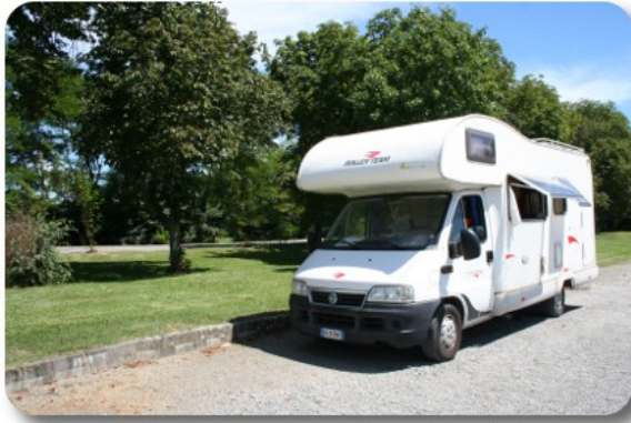
Trie sur Baise

troviamo assolutamente nulla di gradevole, o meglio ci sfuggono tutte le occasioni a causa della nostra incapacità a decidere rapidamente. Arriviamo così a Trie sur Baise che sono le 12.15, ora giusta per fermarci. Troviamo un parcheggio alla periferia dell'abitato contornato di aiuole fiorite, grande, piano e assolutamente deserto, anche se molto assolato. Ci fermiamo ed arieggiamo abbondantemente il camper. Mangiamo in tranquillità dopodiché andiamo a fare una passeggiata, per visitare il centro. Tutto è stretto attorno alla chiesa di Notre Dame des Neiges, che troviamo chiusa e abbastanza trascurata, ed alla piazza del mercato, dove prendiamo un caffè alla francese.