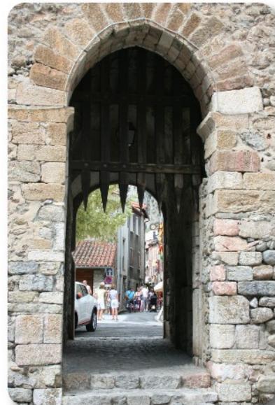
Villefranche de Conflent