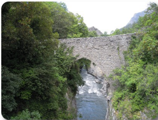
Le Lauzet Ubaye