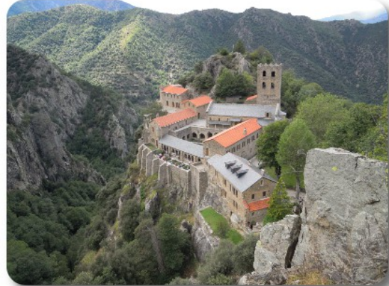
Saint Martin du Canigou