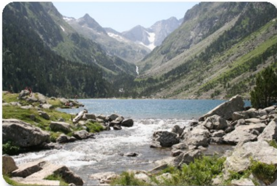
Lac de Gaube