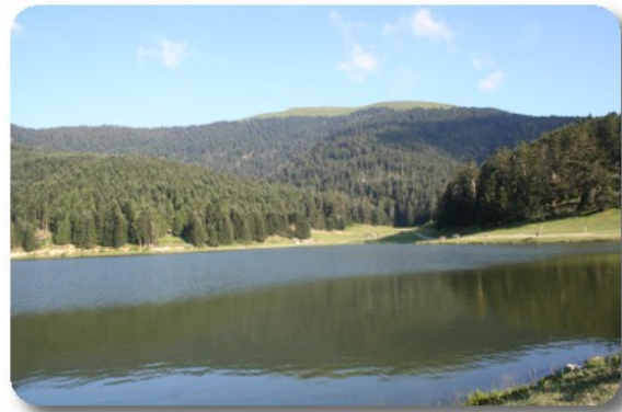
Lac de Payolle

Qui è in corso una festa campale e tutto l'altopiano è sovraffollato. Ci sono camper dappertutto, come lo zucchero a velo su un dolce. La giornata si mantiene serena, ma il caldo del sole è mitigato dall'altitudine e da un vento fresco che spira a folate. Una parte del parcheggio, un poco distante dal lago, dove siamo piazzati noi, è riservata ai camper, 15 posti per massimo 48 ore. Il lago è a soli 200 metri infatti, scesi con Blonde, ne facciamo il periplo e rientriamo alle 19.30. Ceniamo fuori senza necessità di aprire la veranda, al lume delle stelle. Tanto per gradire l'ambiente, a cena evapora una mezza bottiglia di Sauvignon du Pays. Ci ritiriamo alle 23.30, dopo un'ora e mezza passata sulle spiagge a guardare stelle, satelliti, pianeti e via lattea, con il binocolo nel buio più totale.