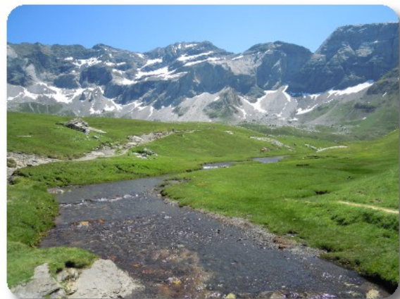
Cirque de Troumouse

Siamo a 2103 metri d'altezza, quasi duecento metri più in alto della vetta del Mont Ventoux, abbiamo i ghiacciai che sembra di poterli toccare, gli avvoltoi ci volteggiano sulla testa, la statua della Vierge troneggia immacolata in mezzo ad un anfiteatro tappezzato di verde, dove pascolano in libertà numerose mandrie di mucche e greggi di pecore. Alle 13.00 apriamo il ristorante con vista sui ghiacciai di Troumouse. Terminato il pranzo scendiamo a fare una passeggiata in questo angolo di paradiso.