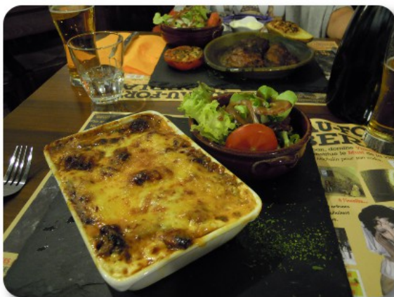
Villefranche de Conflent