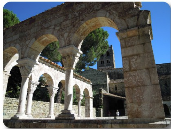
Saint Michel de Cuxa