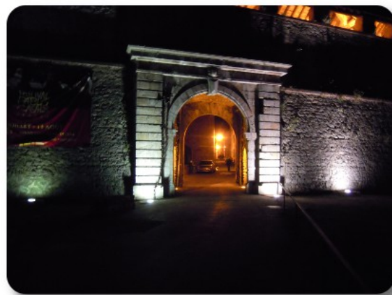
Villefranche de Conflent

Dopo una bella doccia ristoratrice, oggi il boiler ha deciso di accendersi, per le 20.00 partiamo per visitare Villefranche by night. Ceniamo al ristorante l'Echaugnette, in Rue Saint-Jean 9, dove troviamo a lavorare le figlie della signora da cui avevamo acquistato le baguette in mattinata. Lo chef è italiano, la mangiata è perfetta. Abbiamo assaggiato delle lasagne catalane, in pratica la ricetta delle nostre lasagne arricchita e adeguata alla disponibilità di condimenti locali. I piatti sono serviti rigorosamente su vassoi in pietra lavica nera e guarniti con generose insalate, per cui è sufficiente