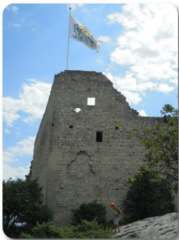
Vaison la Romaine

Sveglia alle 8.00 al termine di una nottata fresca e tranquilla nonostante il traffico della vicina statale. In camper abbiamo ancora 23 gradi. Partiamo alle 9.40 e in mezz'ora arriviamo all'area attrezzata di Vaison la Romaine, prendendo uno dei pochi posti rimasti disponibili. L'area è a pagamento solo per il pernottamento. Non è stato facile trovarla, a causa del caos e del traffico deviato, in conseguenza della presenza in paese del Marchè Provencale, una sorta di mega mercato con quasi tutto il centro storico intasato di bancarelle, con prodotti provenzali e cineserie varie, e migliaia di persone che cercano in qualche modo di camminare. All'Office du Tourisme, dove troviamo una ottima wifi, prendiamo la mappa con il percorso turistico consigliato. Per seguirlo troviamo modo di uscire dal caos del mercato ed arriviamo al belvedere sulla gola dell'Ouveze, attraversata dal Ponte Romano. Attraversato il ponte, risaliamo le viuzze della Cité Medievale fino alla cima, dove troviamo le rovine dello Chateau Comtal ed una magnifica vista sull'abitato della parte bassa, i vigneti che circondano tutta la zona e la maestosità del Mont Ventoux.