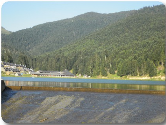
Lac de Payolle

Il parcheggio si è riempito di veicoli ma, essendo noi parcheggiati al fondo, riusciamo ad uscire agevolmente che sono le 16.15. Percorriamo un tratto di discesa poi, come già da Pont d'Espagne, approfittiamo della presenza delle cascate per fermarci a fotografarle, far raffreddare freni e riposare il motore. Immortaliamo così sia le Castate d'Arises, che quelle du Garet. Su quest'ultimo torrente ci fermiamo anche più in basso, a valle della centrale elettrica, in località Lartigue, in modo da consentire a Blonde di sgambare ancora un poco in mezzo alla natura. Intanto noi riflettiamo sul da farsi. Vista la giornata bella ed anche il nostro buon umore, ci sentiamo fortunati e scegliamo di puntare direttamente al Lac de Payolle. Seguiamo la D918 fino a Sainte Marie de Campan poi la seguiamo in direzione del Col 'Aspin. La strada sale con pendenza costante ma dolcemente, incontriamo poco traffico. Arriviamo al Lac de Payolle alle 17.55.