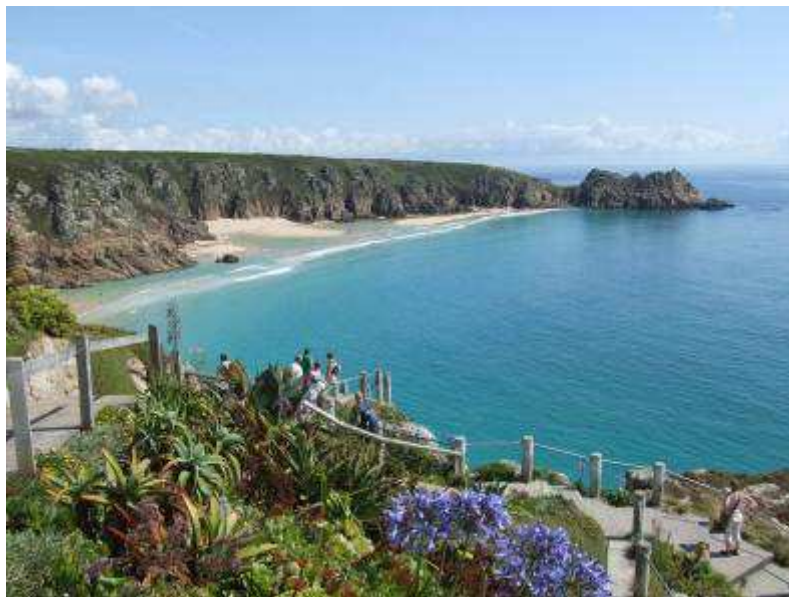
Spiaggia di Porthcurno

Ci fermiamo per pranzo. Poi nel primo pomeriggio ripartiamo per Land's end ma il parcheggio è strapieno e così cerchiamo a Sennen un campeggio per la notte. Troviamo posto al Sea View per 22 st senza corrente. Troppo grande per i nostri gusti ma ci accontentiamo (visto che gli altri campeggi e farm sono pieni).