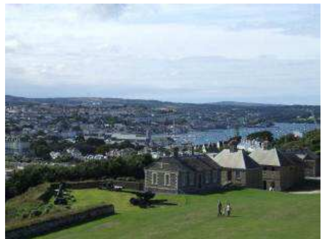
Vista su Falmouth dal castello

Ci spostiamo sulla penisola di Lizard, il punto più a sud del Regno Unito. Troviamo posto al Mullion Park ma 33 sterline mi sembrano davvero eccessivi. Riusciamo a trovare posto al Franchis Park e paghiamo solo 18 sterline. Doccia, cena, film e nanna.