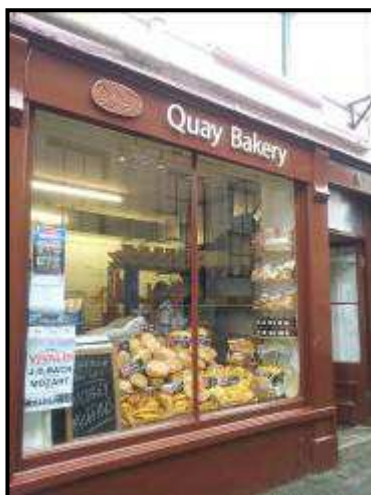
Quay Bakery 6 Webb Street www.quaybakery.co.uk

Ci spostiamo in direzione St. Austell ma la pioggia è davvero troppo forte e non riusciamo nemmeno a scendere dal camper. Vista l'ora ci fermiamo per pranzo in un parcheggio della Co-op e ne approfittiamo per fare un pochino di spesa e per pranzare.