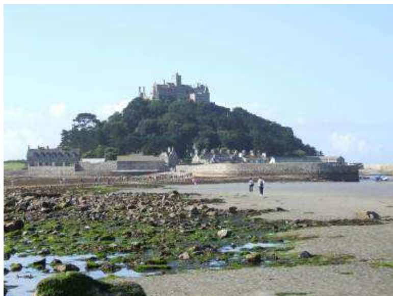
St Michael Mount

La storia racconta che all'origine di questo luogo vi è l'apparizione dell'arcangelo Michele a cui è stata dedicata una chiesetta che verrà poi trasformata dai benedettini in un monastero costruito su modello di quello francese presso Mont Saint Michel.