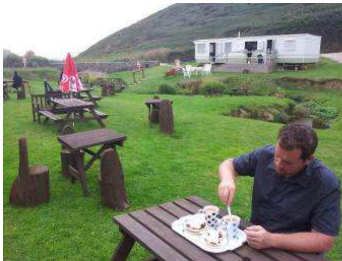
Te e scones