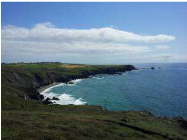
Penisola di Lizard

Per cena BBQ di cotolette di agnello e maiale. Gnam!!