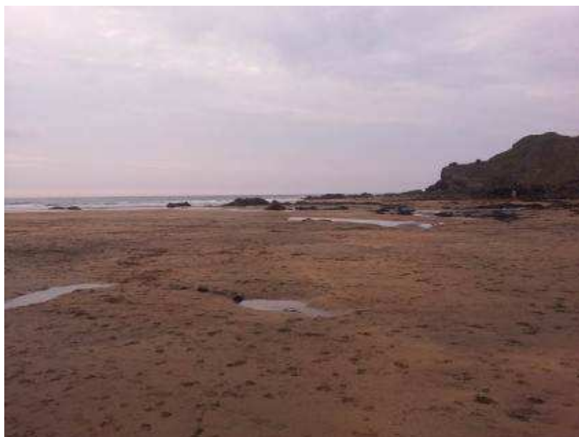
Spiaggia di Northcott Mouth

Nel pomeriggio Matteo pesca e io mi rilasso al sole. E vai!!! Pescati 4 piccoli branzini!!!