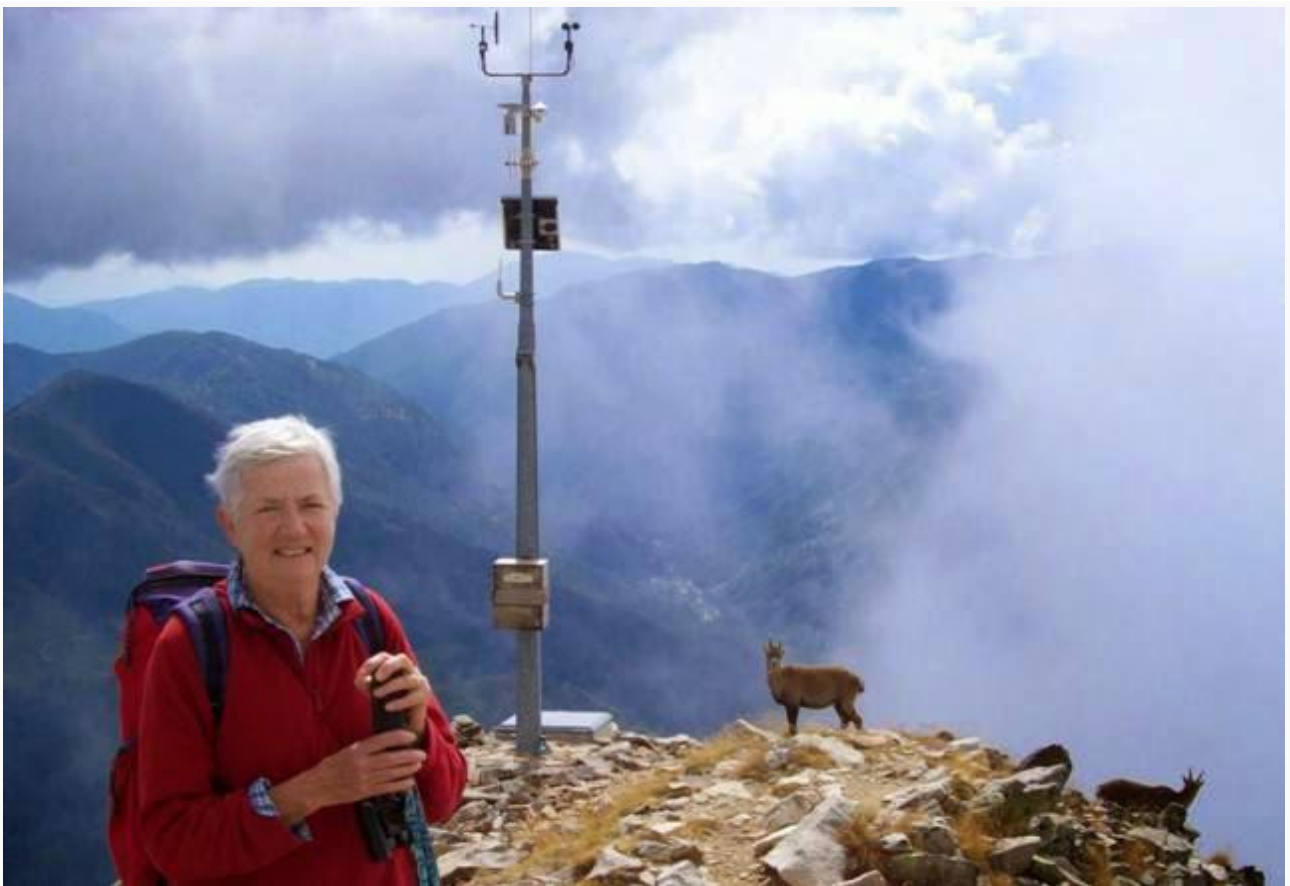
In vetta pascolano degli stambecchi abituati ai turisti