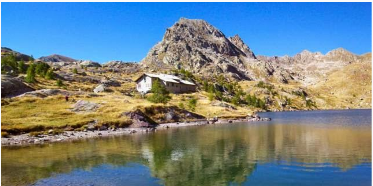
Arrivo al rifugio des Merveilles