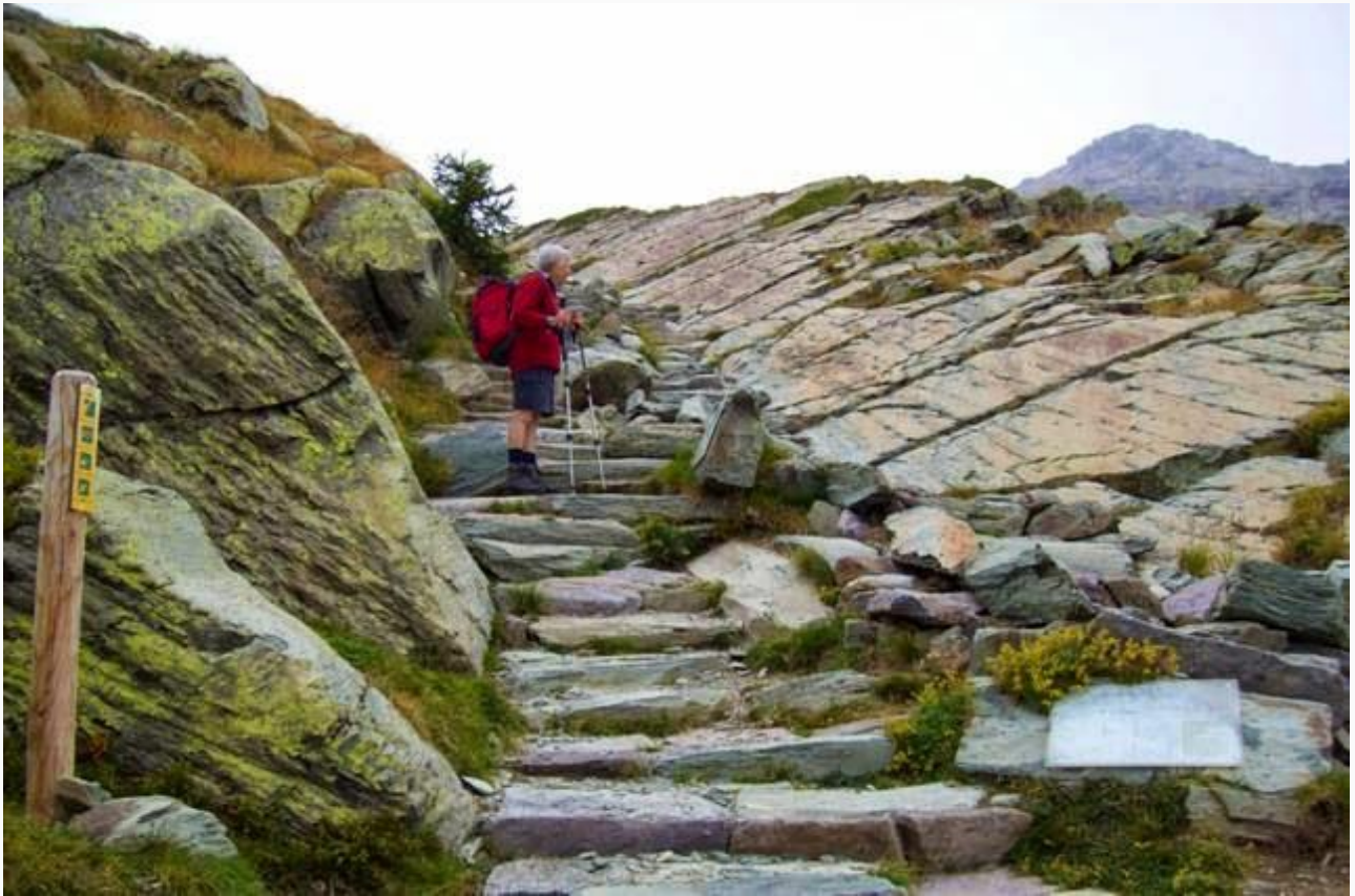
Una zona graffiti nella valle di Fontanalba