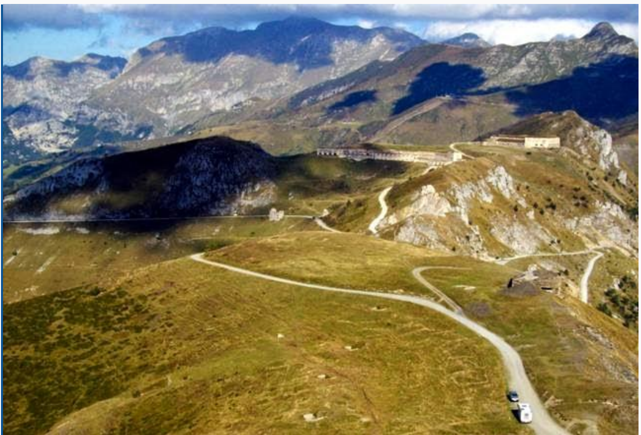
Il forte centrale e la breve strada che sale dal colle di Tenda al centro, da sinistra la strada che arriva dall'Italia, a destra quella (chiusa) che scende in Francia, qui sotto quella che va