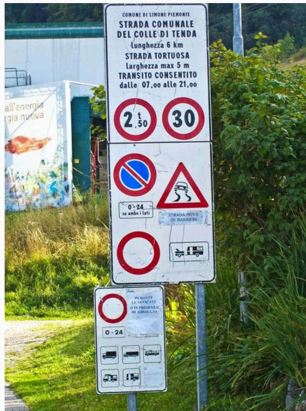
Il cartello che dal lato italiano vieta ai mezzi oltre 25 q. di salire al colle. Le successive specificazioni sull'appendice (che possono creare molti dubbi) riguardano, a detta dei vigili di Limone, il vicino piazzale di sosta ...