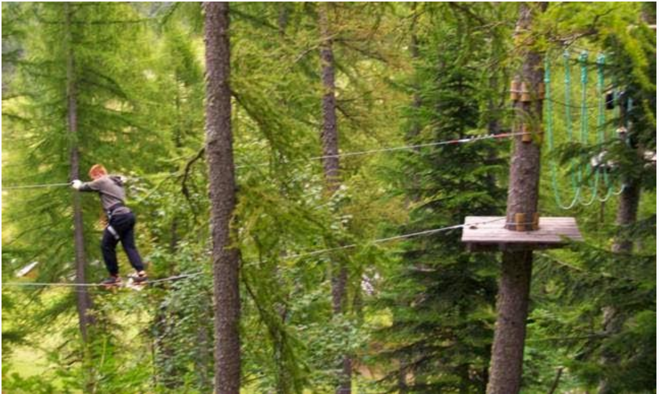
Un ragazzo nel parco giochi