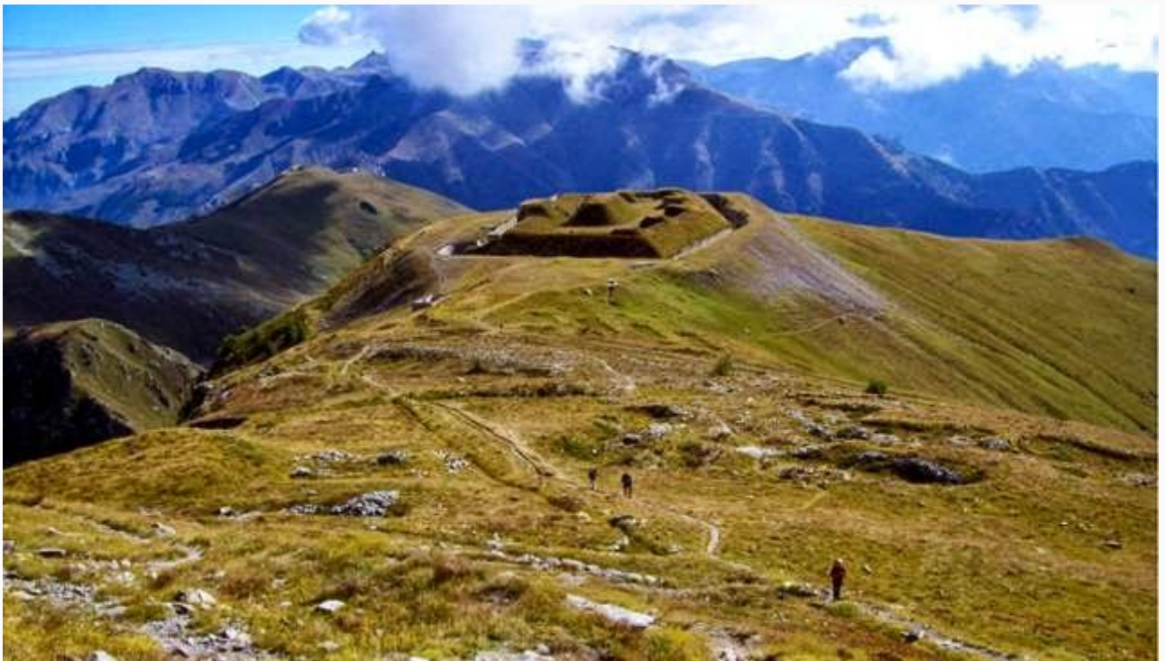
Circa a metà itinerario: uno sguardo indietro verso il forte della Giaura