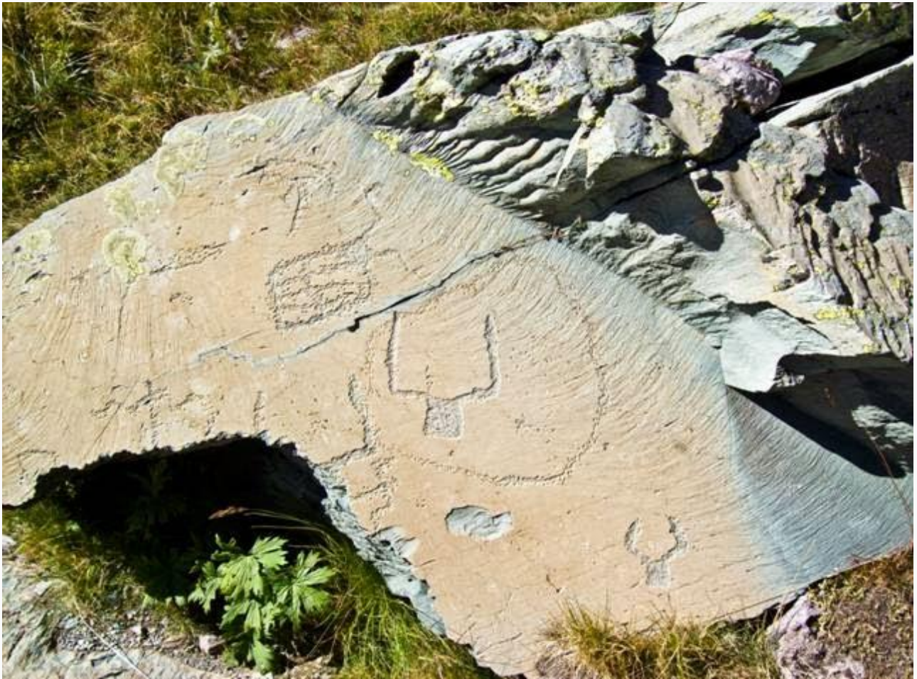
Graffiti di vandali ...