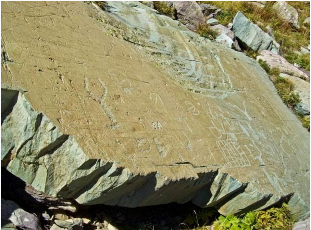
Graffiti originali e (foto successiva) particolare del cartello illustrativo