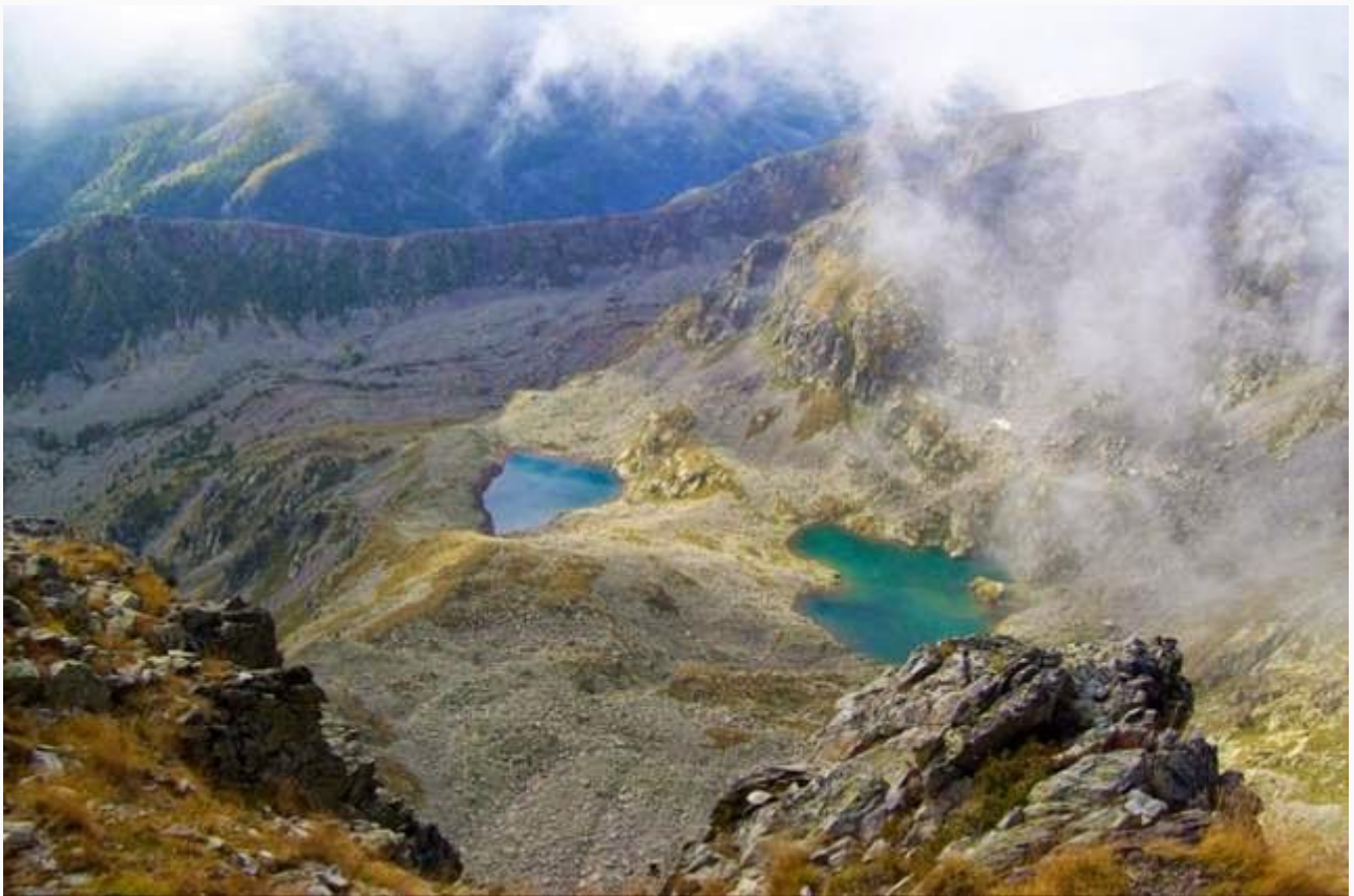
I laghi di Peyrefique dalla vetta