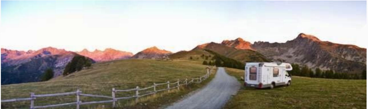
Alba alla Baisse di Peyrefique