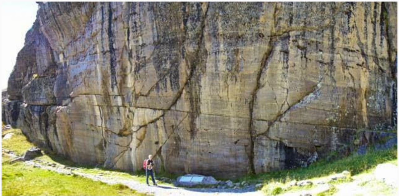
La grande parete con graffiti recenti (secoli scorsi): il vandalismo è storia antica ... ora proteggono le incisioni dei secoli scorsi! (nella foto successiva: un particolare)