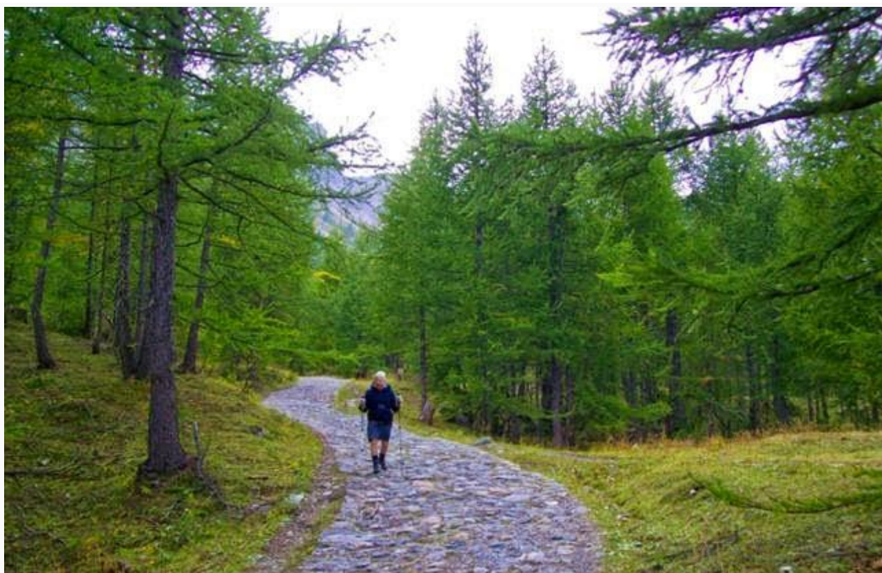
La salita della valle di Fontanalba a tratti è su splendide strade