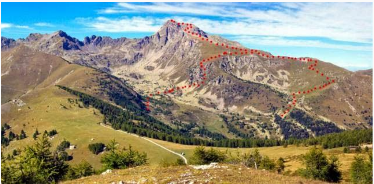
Da un rilievo accanto alla Baisse de Peyrefique un'immagine della Rocca dell'abisso con una traccia (approssimativa!) degli itinerari