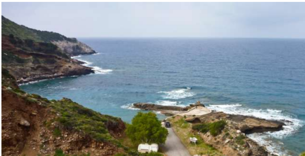
50 - Lykodimou