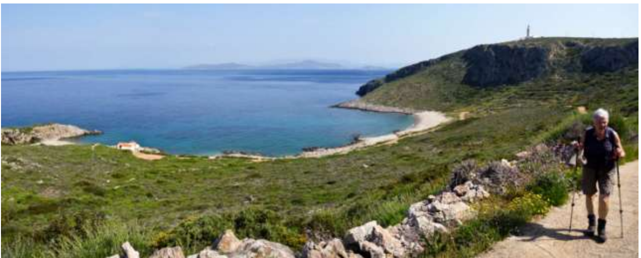
47 - Ag. Nikolaos e sullo sfondo l'isola di Elafonissos.