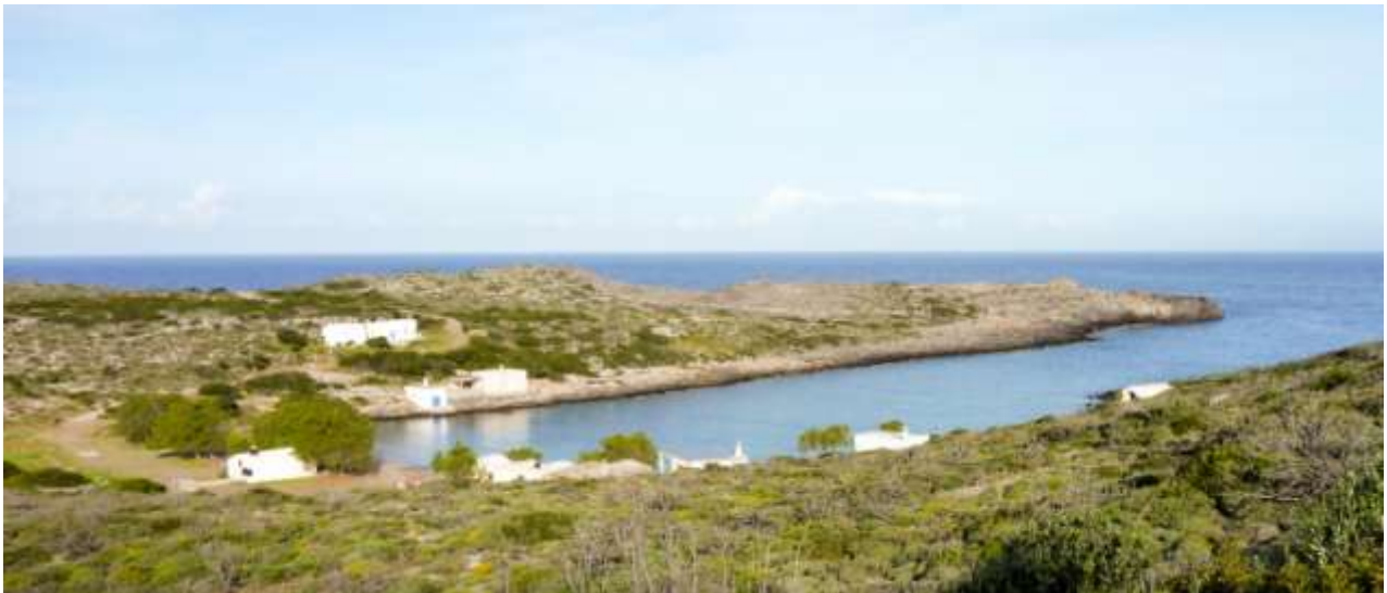
38 - Limnionas.

Nelle vicinanze - I ruderi del castello veneziano e le grotte di Agia Sofia sulla strada di avvicinamento.