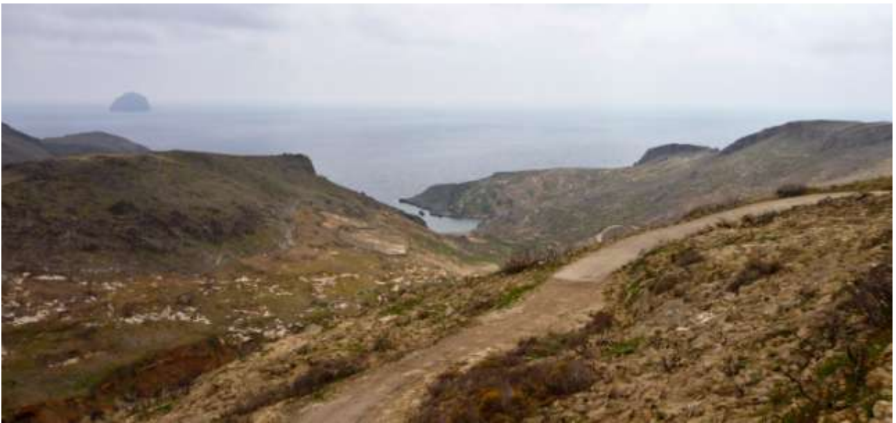
30 – La sterrata finale di discesa è tra le peggiori ...! Ma la zona di sosta, poi, è ottima.

Per arrivare - Piuttosto lungo ed impegnativo! Da Livadi seguite le indicazioni (anche per il monastero di Kosmas), fin qui strada buona, a tratti stretta, ma sempre asfalto o cemento. Il fondo liscio prosegue ancora poco dopo il monastero e poi una lunga discesa sterrata verso la spiaggia (di solito viene sistemata in maggio, prima è proibitiva eccetto che per veicoli adatti).