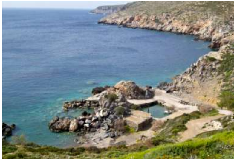
34 - E' davvero piccolissimo! E ripido.

Per arrivare - Dal monastero di Myrtidion (il centro di culto più amato nell'isola: dispone anche di foresteria con molte stanze - fino al monastero arrivano anche i pullman su strada asfaltata e ben segnalata) si prende una stretta stradina verso nord che scende in un paio di chilometri al piccolo molo di protezione del porticciolo.