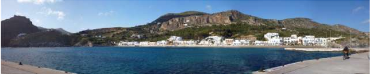
22 - Sempre la prima baietta. In bianco, a metà parete rocciosa, vedete la chiesetta con la grotta di S.Giovanni.