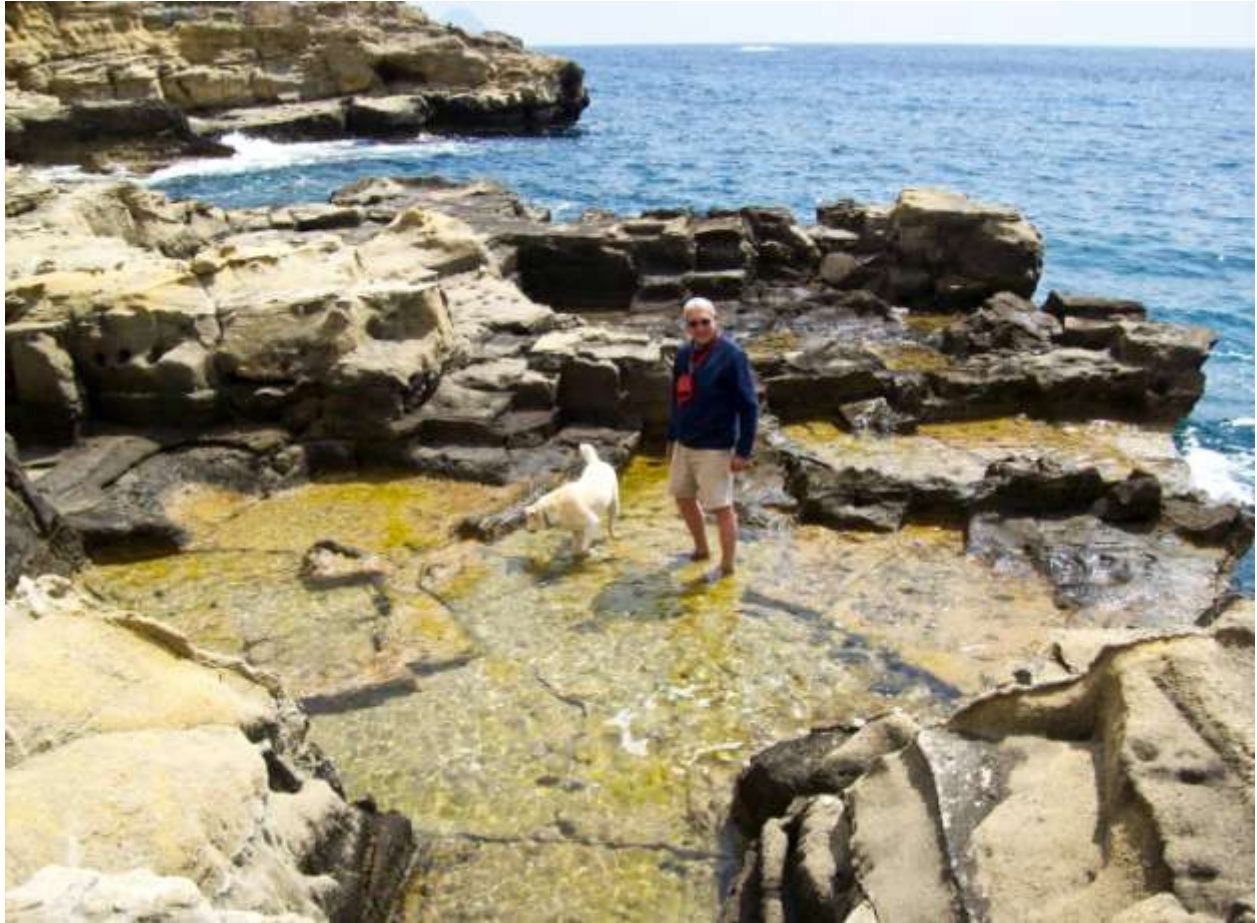
29 - Gli intagli di antichi gradini e “vasche” (sulla sinistra della piccola baia con la spiaggia). (meteo) (torna al sommario delle schede)