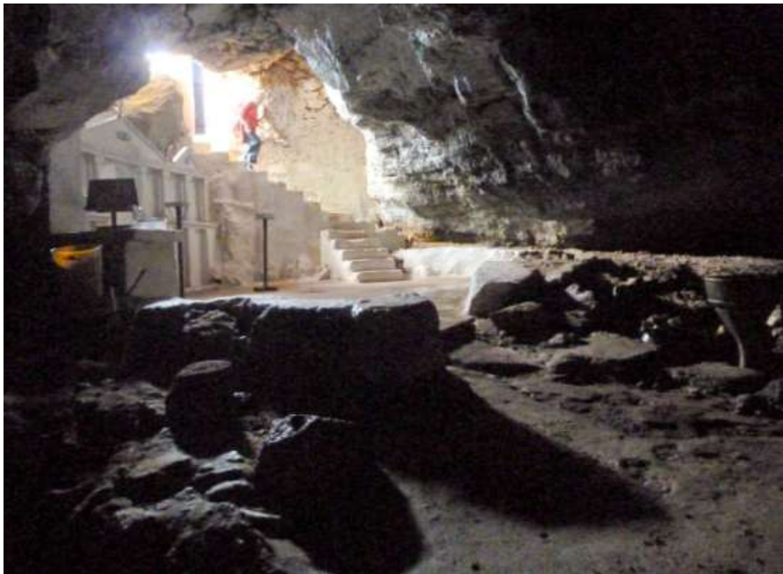
28 - La grotta con la chiesa di Agia Pelagia (nella scogliera a bordo mare prendendo la stradina a sinistra alla casa isolata, poco prima della spiaggia).