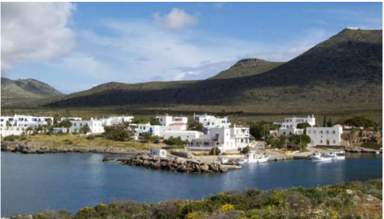
11 - Il porto dove abbiamo sostato. (Un rubinetto piuttosto malridotto dell'acqua, cisterna, alla piccola spiaggia in fondo sulla destra appena fuori quadro).