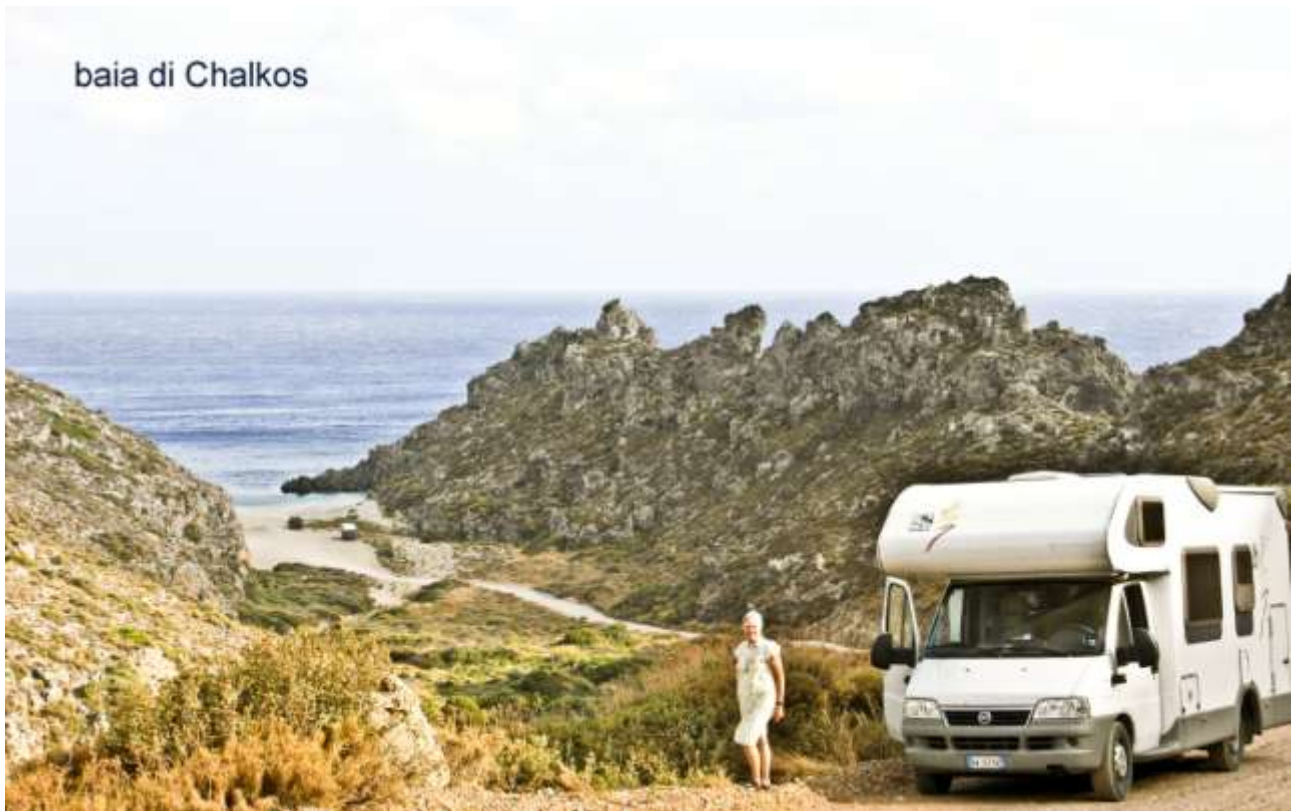
17 - La discesa finale su Chalkos.

Per arrivare - Sulla strada verso l'abitato di Kalamos (che è molto sparso) trovate all'inizio un cartello che vi indirizzerà verso questa baia: prima asfalto, poi sterrata fattibile solo quando è ben sistemata perché il tratto finale è piuttosto ripido.