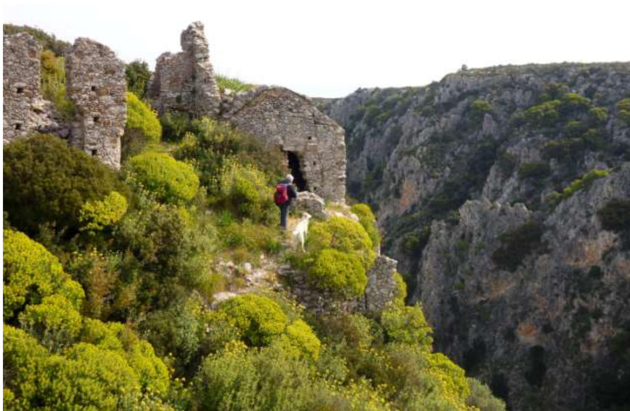
8 - Paleochora.

(meteo) (torna al sommario delle schede)