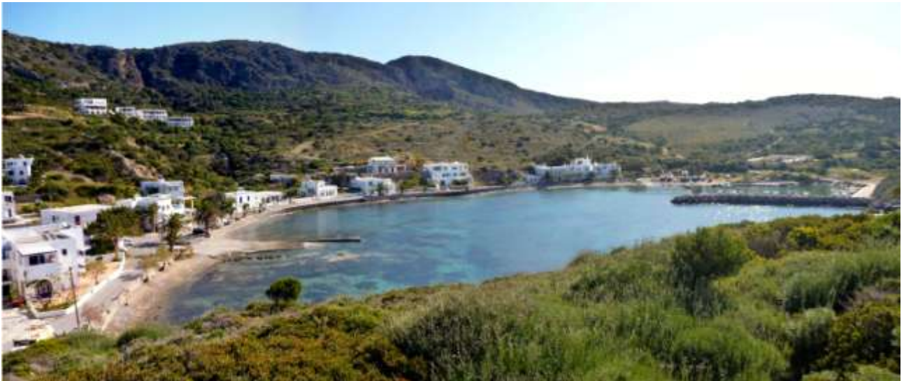
23 - La seconda baietta con il porto dei pescatori.