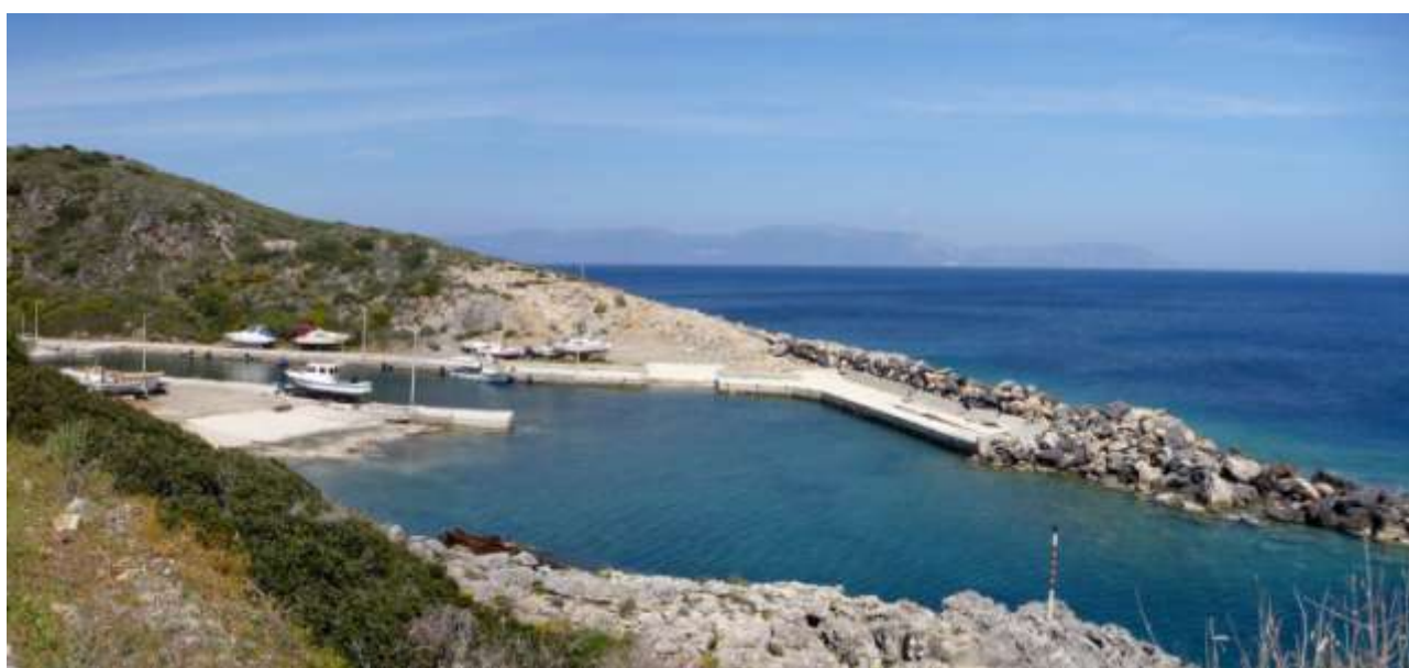
44 - Agia Patrikia: sullo sfondo capo Maleas.