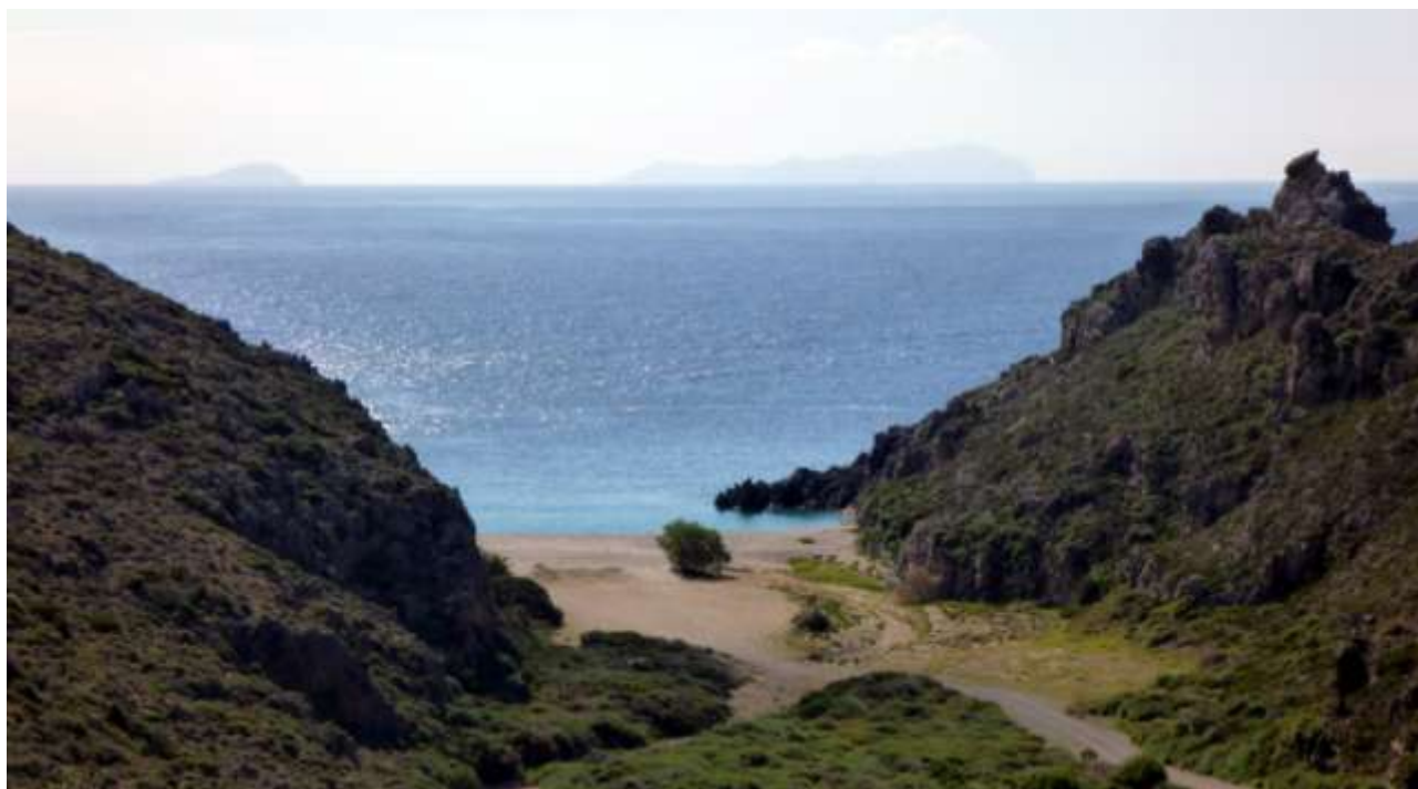
18 - All'orizzonte l'isola più grande è Antikythira.