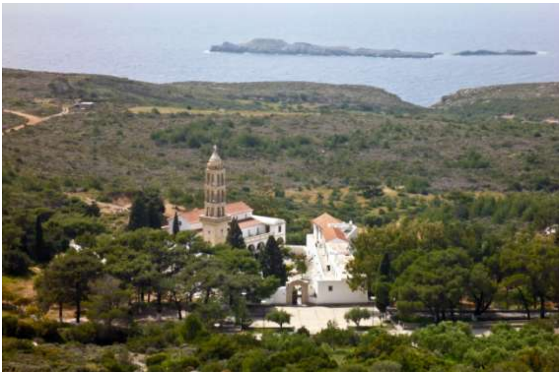
35 - Moni Myrtidion.