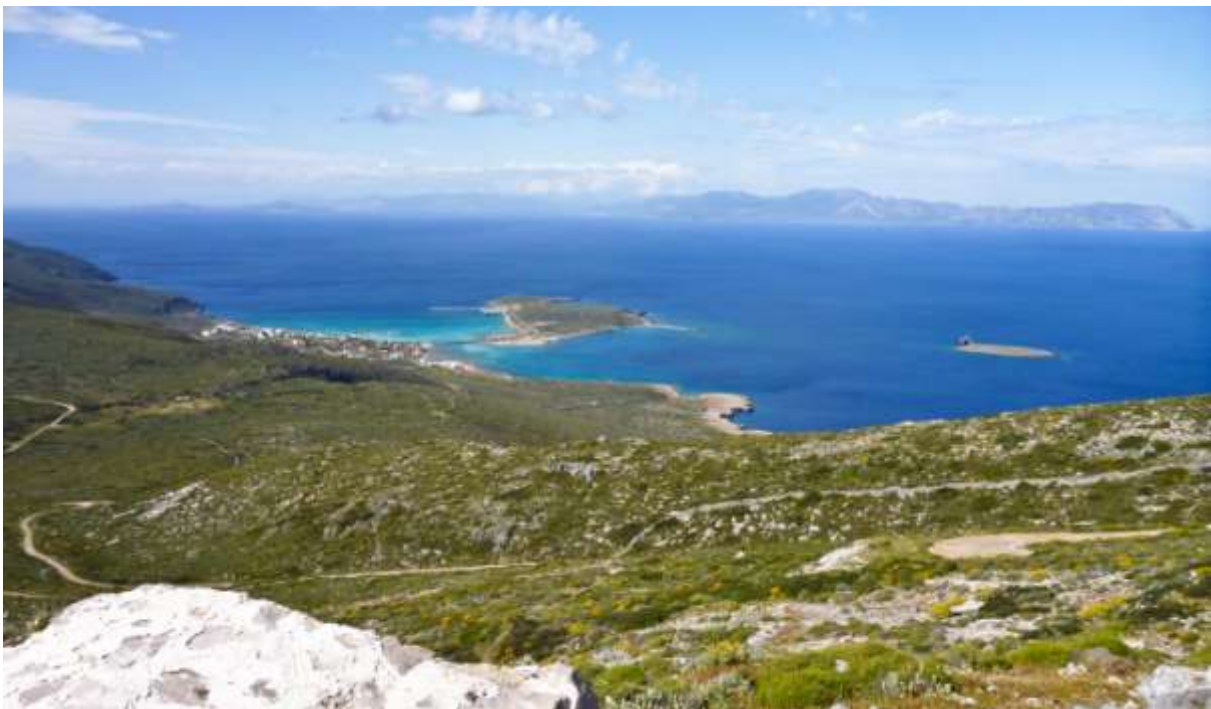
3 - Diakofti e, all'orizzonte, capo Maleas e la punta del terzo dito.

I resti bizantini di Paleochora: un sito affascinante a picco (e dire "a picco" è proprio la parola giusta! Vedrete) sulle gorges di Lagadi; si raggiunge con facilità prendendo il bivio a destra (ben segnalato) poco sopra Vamvakaradika (prima asfalto, poi sterrata buona).