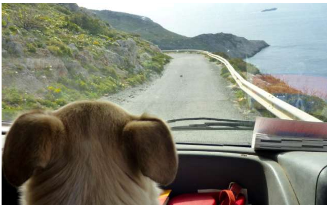
40 - Il tratto stretto ed esposto della strada.

(meteo) (torna al sommario delle schede)