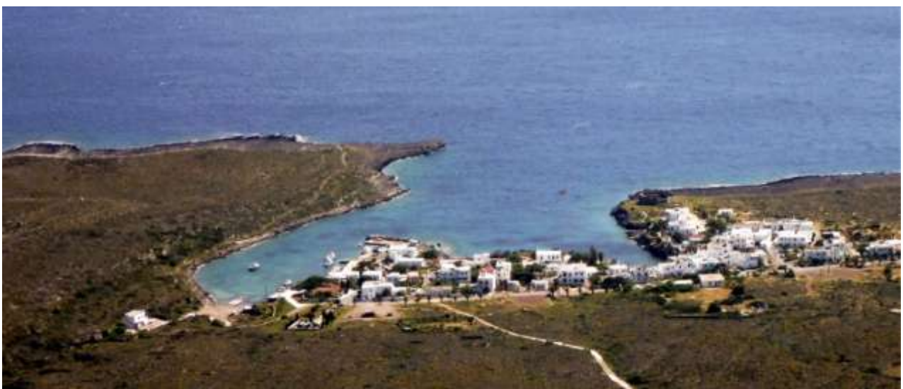
9 - Avlemonas.

Per arrivare: all'estremo sud della baia di Avlemonas si imbecca una strada asfaltata (molto panoramica nel suo sviluppo successivo) svoltando a sinistra su un ponte verso Ag. Ilias. Alla prima salita trovate la deviazione a sinistra per Kaladi (piccolo cartello artigianale): stradina, questa, molto stretta in asfalto e poi cemento fino ad un gruppo di ville di recente costruzione, prosegue poi malamente (verificate a piedi: meglio!) fino ad improbabili parcheggi su prato o ad uno spiazzo finale (difficilmente raggiungibile per ora: la strada è pessima) molto panoramico (dove restare imbottigliati quando si riuscirà a parcheggiare lì!).