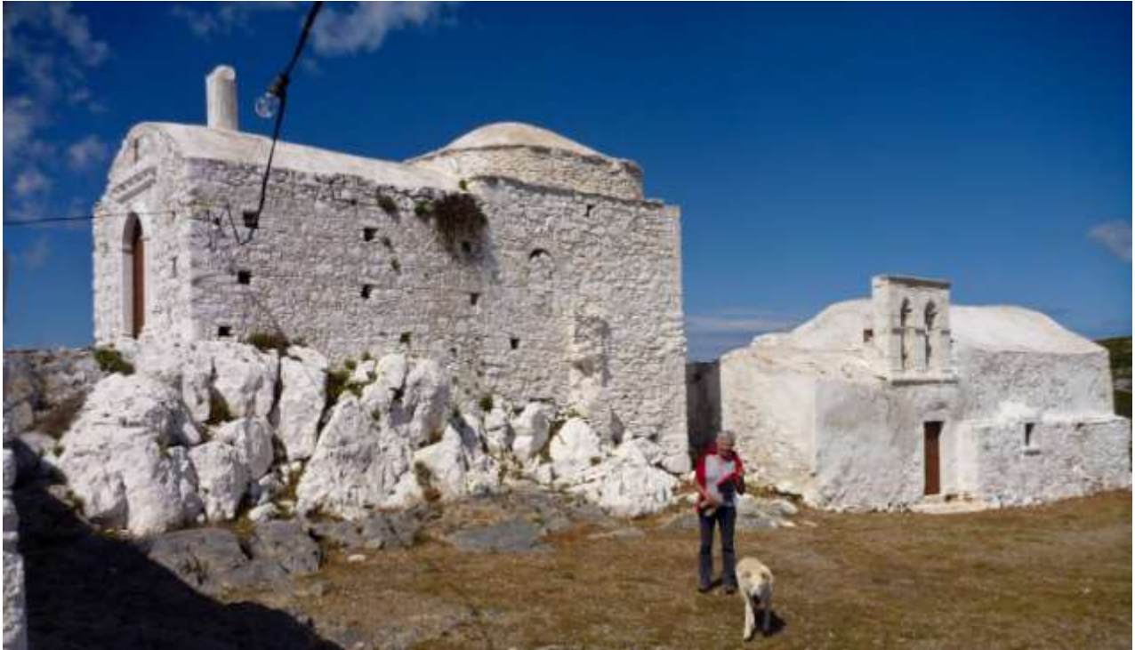
12 - La chiesetta di Ag. Giorgis sulla cima a destra della foto precedente: si raggiunge in poco più di un'ora a piedi.