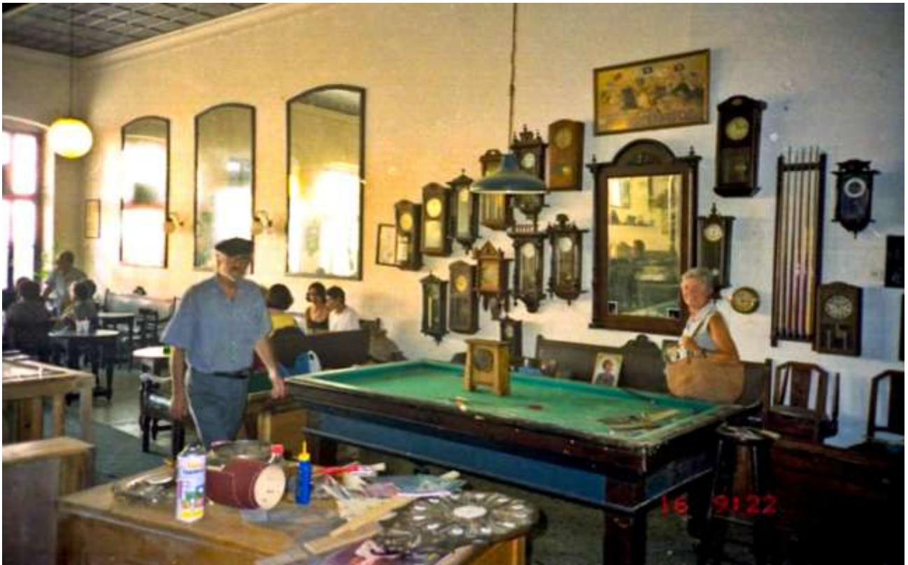
2 - Questo era l'antico "kafenyon"! Ora, ahimè, "ristrutturato" (è proprio quello di fianco alla grande chiesa del paese).