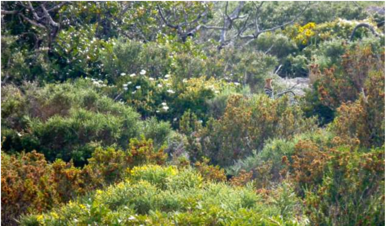
36 - Vedete l'upupa?