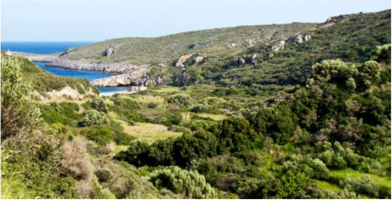
45 - Fourni in aprile.