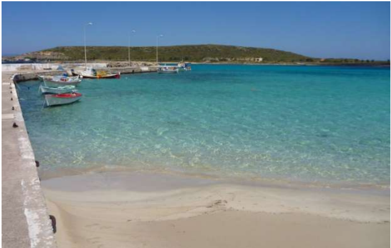
6 - La spiaggia a ridosso del porticciolo pescatori.