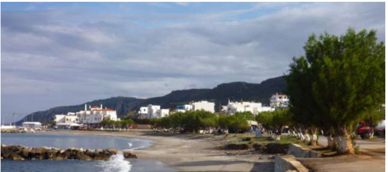
42 - Agia Pelagia.