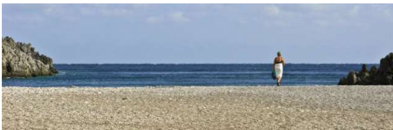
19 - Settembre ... spiaggia affollata!

(meteo) (torna al sommario delle schede)