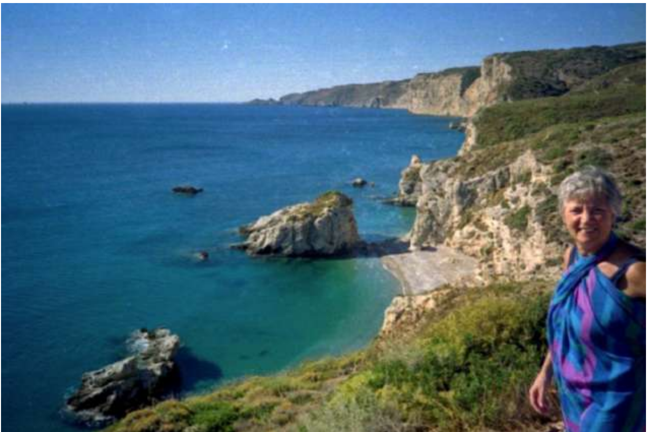
13 - Kaladi.

(meteo) (torna al sommario delle schede)