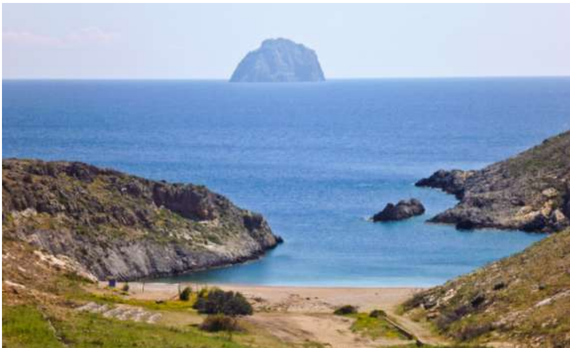
31 – L'isolotto di Chytra ("uovo"!)