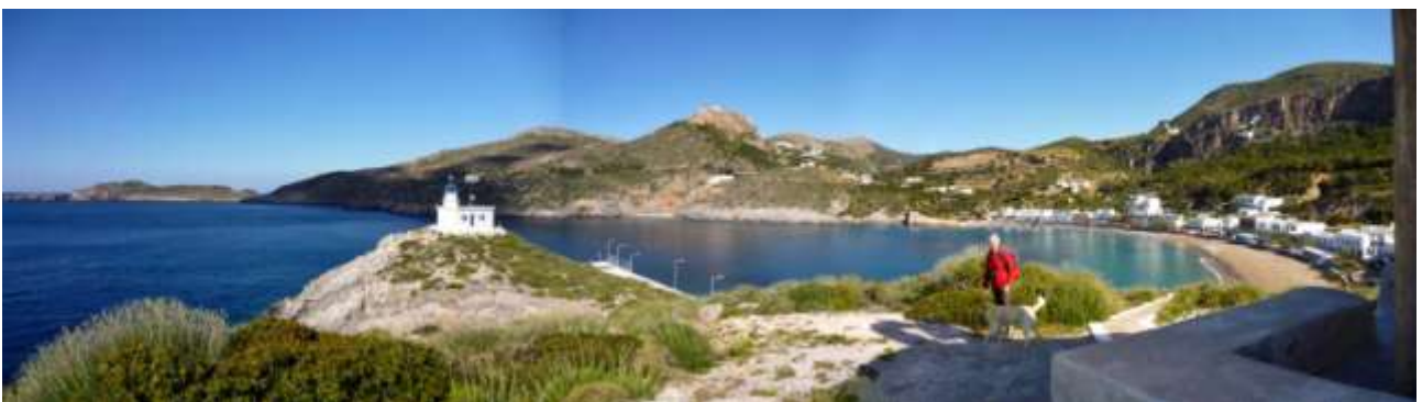
21 - Dalla chiesetta sul promontorio tra le due baiette uno sguardo verso il castello.