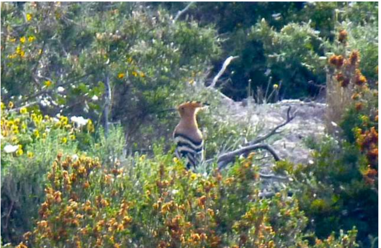
37 - Eccola qui!

(meteo) (torna al sommario delle schede)