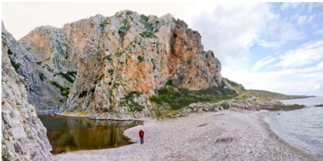
43 - Limni al fondo della strada costiera che scende da Agia Pelagia: a sinistra il “lago” ed a destra il mare.