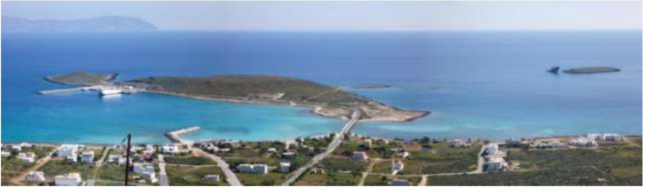
4 - A destra si vede la prua di una nave incagliatasi nel 2000 in quello scoglio, a sinistra, alla banchina, il traghetto da Neapolis.