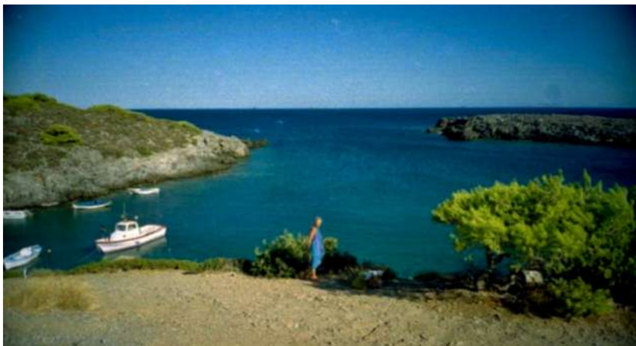
14 - La zona di sosta sopra la baietta con panorama su Antikythira e, nelle giornate più limpide, Creta.

Per arrivare - Dirigetevi verso Kalamos (abitato molto sparpagliato su delle alture), tralasciate il primo bivio con indicazione per Chalkos (prossima scheda) e proseguite verso est: troverete più oltre un'indicazione per Vroulea (questa è la strada migliore con una sola difficoltà, fuori stagione, alla prima vicina salita, poi tutto meglio!).