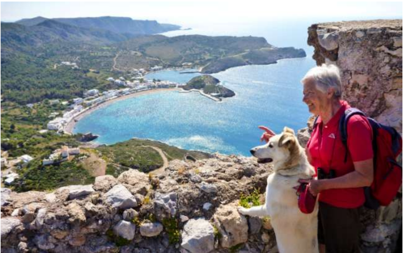
20 - Dal castello di Kythira le due baiette di Kapsali.

Per arrivare - E' in fondo all'isola, le due strade che la discendono finiscono lì!