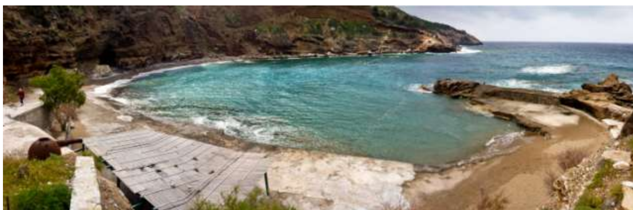
51 - Lykodimou

(meteo) (torna al sommario delle schede)