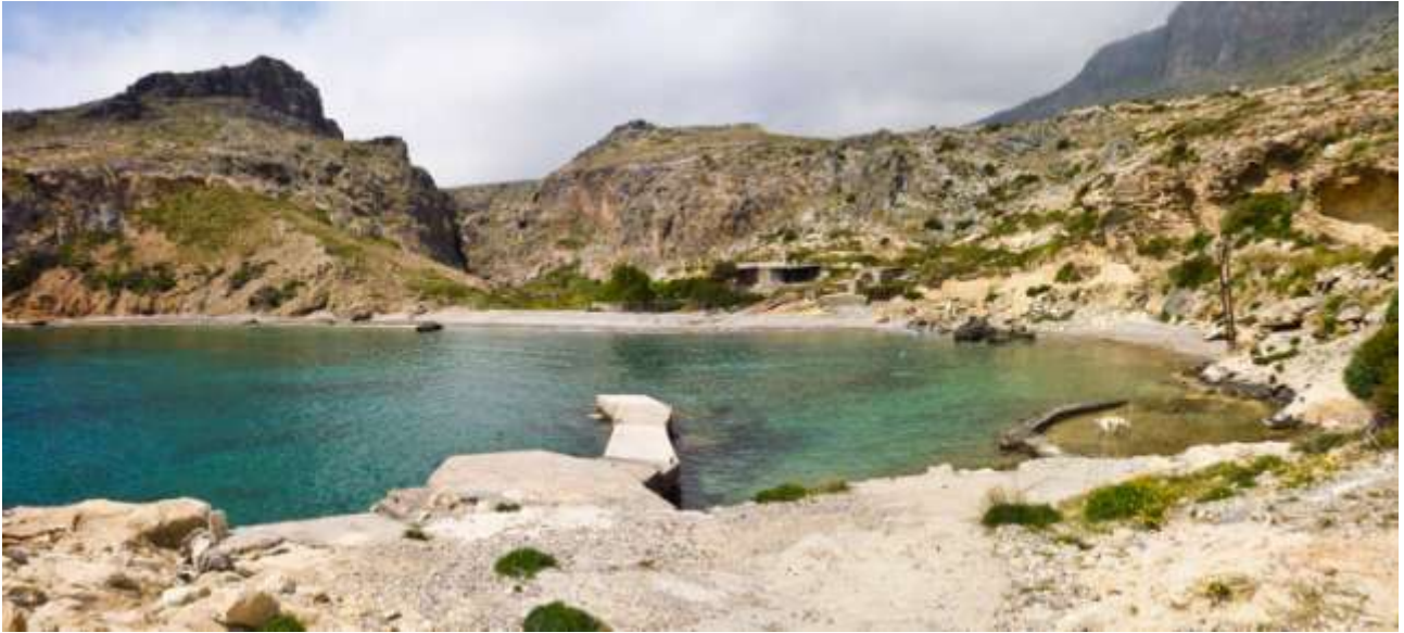
27 - la baietta con un angolo di acqua bassa racchiuso a destra dove Bianca esplora.