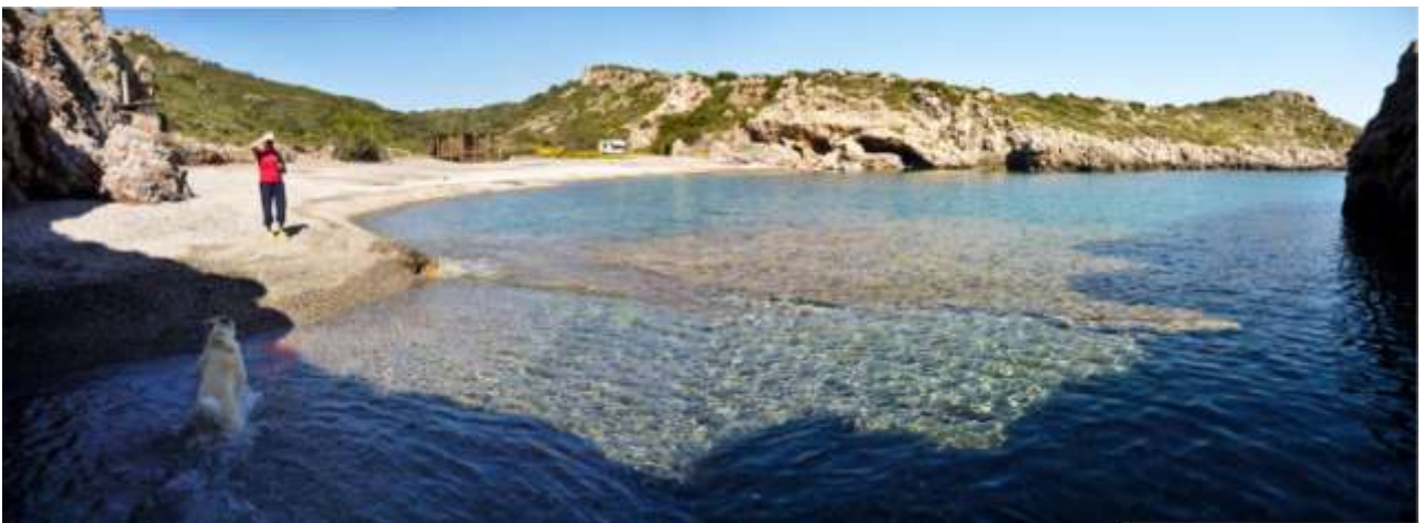
46 - Fourni.