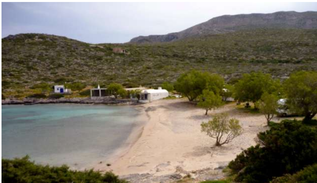
39 - La spiaggia.