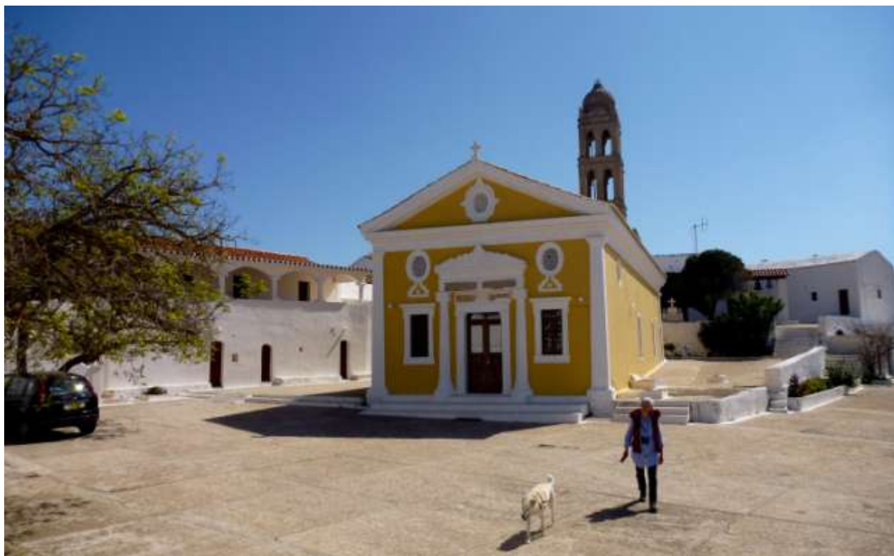
7 - Agia Moni.