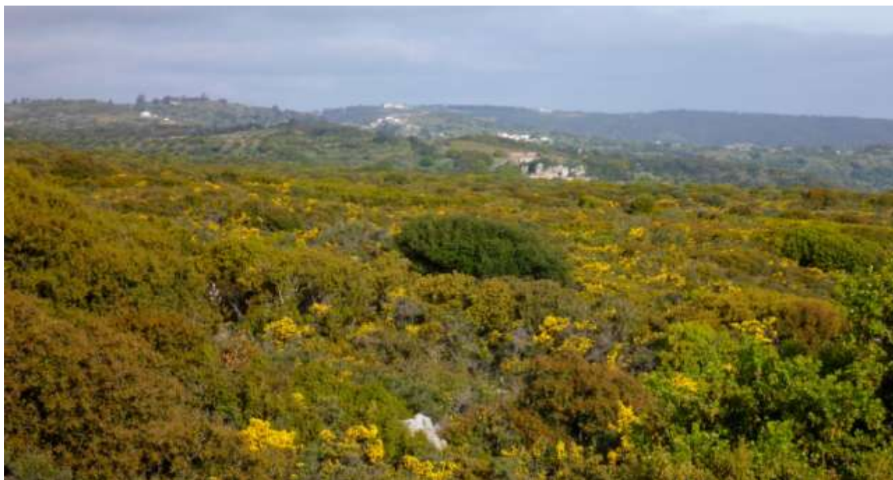
49 - Il nord dell'isola in aprile.