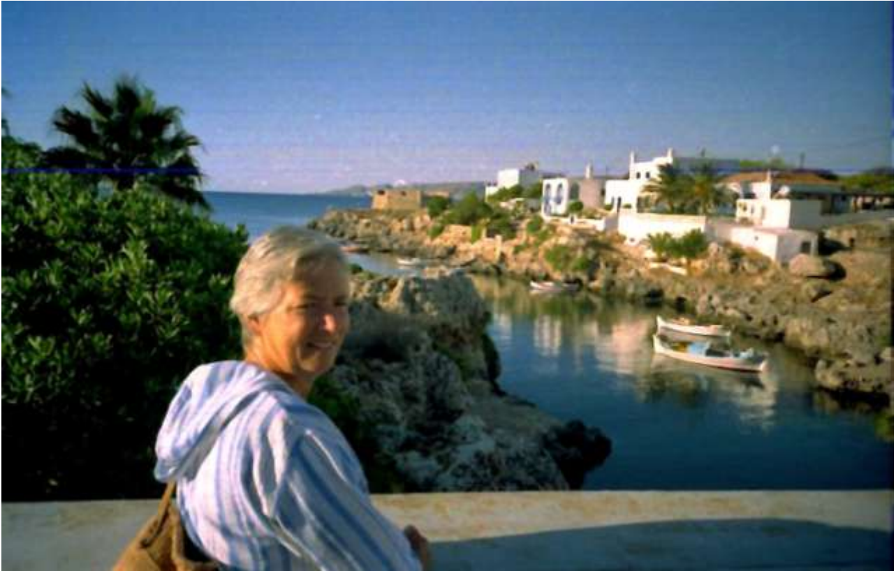
10 - In centro paese la bella zona ora allestita per piacevoli tuffi e bagni: acqua limpidissima!