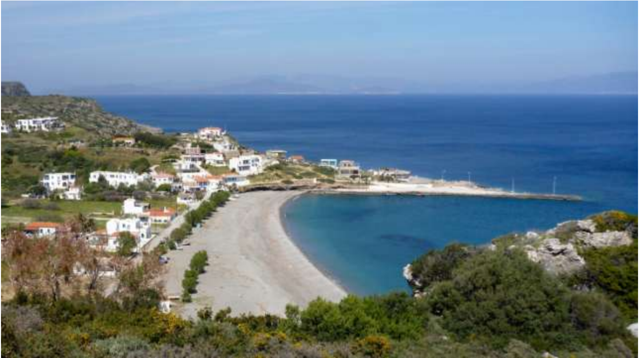
41 - Platia Ammos: vedrete una splendida alba sul mare al largo di capo Maleas (la cima del "terzo" dito, la Laconia) proprio di fronte a voi.

interamente asfaltata da un bivio ben indicato appena a sud di Potamos, ma ... il finale è ripidissimo, pur se asfaltato! Ma lo fanno anche con macchine normalissime.