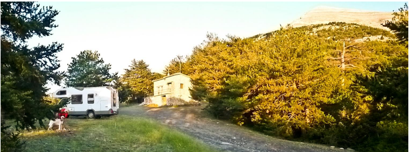
3 - Questa volta siamo riusciti ad arrivare accanto al rifugio con il camper ...! Solo noi (feriale luglio 2015): la vetta è quella che vedete nella foto all'alba. Posto magnifico e ...