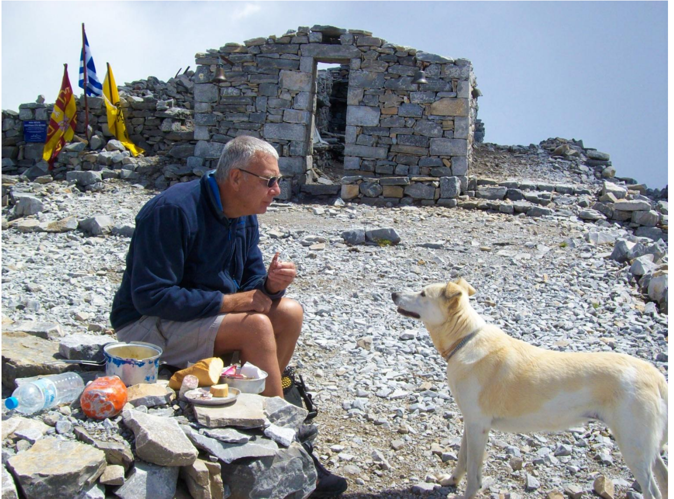
9 – Ho cercato di spiegarle che non si fa ... lei mi ascolta con grande attenzione, ma poi ci ricasca!