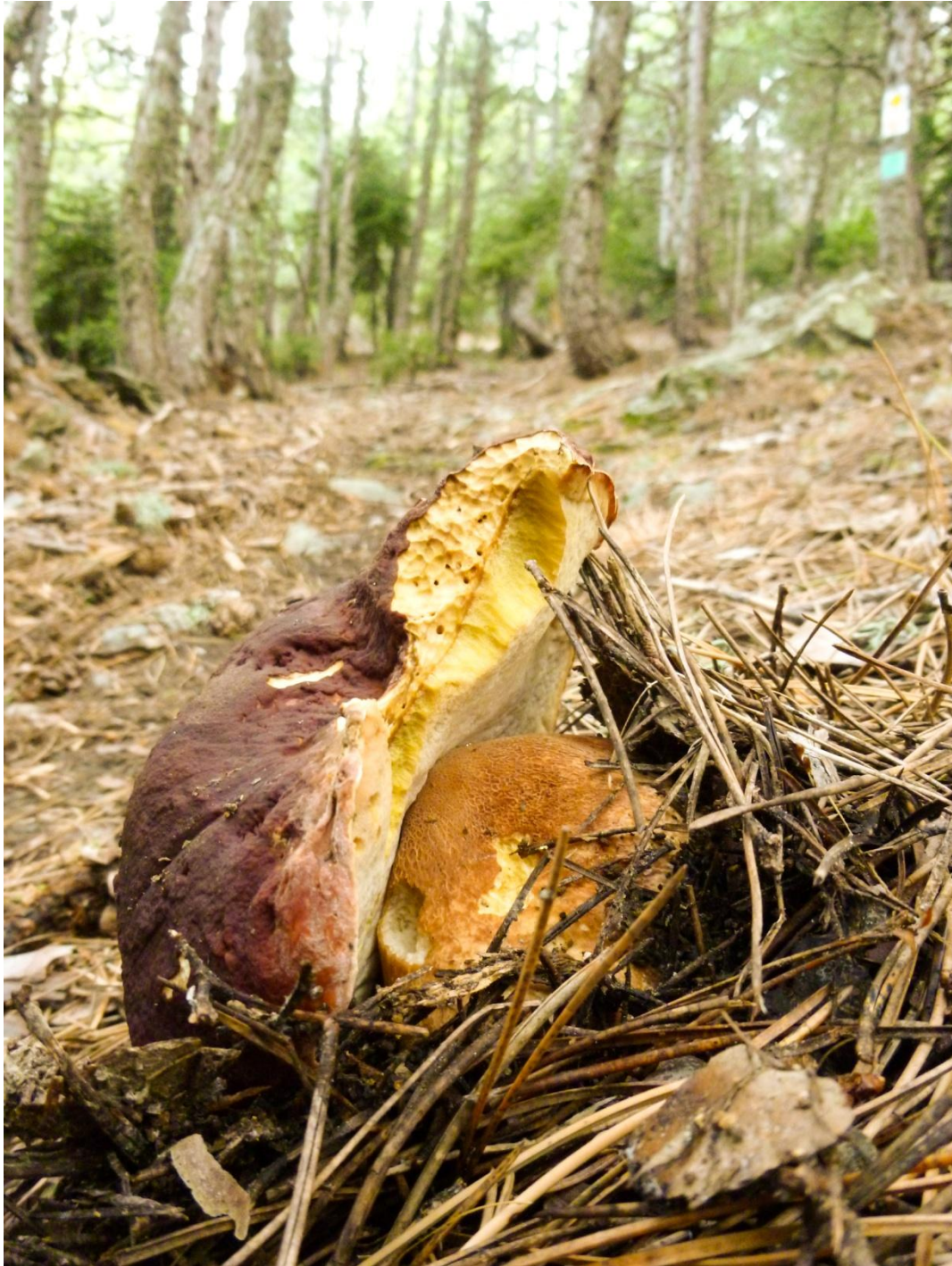
4 - ... abbiamo trovato diversi magnifici porcini nei boschi appena sotto lungo la strada di arrivo (lungo il sentiero che fa da scorciatoia pedonale)!