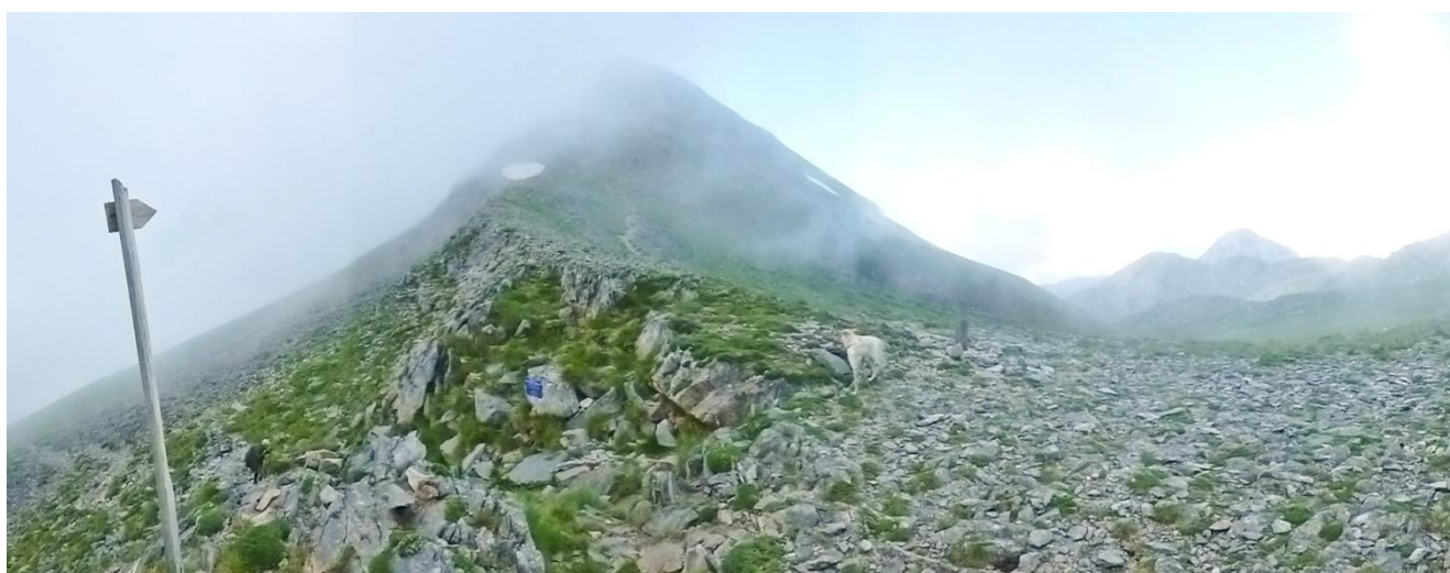
7 - L'uscita sulla dorsale finale (a sinistra - est - temporali, a destra - ovest - sole). In breve, meno di quanto pensiate, arrivate diritti in vetta: quella che vedete (niente false cime con dietro altre ancora da salire come capita spesso in montagna ...)!