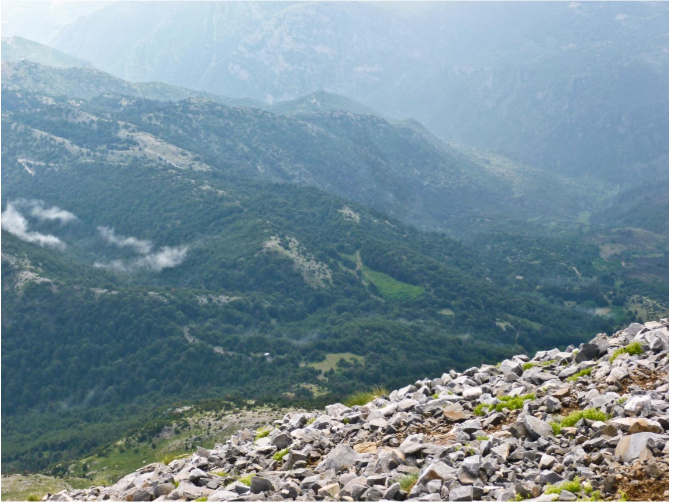
12 - Dalla vetta uno sguardo verso il camper accanto al rifugio (invisibile): il puntino bianco a sinistra del prato a centro foto in basso.