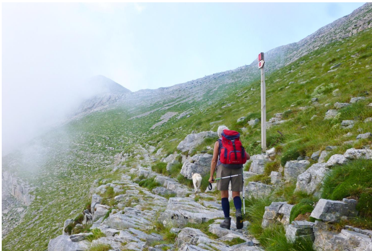
6 - Le "placche": il famoso bel diagonale (qui ci siamo presi una grandinata in questa occasione!) che vi porta con facilità appena sotto alla breccia di accesso alla dorsale finale.