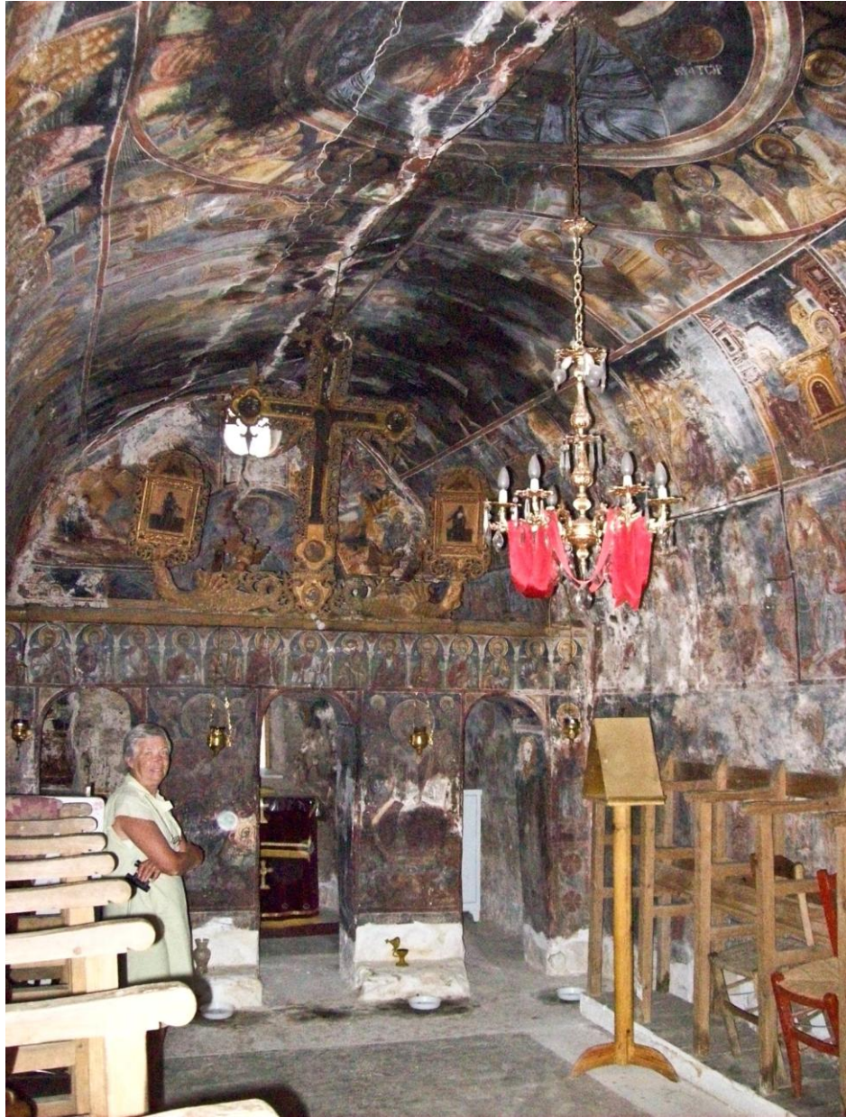
13 - Gli straordinari affreschi bizantini della fatiscente e sconosciuta (ai più) chiesetta di Toriza (paesino poco discosto sulla sinistra dalla strada asfaltata di salita, ampio piazzale alla chiesa).