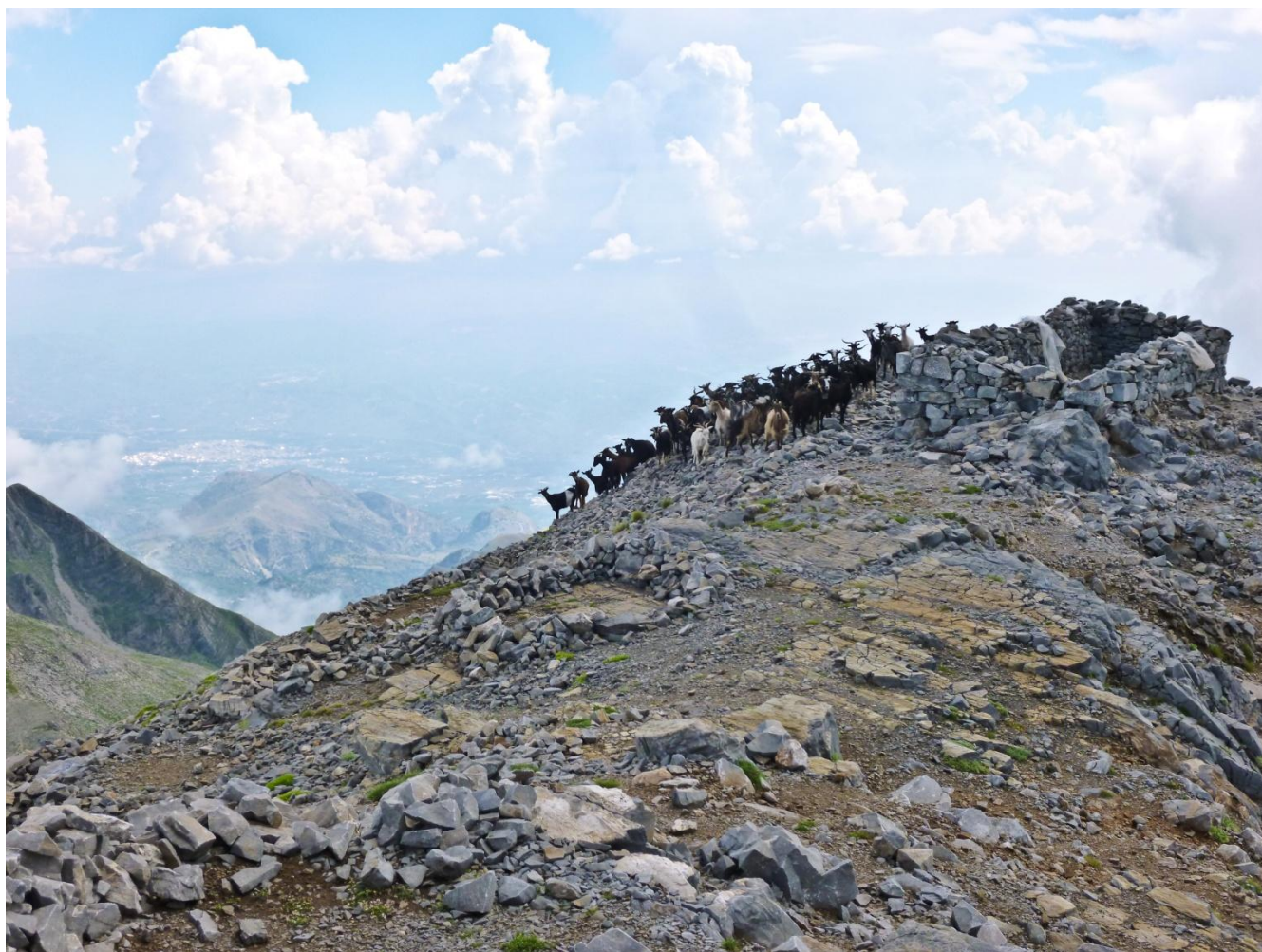
8 – Bianca (la nostra cagnetta) ha “portato su” tutte queste capre dal colletto della foto prima fino in vetta ... (laggiù vedete Sparta sulla sinistra).