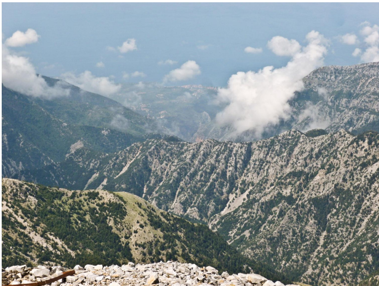
11 - Laggiù Kardhamili (scheda 8).