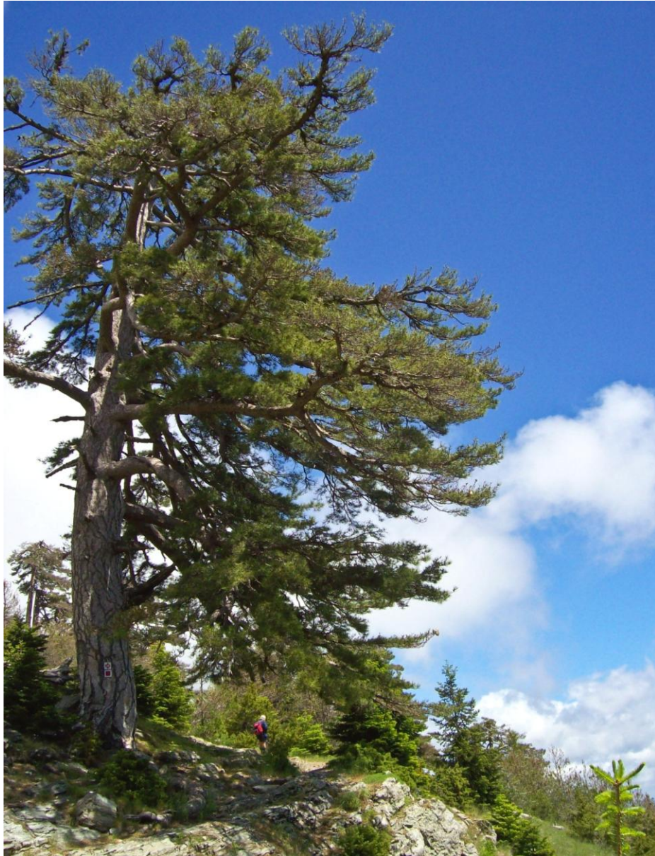
5 - Il sentiero di salita appena dopo il rifugio.