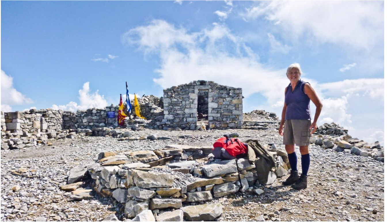
10 - In vetta abbiamo avuto qualche sprazzo di buon tempo ... qui vedete l'ampio spiazzo della chiesetta (anche lei senza tetto!).