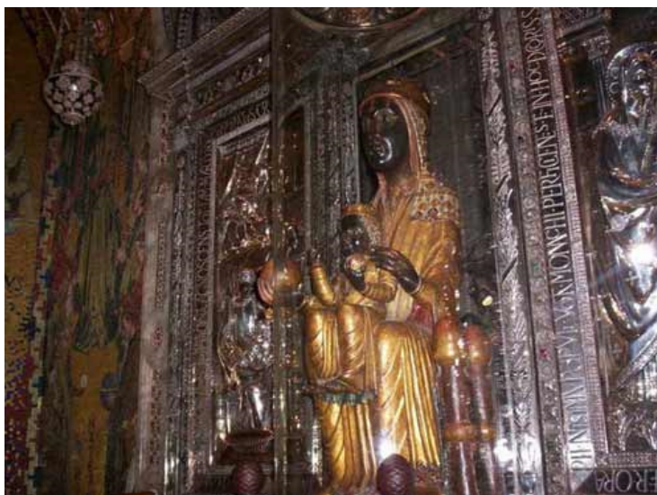
La vergine nera di Monserrat

Arriviamo per le 13,00. È ora di pranzo per cui decidiamo di mangiare. Parcheggiamo il camper nel parcheggio delle funivia. Terminato il pranzo, alle 14,30 prendiamo la funivia è arriviamo al monastero. Per raggiungere il monastero vi sono anche altre due possibilità. Via strada, ma è un po' complicato per via delle dimensioni dei nostri mezzi, oppure attraverso un trenino a scartamento ridotto. Preferiamo andare con la funivia, in modo da poter fare anche delle splendide foto al panorama stupendo che abbiamo sotto di noi.