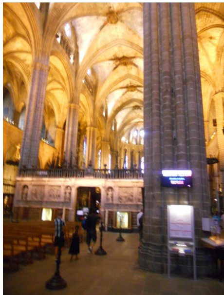
Cattedrale di Barcellona

Usciti dalla cattedrale, continuiamo la nostra scoperta di Barcellona attraversando la Placa san