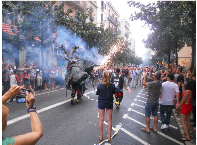
Festa Major de Gràcia

Riprendiamo la metropolitana e raggiungiamo il Barrio Gracia (Barrio=quartiere) . Caratteristica del Barrio Gracia , (resosi indipendente da Barcellona nel 1856 fino a quando venne nuovamente riassorbito dalla città nel 1897) è la forte tradizione politica il suo cosmopolitismo. Il suo dedalo di stradine ha da sempre attirato artisti e scrittori e oggi il quartiere ospita numerosi negozi alternativi, botteghe artigiane, mentre bar e piazze pullulano ogni sera di vita. Ma siamo soprattutto venuti qui per la " Festa Major de