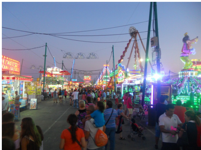
Feria al Recinto ferial Cortijo de Torres

Dopo il pranzo andiamo a visitare la casa natale di Pablo Picasso . La casa della famiglia Picasso si trova in Plaza de la Merced 15 , oggi sede della fondazione Picasso . In questa casa Picasso visse i primi 10 anni della sua vita, per poi trasferirsi a Barcellona e in seguito in Francia dove morì. Veniamo a sapere curiosamente che suo nonno si chiamava Tommaso Picasso e proveniva dalla provincia di Genova. Buona parte della casa natale di Picasso è stata trasformata in museo, un tributo alla vita e alle opere del grande artista. L'ampia collezione è suddivisa su quattro piani. Le mostre permanenti includono 4000 opere di Picasso e di artisti che si ispirarono a lui. Terminata la