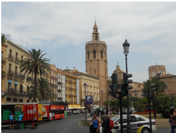
Cattedrale di Valencia

principale o “de los Hierros” (dei Ferri - Barocca), Portale degli Apostoli (Gotica) e Portale del Palazzo (Romanica). Il campanile della Cattedrale è stato costruito tra il XIV ed il XV secolo. È una torre a pianta ottagonale con un'altezza di 50 metri, di marcato carattere gotico che si trova accanto al barocco Portale dei Ferri.