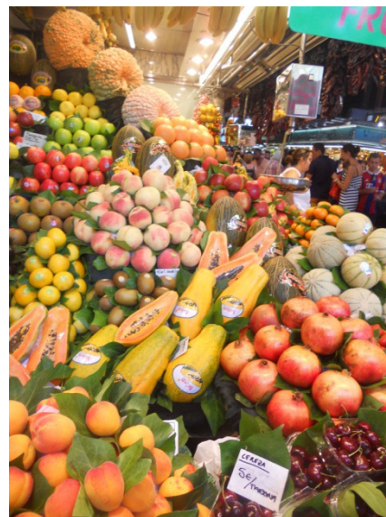
mercato della Boqueria

Usciti dal mercato ci dirigiamo verso Placa de Catalunya . Qui si concentrano la finanza, il commercio, ed il turismo della capitale catalana, ed è un luogo di ritrovo, perché è il punto da cui le Ramblas scendono verso il mare e da cui prende origine il Passeig de Gràcia , altro frequentatissimo ed importantissimo viale. Oltre a questo è un importante snodo dei trasporti pubblici. Nel frattempo si è fatta ora di pranzo per cui mangiamo al sacco in un giardinetto nelle vicinanze. Dopo pranzo ripercorriamo a ritroso Le Ramblas in direzione del porto, e arriviamo al quartiere della Barceloneta . La Barceloneta è uno dei quartieri più frizzanti di Barcellona. Dopo aver attraversato i suoi vicoli pieni di bar e ristoranti di pesce, ci ritroviamo in una spiaggia zeppa di gente. Quello che un tempo era il barrio di pescatori, marinai e dei loro vizi, oggi è un quartiere di gente umile che non ha perso la sua atmosfera allegra e sbarazzina. Ci facciamo una passeggiata sul lungomare, con la spiaggia piena di gente e