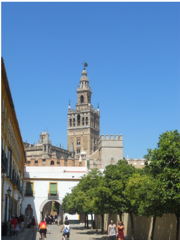
Torre della Giralda vista dall'Alcazar

gruppi di turisti come noi sfruttano ogni pezzettino d'ombra presente sulla piazza. Oggi ci sono 40°, ma la guida dice che poi non è molto. Per l'inizio della prossima settimana sono previsti 45°!!!