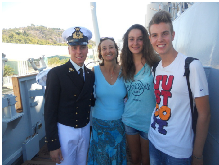
Noi 3 con un cadetto dell'Accademia Navale di Livorno

della 1ª classe dell'Accademia Navale di Livorno nella loro campagna estiva. Partiti dall'Italia 1 mese fa, hanno circumnavigato la penisola iberica, e sono arrivati fino a Londra. Questa di Malaga è la loro penultima tappa, poi andranno a Palermo, e termineranno la crociera a Taranto. Di fatto è la loro prima vera uscita in mare per un mese e mezzo su un'unità della Marina. Per tradizione la campagna è svolta sulla leggendaria nave scuola « Amerigo Vespucci » che quest'anno è però