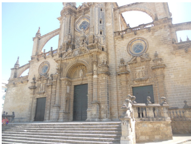
Chiesa di San Michele - Jerez

britannici avvenuti nel corso del XIX secolo, qui sono sorte numerose e prestigiose bodegas di sherry .