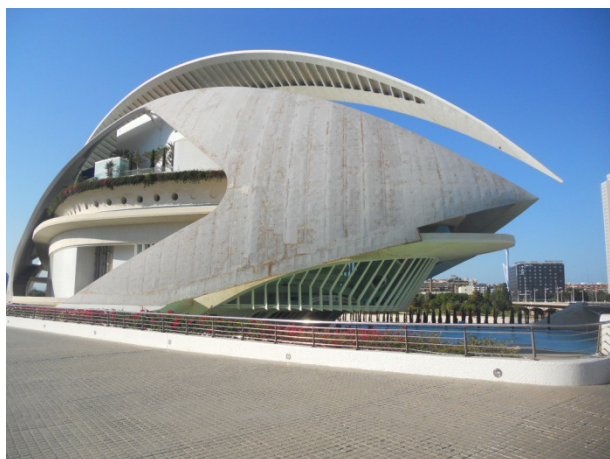
Palau de las Arts Reina Sofia

al pubblico il DNA, uno spazio dedicato alla musica, alla fisica ed anche alla scienza sportiva.