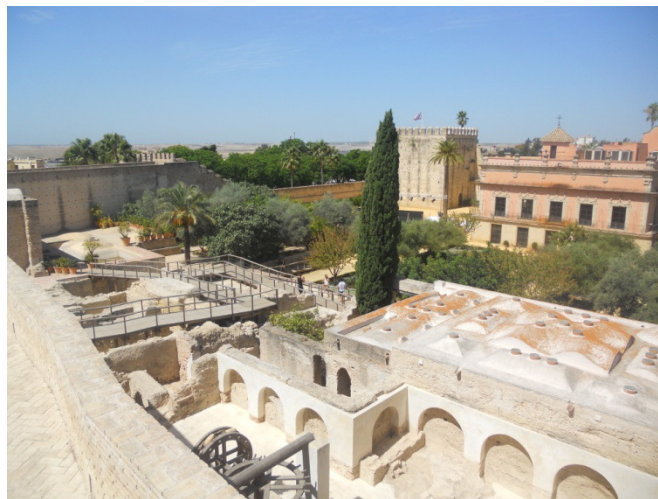
Alcazar di Jerez

Usciti dal sito ci fermiamo a mangiare per pranzo sotto un viale pedonale alberato. La temperatura sarà di circa 40°. Vicino a dove stiamo riposando c'è l'entrata degli stabilimenti di produzione dello Sherry Tio Pepe . Vogliamo entrare a visitarli, ma visti i prezzi, con o senza degustazione del prelibato liquore, decidiamo di desistere. Ritorniamo indietro verso Plaza de Arenal , ma essendo l'ora della siesta, non c'è nessuno in giro, e la piazza, e le strade limitrofe sono vuote. Sudiamo come dannati, e giusto un po' di brezza che prendiamo quando siamo in sella alle biciclette ci allieva dal gran caldo. Passiamo davanti alla cattedrale, che stranamente a quell'ora è aperta, entriamo per visitarla, ma anche lì si paga il biglietto quindi la vediamo solo da fuori. Decidiamo visto il caldo di ritornare