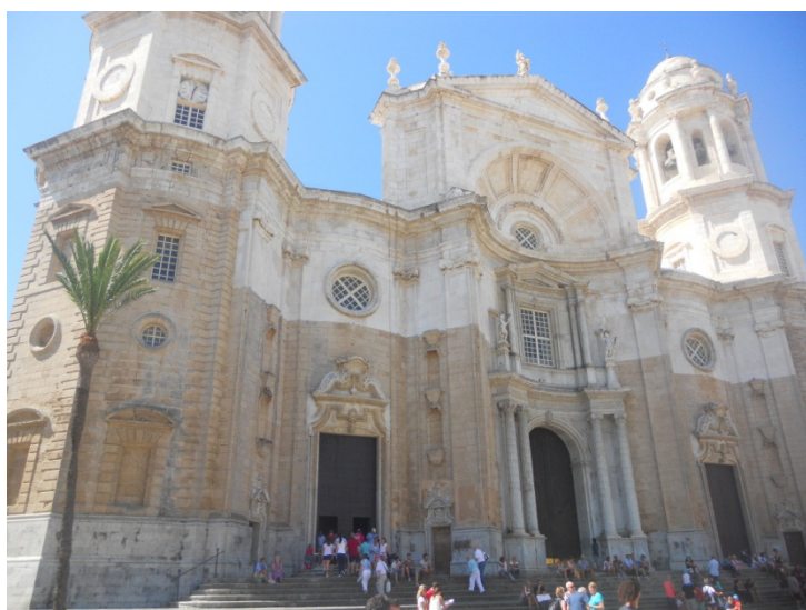
Cattedrale di Cadice

Partiamo alle 10,30 alla scoperta di Cadice con le bici. Andiamo al molo di Puerto S. Maria, e alle 11,35 prendiamo il battello che ci porterà a Cadice. Cadice è una graziosa città costiera arroccata su un promontorio sull'Oceano Atlantico che vanta un importante porto, molti musei, monumenti, e un centro storico affascinante avvolto dal mare e dominato dall'imponente cupola della Cattedrale di Cadice . Arrivati a Cadice, sbarchiamo, e andiamo subito a Plaza de la Catedral , a visitare la cattedrale. E'