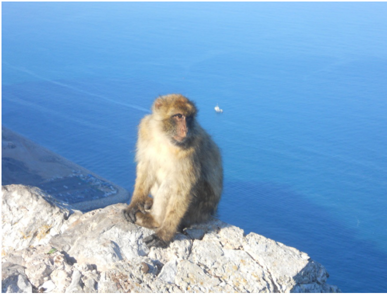
Scimmia della specie Macaca Sylvanus sul punto più alto della Rocca

Gates , la porta di accesso al centro città, e da lì entriamo al Grand casemates Square . Percorriamo la Main street , ma pur essendo le 17,30, i negozi (in perfetto stile Inglese) sono già chiusi.