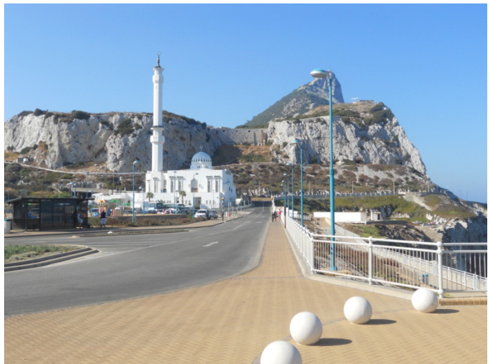
Moschea di Gibilterra, la più a sud del continente Europeo

Sconsigliamo di entrare con il mezzo in questo enclave inglese in terra spagnola. I parcheggi sono molto limitati e sempre occupati e le strade sono strette ed affollate. Suggeriamo di lasciare il veicolo nel grande parcheggio della cittadina de La Linea de la Concepcion, dove è situata la frontiera e poi prendere i mezzi pubblici. Alle 14,30, dopo un'ora di coda desistiamo, e entriamo dentro all'Alcaidesa marina ( Avenida principe de asturias s/n la linea de la conception-cadiz-espana ) che altro non è che un porto