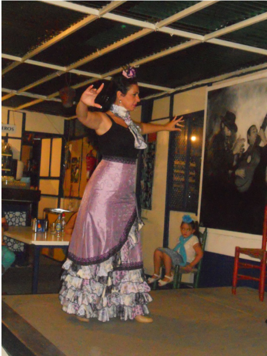
Ballerina di Flamenco a La Carboneria”

elettricità. Unico neo è tutta al sole. Ci sistemiamo vicino ad altri camper presenti (saremo in tutto