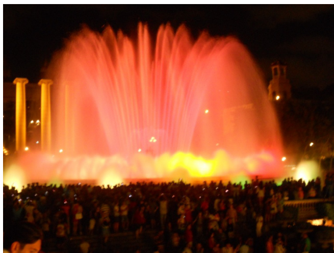
Fontana magica vicino Placa de l'Espanya

Usciti da casa Batillò continuiamo con il genio di Gaudí, e vogliamo andare al Parc Guell , famoso parco di Gaudí appena in collina alle spalle della città, ma i ragazzi sono stanchi, e vogliono tornare in Camper. Forse è meglio così, abbiamo modo di riposarci un po' anche perché in serata abbiamo intenzione di andare a vedere la fontana magica . Alle 17,30 siamo al camper, ci riposiamo, ceniamo, e poi alle 20,30 si riparte con la metropolitana e scendiamo a Placa de l'Espanya . Poche centinaia di metri e siamo di fronte alla fontana magica ( Fuente Magica in spagnolo).