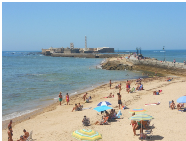
Castillo de San Sebastian

Usciti dalla cattedrale con le biciclette ci facciamo il giro dei bastioni , e arriviamo fino al Castillo de San Sebastian , che poi non è altro che una piccola fortezza protesa sul mare, punto più a Ovest della cittadina. C'è molta gente in giro, soprattutto al mare a farsi il bagno. Fa molto caldo, ma c'è vento. Decidiamo di fare pranzo sedendoci in una panchina ombreggiata con vista sul mare. Rifocillati e ripostati concludiamo il giro dei bastioni con le biciclette, e alle 15,00 ritorniamo al porto. Il nostro programma è di