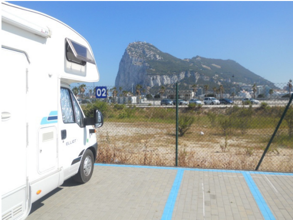
La rocca di Gibilterra dall'area sosta camper

paesaggio veramente affascinante, ma dobbiamo sorbarcarci 40 Km di curve e un solo distributore di carburante.