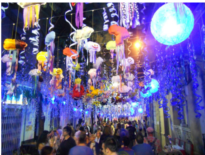
Festa Major de Gràcia

Gràcia" , che si svolge a metà di agosto. Le strade del quartiere vengono ornate con spettacolari decorazioni preparate dai cittadini durante vari mesi, per poter vincere il premio di strada meglio decorata. Le feste di Gracia, sono famose in tutta la Catalogna, e attraggono i cittadini di tutta Barcellona. Giriamo tutto il pomeriggio per le stradine e le piazzette di questo quartiere con i