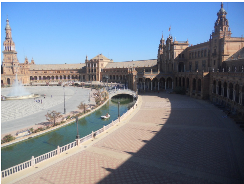
Plaza de Espana - Siviglia

bicicletta. Usciamo dall'area di sosta e ci dirigiamo verso il parco Maria Luisa , il più grande parco di Siviglia.