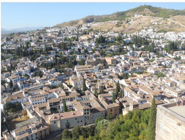
Granada vista dall' Alhambra

Visitiamo tutto con attenzione, anche perché nel prezzo del biglietto erano comprese le audio guide. Usciamo alle 20,00, il sole è ancora alto, giriamo per le strade di Granada. Davanti al palazzo della Real Chancilleria de Granada troviamo un gruppo di donne che ballano il Flamenco. Ci fermiamo ad ascoltare e a mimare dei passi anche noi. Tutto bellissimo. Ritorniamo con le biciclette al campeggio, ceniamo, e per mezzanotte ci addormentiamo con una temperatura di circa 24°.