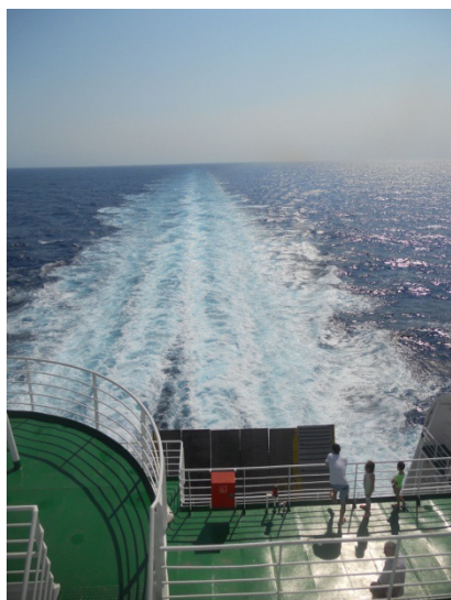
In viaggio sulla nave

L'autoparlante ci sveglia alle 6.00, e avvisa che siamo in prossimità dello sbarco di Porto Torres. Rimaniamo a letto a poltrire, mentre sentiamo che la nave riparte dal porto. Alle 8,00 ci alziamo e