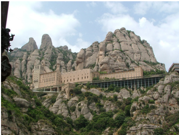
Monastero di Monserrat

Sulla montagna si trova il monastero benedettino Santa Maria del Montserrat dedicata alla