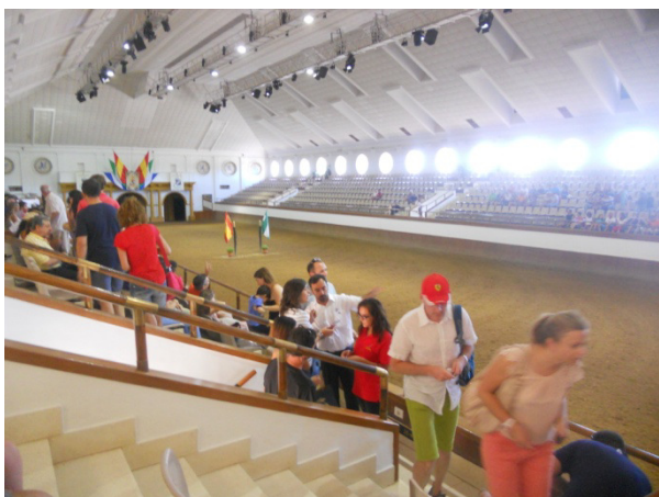
Real Escuela Andaluza de arte Equestre

Infatti abbiamo prenotato dall'Italia una visita alla Real Escuela Andaluza de arte Equestre , la più antica scuola di arte equestre di tutta la Spagna. Alle 10,30 usciamo dal campeggio Las Dunas, e alle 11,00 arriviamo al parcheggio della scuola.