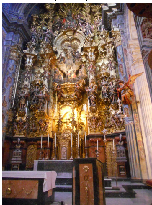
Iglesia del Salvador - Siviglia

Quando usciamo sono ormai le 14,00, abbiamo fame ma vogliamo mangiare qualcosa di veloce perché dobbiamo partire per Siviglia. Troviamo una rosticceria dove per 10,00 euro compriamo un pollo arrosto, una montagna di patatine fritte, e una bottiglia di Coca cola. Bene, il pranzo è servito. Partiamo per Siviglia alle 15,30, ed arriviamo all' areas autocaravana de sevilla, ( avenida