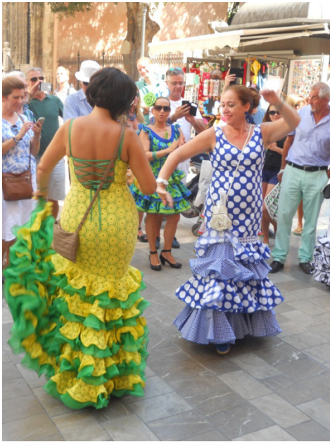
Donne Andaluse ballano il Flamenco

alle 15,00 prendiamo la metro e scendiamo alla stazione centrale dei treni, e dopo un piccolo tratto a piedi, arriviamo al centro della città, a Plaza de la Marina dove si stà svolgendo la Feria. Passeggiamo sull'enorme via pedonale Calle Marquez de Larios strapiena di gente, dove vi sono molti artisti di strada, palchi dove i ballerini intrattengono i turisti con passi di Flamenco, molte famiglie con le donne vestite con caratteristici vestiti da Gitanas andalusa molto affascinanti. Proseguiamo la nostra passeggiata attraverso Plaza del la Costitution, Plaza Carbòn, Calle Granada , fino ad arrivare a Plaza de la Merced . Da qui ritorniamo verso il lungomare, ma passiamo prima dalla cattedrale (che vediamo solo da fuori) e poi la Plaza de Toros , affollata di gente perché stà per iniziare una corrida. Per scrupolo chiediamo quanto costano i biglietti, e ci rispondono che sono rimasti solo posti al sole (quelli all'ombra sono i primi che vengono venduti), chiedendoci 60 Euro a persona.