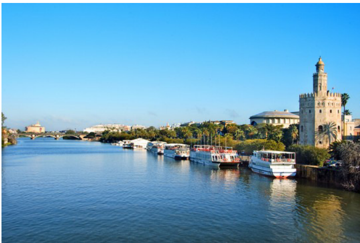
Torre dell'oro vista da puente de San Telmo

Sveglia di buon'ora alle 8,00. Fatta colazione, e preparato il pranzo al sacco, alle 10,00 inforchiamo le biciclette, ed andiamo a visitare il quartiere Triana , sulla riva occidentale del fiume Guadalquivir dove si uniscono la Siviglia antica e la moderna.