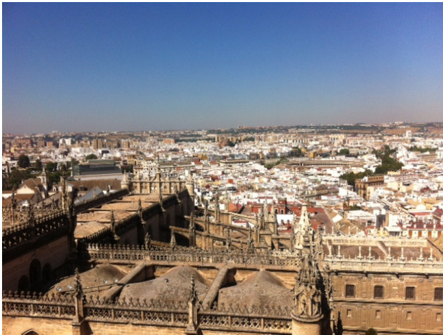
Vista di Siviglia dalla Torre della Giralda

vedute che si spalancano sotto i nostri occhi, la veduta sul Patio degli Aranci, le gargolle e i pinnacoli della Cattedrale e sull'Alcázar. Una volta in cima, il meraviglioso panorama sulla città e sull'orizzonte cancella ogni nostra fatica.