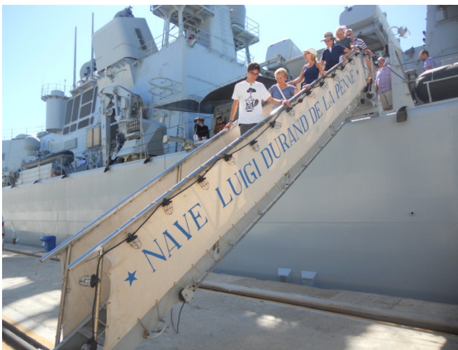
Cacciatorpediniere Durand De la Penne

Sveglia con calma alle 8,30. Fuori vediamo che il parcheggio dove siamo si è riempito di auto,