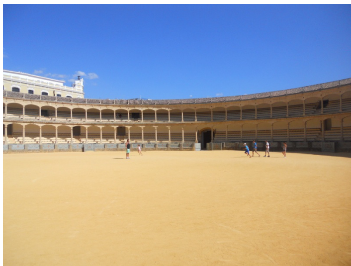
Plaza de Toros de Ronda

Ci vengono in aiuto una coppia di camperisti spagnoli vicino a noi. Chiediamo info sulla strada, e anche loro ci confermano quello che pensiamo. Ci consigliano invece di andare verso l'entroterra a visitare Ronda che dicono molto bella e interessante. Consulto con la guida del Touring Club, e veniamo a sapere che La città è anche nota per avere la più antica Plaza de toros di Spagna per