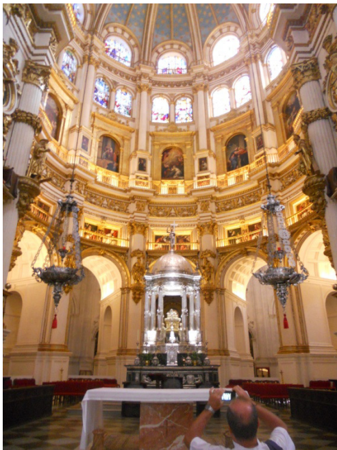
Sagrario Cattedrale di Granada

Ci svegliamo abbastanza presto, e dopo una bella doccia e toelettatura, nonché la preparazione