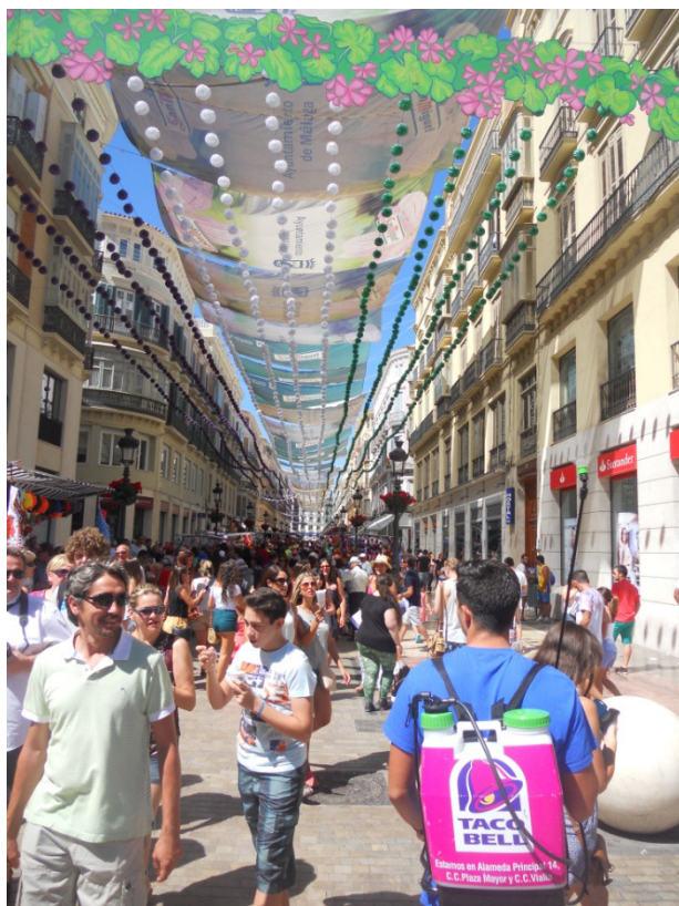
Feria di Malaga

Questa mattina ci alziamo tardi, ci piace poltrire a letto complice anche il silenzio assoluto che