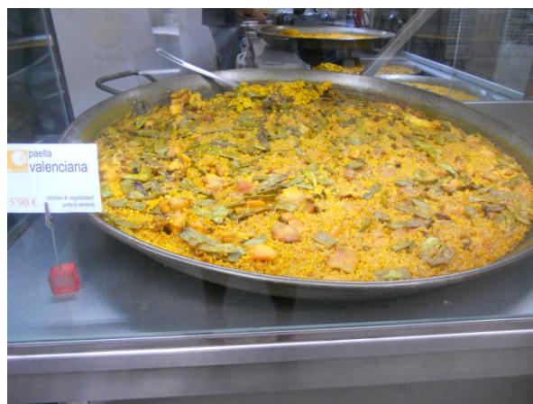
La famosa Paella Valenciana

Terminiamo la visita alla cattedrale, e facciamo per le strade di Valencia. Visitiamo Plaza de la Reina , e Plaza de la Verge , arriviamo al centro archeologico “ De la Almoina ” posto proprio dietro la cattedrale. Un grande museo che ospita i resti archeologici romani rinvenuti durante degli scavi effettuati tra gli anni 1985 e 2005. Usciti dal museo ci fermiamo in una piazzetta per il pranzo al sacco, e subito dopo andiamo la porto a vedere quello che rimane dei capannoni che furono costruiti per