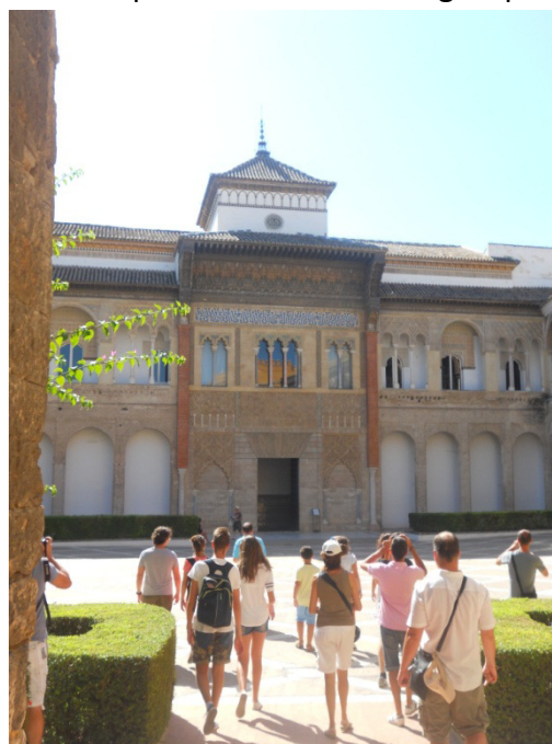
Alcazar - Siviglia

Plaza de Espana , infatti, si trova praticamente all'interno del parco ed è uno degli spazi architettonici all'aperto tra i più suggestivi e spettacolari della città andalusa e della Spagna in generale. Anche lei fu costruita per l'Esposizione Iberoamericana che si tenne a Siviglia nel 1929. La piazza ha una superficie totale di 50 mila metri quadrati, attraversati per 515 metri di canale che la solca longitudinalmente. Più della metà dello spazio occupato dalla piazza è all'aperto mentre il resto è composta da edifici e porticati. La piazza ha una forma semicircolare di duecento metri di diametro. Mattoni a vista in marmo e ceramica con decorazioni variopinte, e le linee della struttura, danno un tocco sia rinascimentale che barocco al luogo. Al centro della piazza si trova una grande fontana. La forma e la composizione di questo luogo richiama simbologie diverse: la forma semicircolare rappresenta l'abbraccio della Spagna alle sue ex colonie; Il canale, attraversato da quattro ponti, ognuno di questi rappresenta uno degli antichi regni di Spagna; ognuna delle panche e degli ornamenti in ceramica situate presso le pareti simboleggiano una delle quarantotto provincie spagnole; mappe, mosaici di eventi storici e stemmi delle provincie completano questo luogo emblematico della nazione.