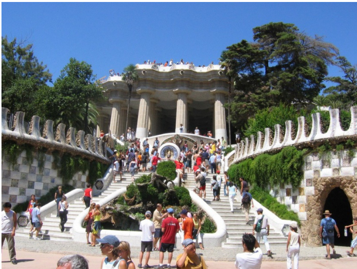
Parc Güell - Barcellona