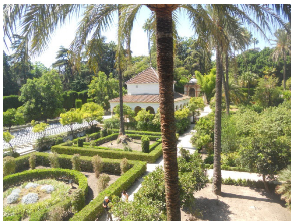
Alcazar – Giardini inglesi

é stato scelto in passato come residenza da molte generazioni di monarchi. É qui che dimora il re Don Juan Carlos quando viene in visita a Siviglia. Le numerose stanze patii e saloni combinano gli stili piú svariati con molte influenze architettoniche che vanno dall'islamico al neoclassico. La bellezza delle sue fontane e dei suoi giardini é un altro degli elementi di grande interesse. Con la compagnia della guida, visitiamo Il Salone degli Ambasciatori, Il Patio della Caccia, Il Patio delle Donzelle, I Saloni di Carlo VI, Il Patio delle Bambole, e Il Patio di Gesso . Terminata la visita dei saloni dell' Alcàzar, la guida si porta verso I giardini della struttura. Questi giardini, formati da terrazze con fontane e padiglioni, costituiscono un delizioso rifugio dal caos e dalla calura sivigliana. Visitiamo nell'ordine: Il Giardino dei Poeti, Il Giardini di Vega Inclin, Il Giardino del Serbatoio, e per finire I Giardini Inglesi .