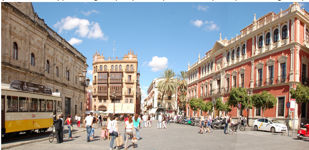
Plaza San Francisco

Rammaricati dell'inconveniente decidiamo di farci una passeggiata per il centro, dove un po' affamati ci fermiamo in uno dei tanti Tapas-Bar dove mangiamo delle Tapas (stuzzichini/aperitivo) di cui è famosa la città di Siviglia. Veniamo a conoscere che le Tapas nella realtà sono originarie della zona di Cadice, dove all'epoca della scoperta dell'America la città era al centro dei traffici con le nuove Indie. Nei bar di Cadice pieni di avventori e marinai, per non far entrare mosche e zanzare nei bicchieri colmi di liquori, vi era l'usanza di porre dei piattini che ricoprivano la parte superiore del bicchiere. I piattini originalmente erano vuoti, ma poi furono riempiti di stuzzichini. Da qui il nome Tapas , ovvero Tappo. In seguito poi questo tipo di usanza prese piede a Siviglia, e poi