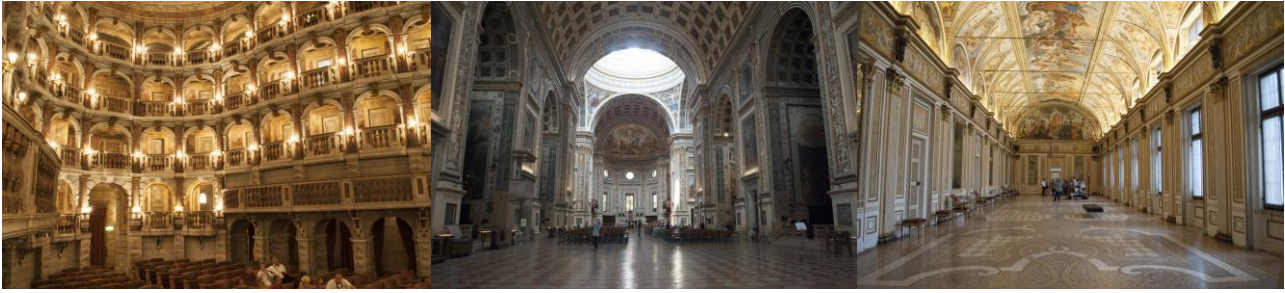
Il teatro Bibiena