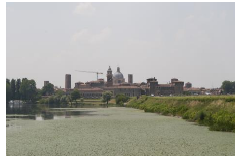
Panorama di Mantova

Siamo fortunate e troviamo una piazzola libera nella zona più ombreggiata.