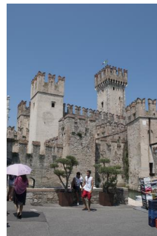
La Rocca Scaligera Sirmione

Partiamo venerdì mattina inoltrato, la tangenziale nord di Milano è intasata e ci mettiamo una bell'oretta per districarci. Giungiamo a Sirmione al parcheggio Monte Baldo verso le 13. Ci sono diversi posti liberi e noi ne scegliamo uno fronte lago. Fa un caldo pazzesco, pensare di partire subito con le visite ci sembra impossibile, si suda senza fare nulla. Ci rintaniamo in un bar/gelateria che ha una corte interna con tavolini e ventilatori. Pranziamo con calma.