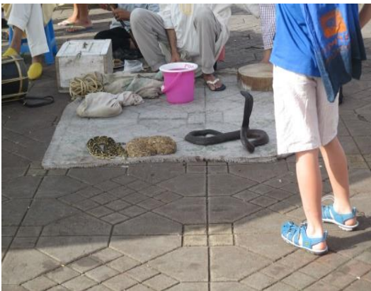
Piazza DJEMAA EL FNA a MARRAKESCH