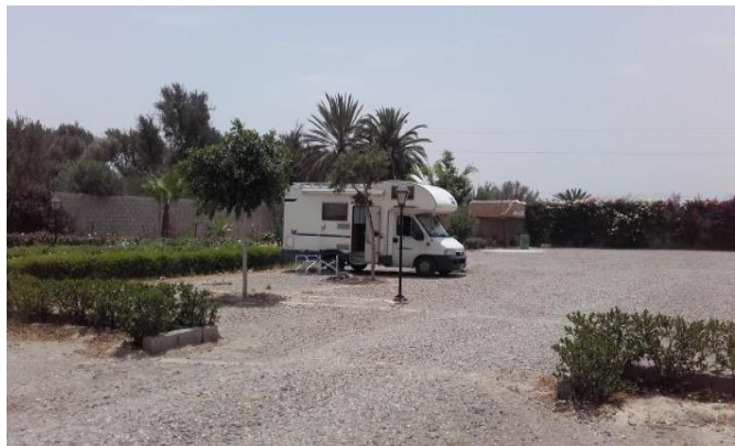
campeggio di TAROUDANT