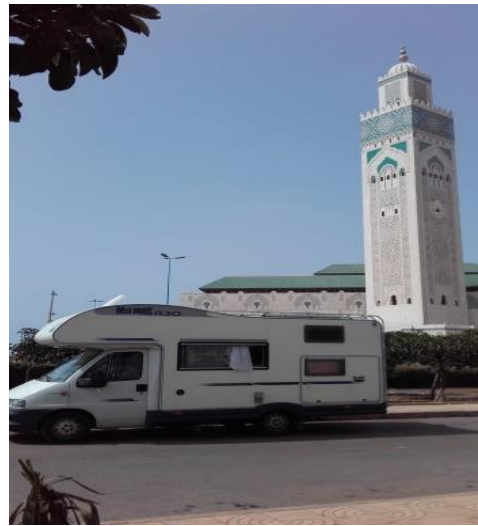
Moschea HASSAN II°