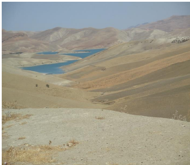
i monti del RIF