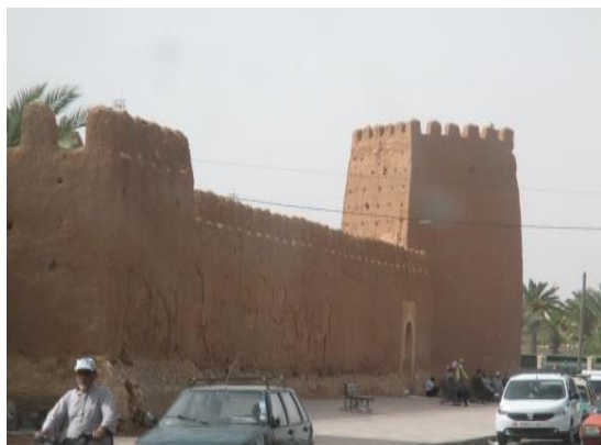
La cinta muraria di TAROUDANT