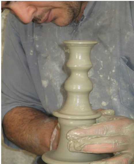
Artigiano a FES