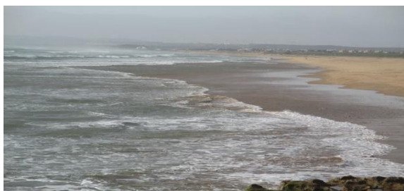
La spiaggia a SIDI KAOUKI