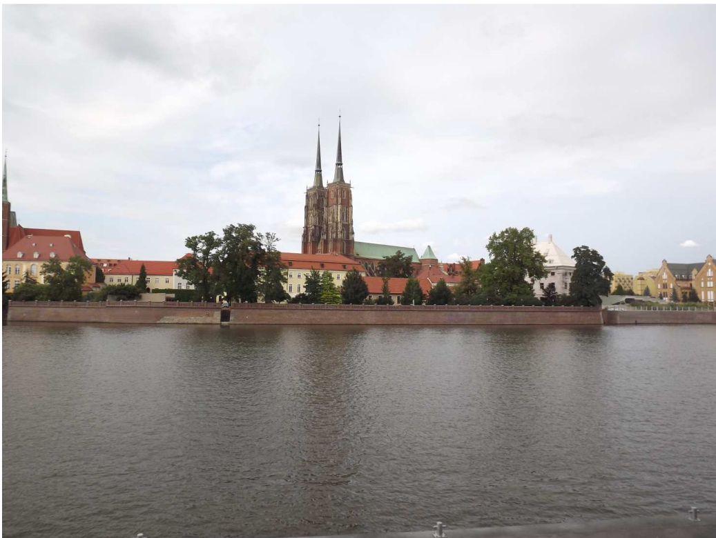
Wroclaw la città degli gnomi

Riguardo i cani sono accettati in quasi tutti i campeggi senza alcun sovrapprezzo ma per il resto non possono entrare in nessun posto, ne monumenti, ne giardini e nemmeno nei grandi magazzini dove solitamente in altre nazioni si possono condurre. Per i ristoranti potrete portarlo solo se utilizzate un tavolo all'aperto.