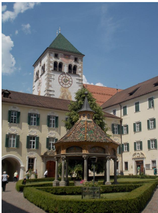
Abbazia di Novacella

Dopo mezz'oretta siamo arrivati e non avendo trovato le aree sosta camper e i parcheggi indicati da Camper on line abbiamo proseguito ancora un chilometro dopo il Castello di Tures e abbiamo parcheggiato nel grosso piazzale davanti agli impianti di risalita di Speikboden. Parcheggio tranquillo accanto al torrente Aurina...la notte è stata silenziosa, freddolina e con pioggia.