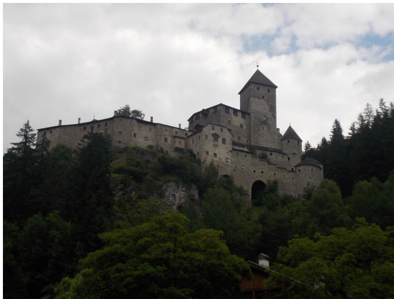
Castello di Tures