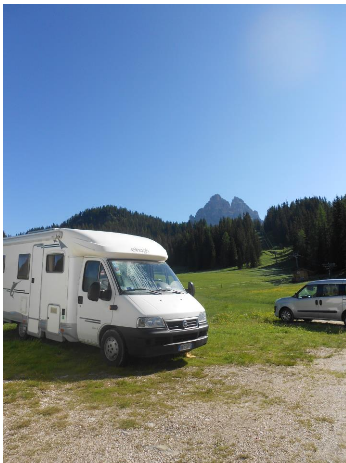
Area sosta camper al lago di Misurina e Tre Cimi di Lavaredo sullo sfondo

Abbiamo cenato vicino a Brescia in un parcheggio dell'autostrada dove faceva tantissimo caldo e alle 22.45 arrivavamo a destinazione.