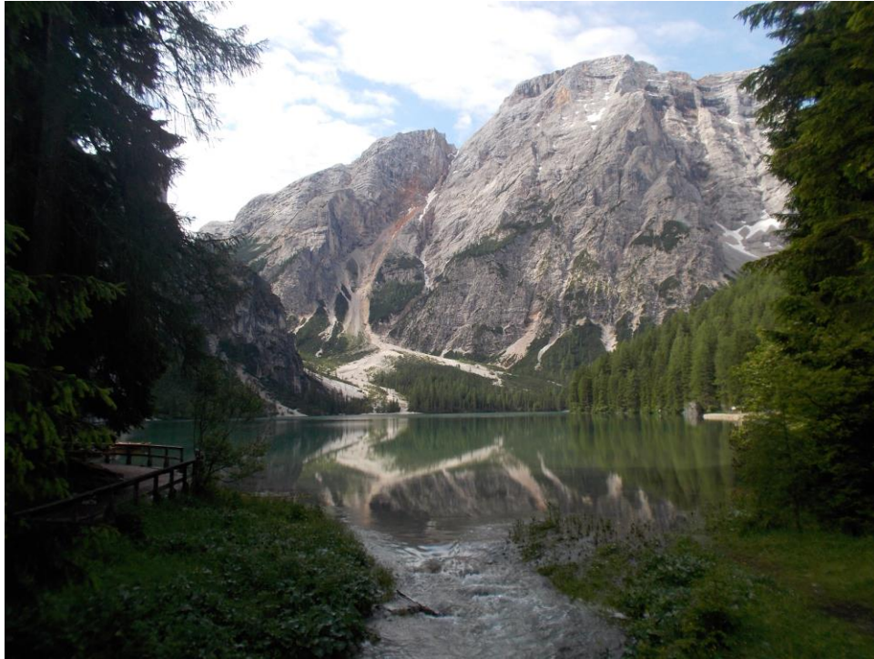
Lago di Braies