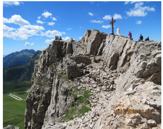
Il Cristo pensatore