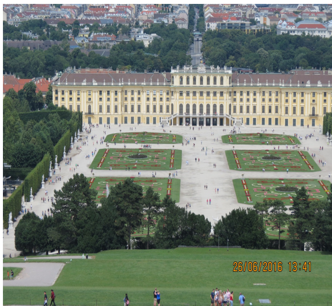
il castello di Sissi