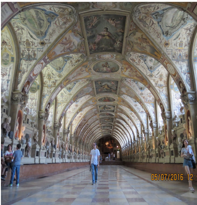
La Residenza (Monaco)

07/07 Scendiamo in città, saliamo a piedi al castello, bella la sala d' oro poi scendiamo nuovamente in città passando dal bel cimitero. Altra visita in città