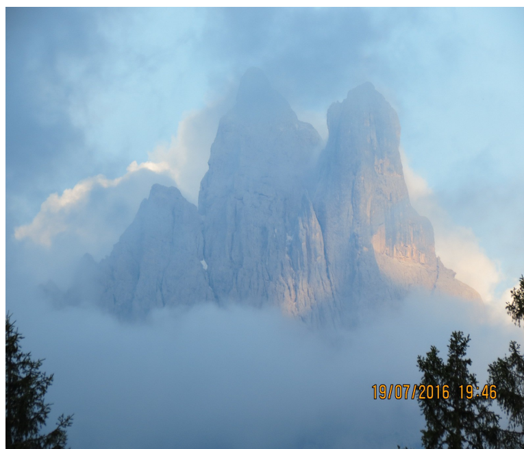
Le Pale di San Martino di Castrozza