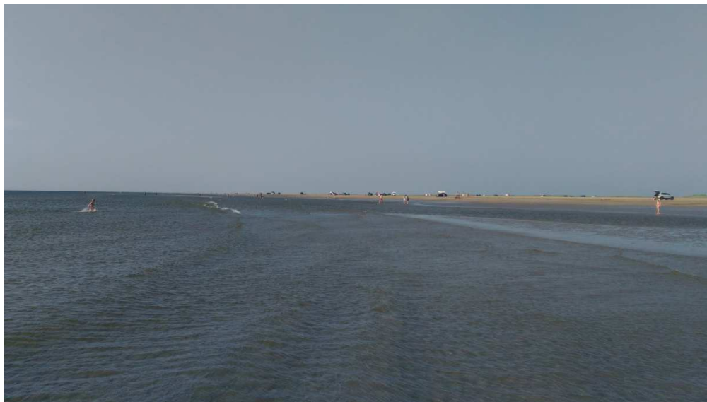
Isola di Romo

Alle ore 20:00 arriviamo a Ribe. Sapevamo che il bel parcheggio riservato ai camper fosse piccolo (forse una ventina di posti) ma lo abbiamo trovato pieno. Abbiamo parcheggiato proprio di fronte a questo su un'area non asfaltata dove erano parcheggiati un paio di camion. Tutto molto tranquillo. C'è da ricordare che qua fa buio davvero tardi (alle 22:30 ancora è giorno). Dopo cena ricca dormita, pronti per domani.