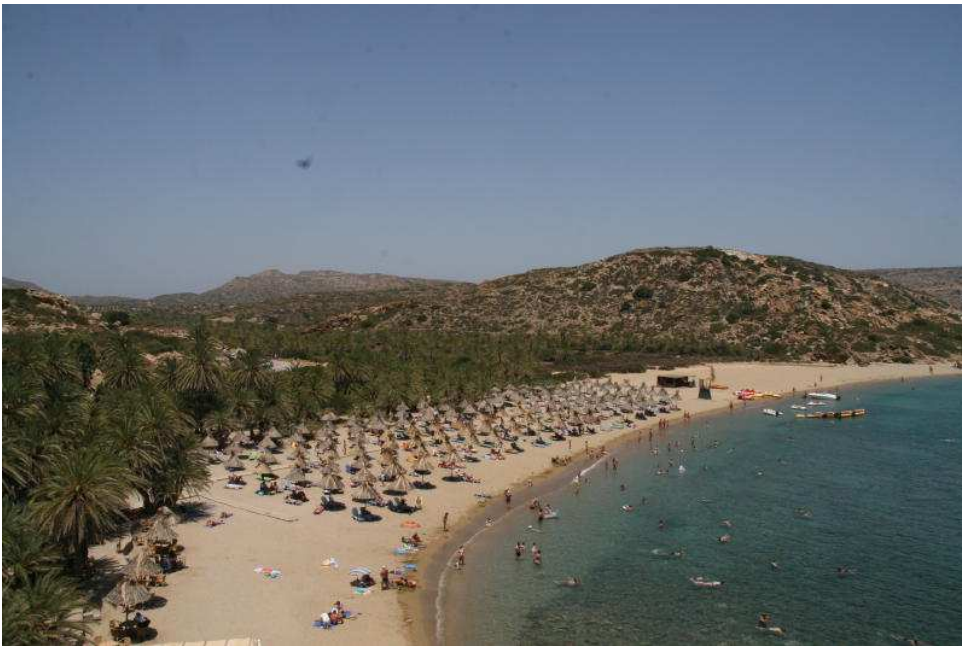
Spiaggia di Vai – Creta

Ripartiamo e passiamo per la spiaggia di Vai molto caratteristica con le sue palme ma molto affollato. Ci fermiamo giusto per fare qualche foto, il punto ideale per fotografare è andare all'estremo della spiaggia ed arrampicarsi per un sentiero, dalla vetta si vede un gran bel paesaggio.