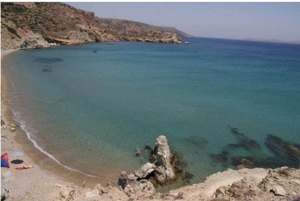
Spiaggia di Itanos – Creta

Dopo qualche foto ci dirigiamo verso Itanos.