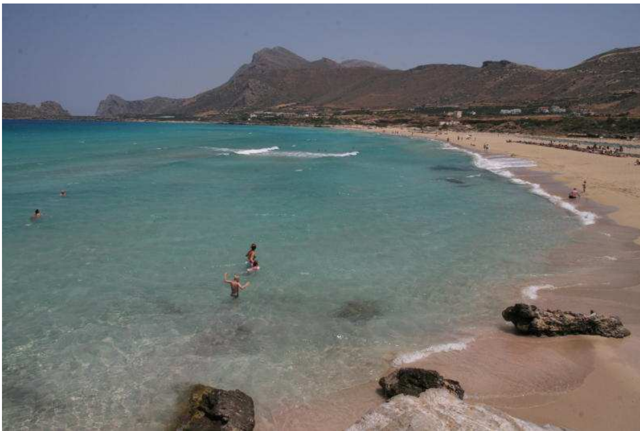
Spiaggia di Falassarna – Creta

Dopo la spesa ci dirigiamo verso Falassarna.