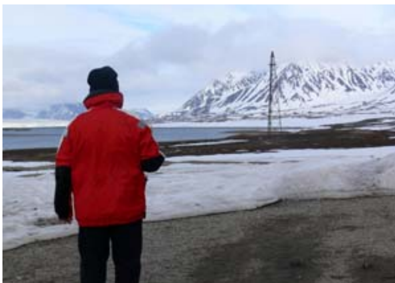
Ny Alesund - il pilone

Il giorno dopo c'è il sole e sbarchiamo in un fiordo per vedere una vecchia capanna di cacciatori. E' impressionante che questi coraggiosi passassero l'inverno in