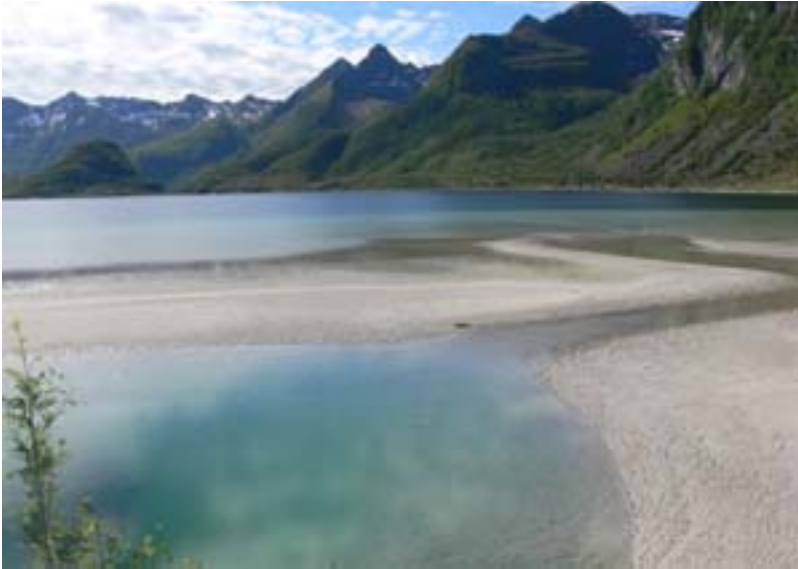
Spiaggia a Andoya

Continuiamo la nostra discesa verso sud lungo la costa occidentale di Andoya. E' una costa a volte sabbiosa (eccellenti spiagge bianche) ed a volte alta, molto solitaria, dove troviamo pochi piccoli centri di pescatori e cominciamo a vedere le prime rastrelliere di legno con i merluzzi a seccare.