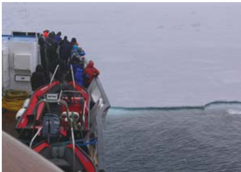
La banchisa polare

Cominciamo a trovare i primi lastroni di ghiaccio, sempre più grandi con l'aumentare della latitudine. Siamo vicini alla calotta polare, il cielo è coperto e tira una bella aria da nord, ma non fa