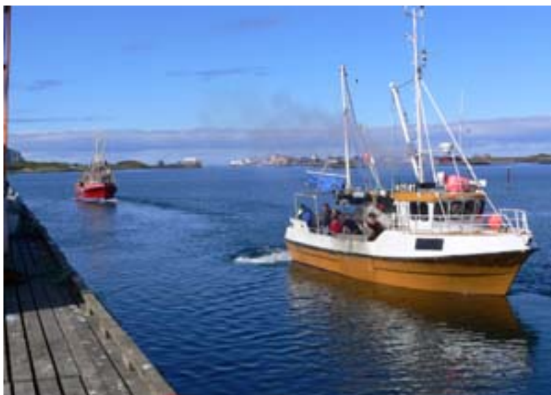
Porto canale a Rost

Il giorno dopo gironzoliamo con lo scooter per l'isola principale, che ospita la maggior parte degli abitanti (circa 600). Ci sono sterminati graticci per