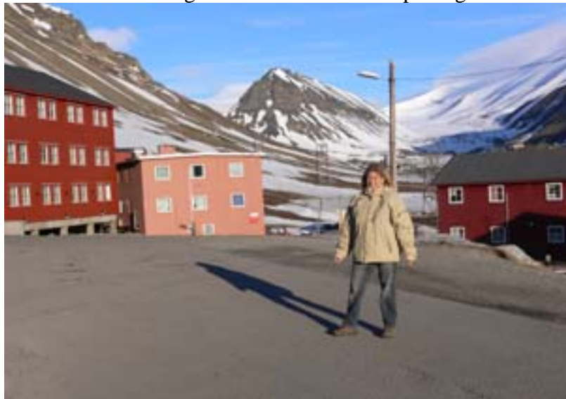
Longyearbyen all'una di notte