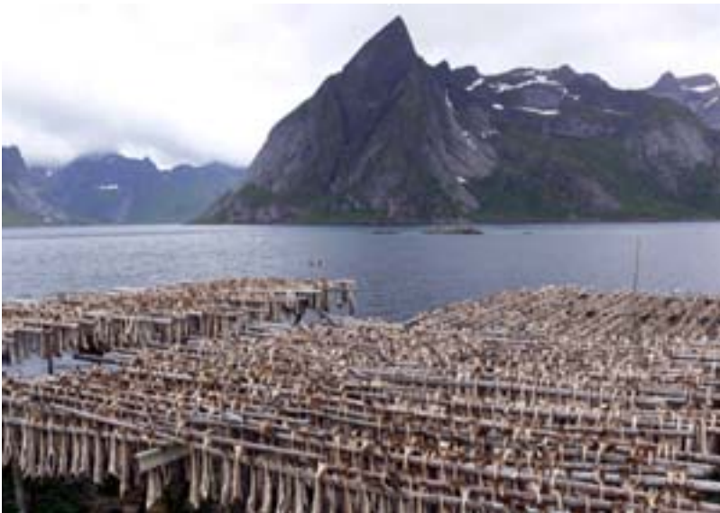
Stoccafissi a Hamnoy

Reine è definito il posto più bello della Norvegia e c'è poco da dire, salvo ripetersi: un insieme fantastico di paesi, laghi, mare e naturalmente montagne e neve.