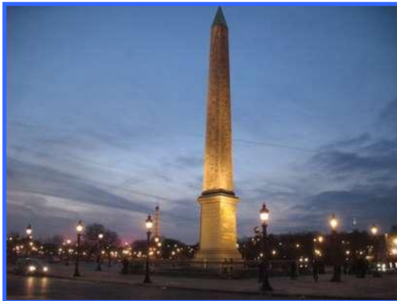
Place de la Concorde

Abbiamo percorso i bellissimi giardini che da un parte conducono al Trocaderò e dall'altra all' Ecole Militaire Ci siamo poi spostati in Place de la Concorde , stupenda ed immensa, da cui partono i famosi Champs Elysees ; sull'altro lato della piazza si trova il famoso Jardin des Tuileries che sfocia nello spettacolare impianto del Louvre .