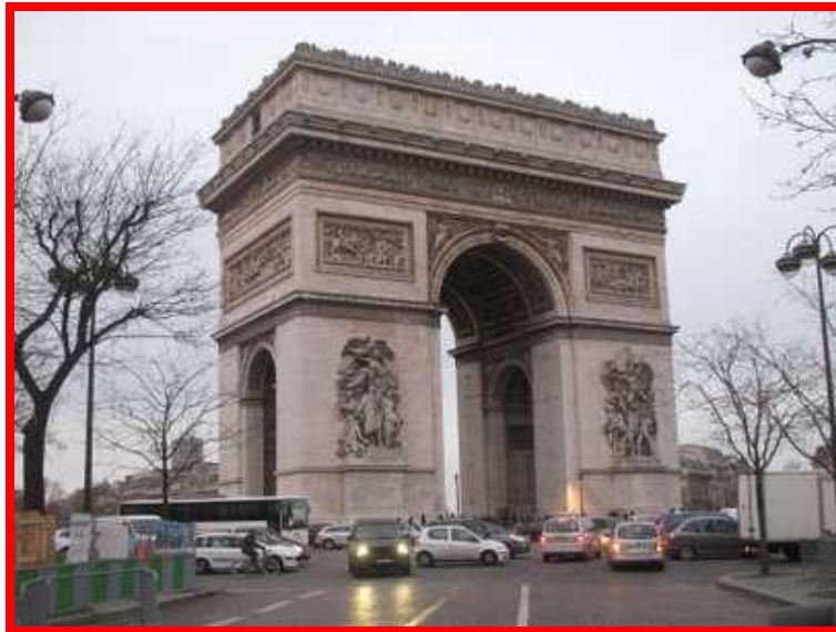
Arc de Triomphe

Siamo esausti ma veramente soddisfatti e ci incamminiamo sulla strada del ritorno programmando già la giornata di domani che ci riserverà tante altre cose stupende da vedere