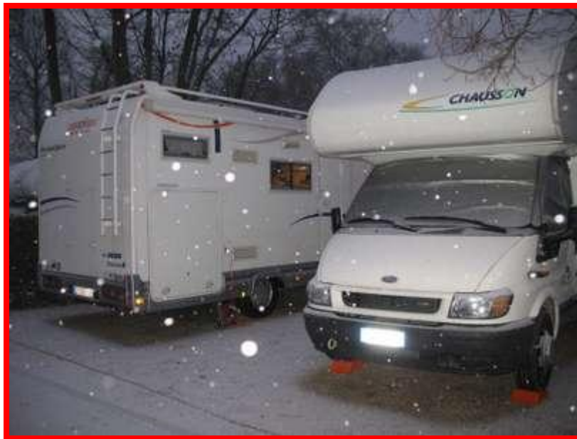
Risveglio con la neve

Venerdì 2 Gennaio ci svegliamo entusiasti, il nostro primo obiettivo è la Tour Eiffel : Purtroppo quando ci alziamo e apriamo gli oscuranti ci aspetta una sorpresa: la neve!! Siamo andati a dormire ieri sera con il cielo stellato e mai avremmo pensato ad un risveglio così. Siamo stati comunque fortunati perché nel giro di due ore è tornato il sole e la nostra prima giornata dedicata alla visita della città non è stata in alcun modo condizionata.