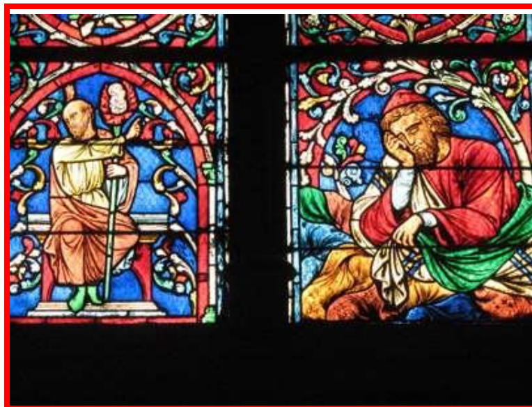
Interno Notre Dame

La Chiesa è sicuramente molto bella, personalmente ho apprezzato in particolar modo le sue vetrate colorate, che, quando illuminate dal sole, assumono dei colori veramente eccezionali.