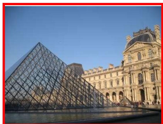
Il Louvre dall'esterno