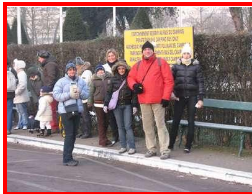
Il gruppo in attesa della navetta

Anche oggi è stata una giornata molto faticosa ma molto soddisfacente e non vediamo l'ora di poter fare una doccia calda. Unico neo una mia dimenticanza: ho pensato bene di lasciare un oblò aperto tutto il giorno e, nonostante il riscaldamento, la temperatura al nostro rientro non era delle più accoglienti!!! Domenica 4 Gennaio prendiamo nuovamente la navetta alle 9.30 e ci dirigiamo subito nel quartiere di Montmartre per la visita del Sacre Coeur