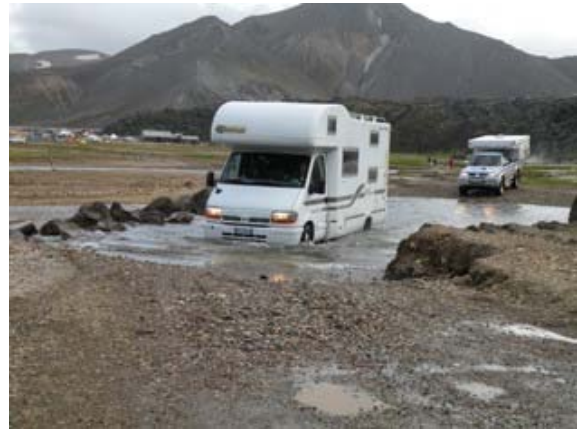
Guado a Landmannalaugar