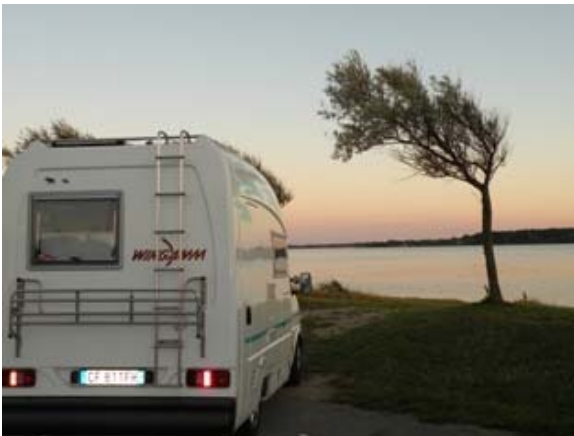
Sosta a Faro

Ci sistemiamo vicino al mare lungo il fiordo, il più lontano possibile dal ponte per evitare il rumore del traffico. Incuriositi osserviamo due ragazzi autostoppisti vestiti di nero col cappello a cilindro che fanno il bagno. Dopo essersi asciugati e rivestiti, con grande eleganza imbandiscono una romantica cena in un tramonto da favola, utilizzando i tavoli e le panchine da pic-nic del luogo.. Terminata la cena mettono tutto in ordine e si sdraiano sulle panchine a dormire. (Questo sì che è un albergo a 1000 stelle! E' bello il turismo itinerante; ti permette di conoscere personaggi al di fuori degli schemi precostituiti , gente libera dotata di una spiccata personalità, che vive la sua vita senza subire i condizionamenti della nostra società). La serata è dolce, prendiamo le sedie e ci sediamo in riva al mare a goderci il tramonto, una ragazza siede sulla riva a leggere un libro, passa uno stormo di fenicotteri rosa, il mare si indora sotto i raggi del sole che lentamente cala, così è bello viaggiare.