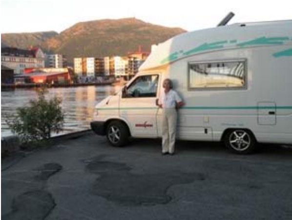
Bobil Senter a Bergen