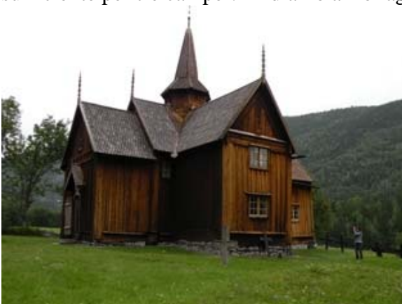
La Stavkirche di Uvdal

Sostiamo a Uvdal dove c'è una bellissima chiesa di legno (aperta per una comitiva di russi, approfittiamo anche noi per visitarla). Pensiamo di sostare qui per la notte ma non c'è spazio sufficiente per tre camper. Andiamo a Rollag dove siamo sicuri di trovare spazio.