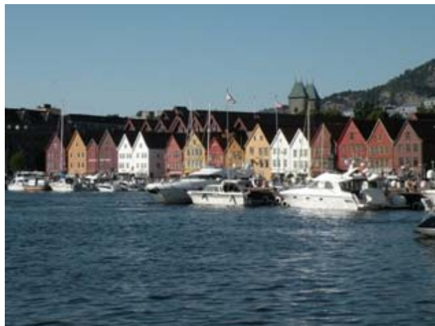
Case Anseatiche a Bergen

Domenica 27-07-08 Sosta a Bergen (Camping Lone )