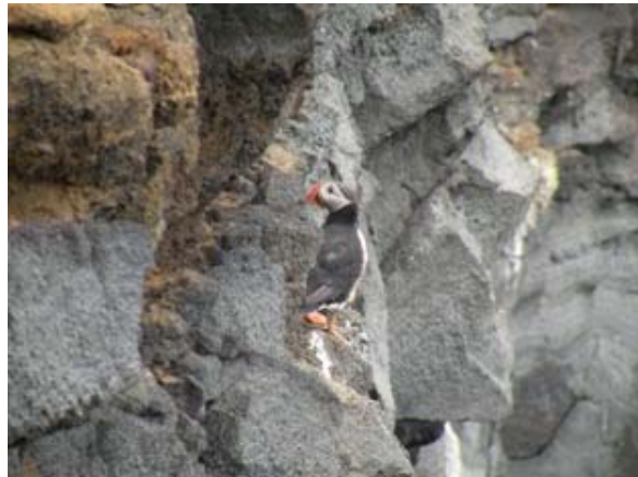
Pulcinella di mare