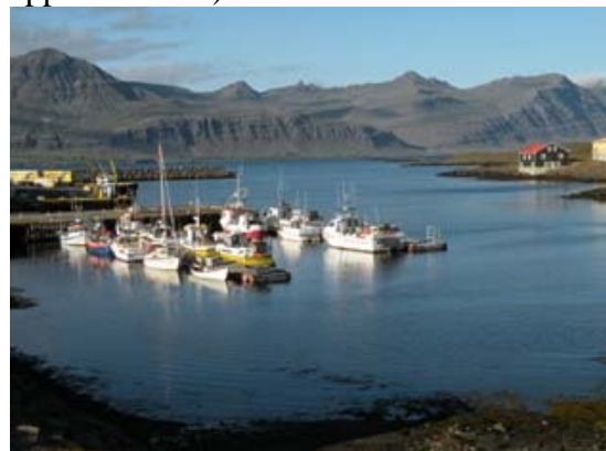
Il villaggio di Djupivogur