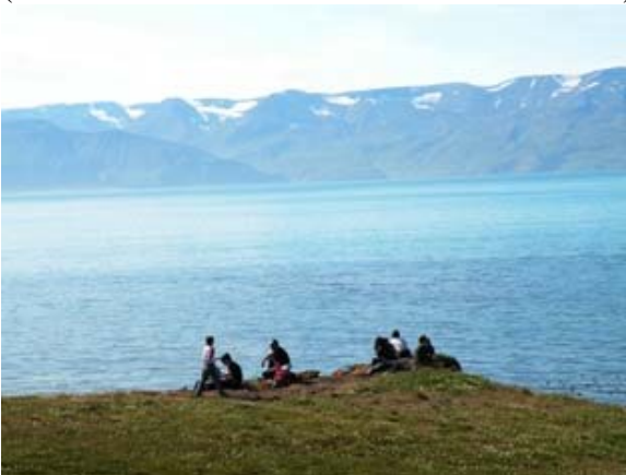
Il fiordo a Husavik

Ci svegliamo immersi nella nebbia, aspettiamo che aprano l'emporio per comprare i viveri, poi percorriamo per una ventina di km. la strada costiera alla ricerca di un punto strategico da cui fotografare i "puffin" (Pulcinella di mare). Delusi per non averli incontrati, ci sistemiamo in un promontorio a goderci il sole che nel frattempo ha fatto sparire la nebbia. Il fiordo è bellissimo, con un mare color smeraldo incastonato tra montagne tempestate di nevai. Siamo ammirati di fronte all'abbondanza di uccelli marini di varia specie. Al ritorno, risalendo il sentiero, una sterna ci insegue con delle picchiate aggressive, da paura, involontariamente siamo passati vicino al suo nido (brividi alla Hitchcock del film "Gli uccelli"). Pranziamo sui camper.