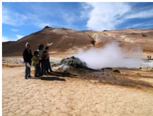
Soffioni a Hverarondvellir

Ripartiamo per fermarci nella zona del lago vulcanico Krafla, molto bello il lago ma la zona adiacente essendo piena di soffioni di vapore è stata utilizzata industrialmente per produrre energia elettrica perdendo un po' del suo fascino.