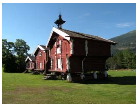
Granai lungo la strada