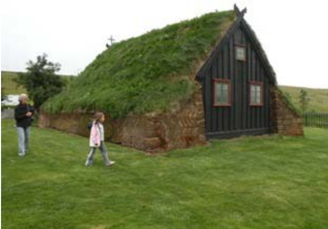
La chiesetta a Varmahlid

Giungiamo a Varmahlid verso sera, nel frattempo è arrivato mio figlio (l'altro equipaggio ha preferito proseguire fino a Blonduos per cimentarsi nella pesca) assieme troviamo una chiesetta antica con un parcheggio e dei servizi (acqua calda compresa, dal sapore di zolfo), ottimo posto per passare la notte. Visitiamo la chiesa rivestita di torba, ceniamo e andiamo a letto.