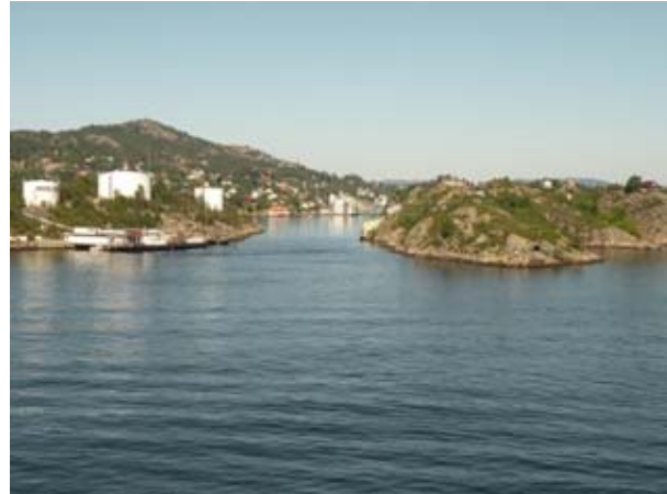
Tra i Fiordi

Martedì 29-07-08 Sosta a Bergen (Bobil Senter ) e Imbarco