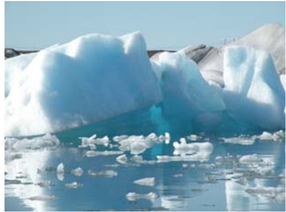
Immagini di Jokulsarion