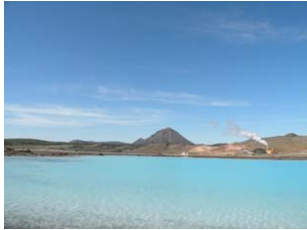
Laguna di acqua calda