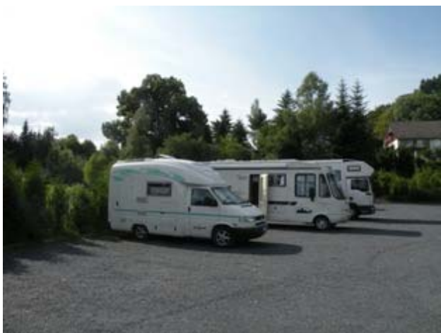
Punto sosta a Rothenburg

Pranziamo, poi passeggiamo per le vie del centro aspettando la sera. Ceniamo e dopo una breve passeggiata andiamo a letto, il posto è molto tranquillo e dormiamo saporitamente.