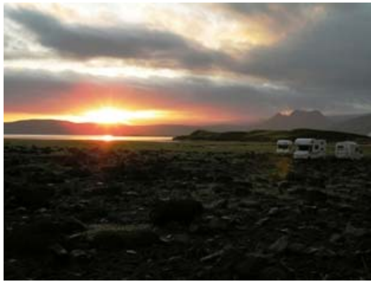
Reynisfiara sosta notte

Lunedì 11-08-08 Reynisfiara – Jokulsarion