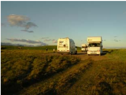
Sosta a Ytri-Tunga

Oggi abbiamo fotografato un chiurlo e parecchie beccacce di mare. Dopo aver pranzato in riva al mare puntiamo verso Ytri-Tunga ma prima di arrivarci visitiamo una grotta dove nidificano tantissimi gabbiani visitiamo anche una piccola chiesetta su un promontorio a picco sul mare. E' già pomeriggio inoltrato quando incontriamo il cartello che ci indica la deviazione per Ytri-Tunga (avevamo letto che in questo luogo c'è una colonia di foche). Ci allontaniamo dalla strada principale, passiamo accanto ad un casolare, percorriamo un sentiero erboso e sostiamo in riva al mare in solitudine e silenzio. Le foche sono sdraiate sugli scogli, nascondendosi tra i cespugli si possono fotografare molto bene. E' un momento molto bello, in questa pace, soddisfatti aspettiamo la sera