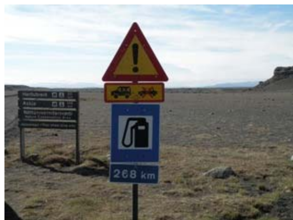
Vicino a Heravellir