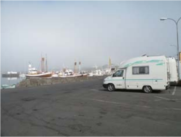
Sosta nel porto di Husavik

Percorriamo strade immerse nella lava fiancheggiate da troll che segnalano i sentieri. Ci stupisce l'assenza di vegetazione, solo alcune piante nane ci appaiono ogni tanto. Siamo felici per questa seconda giornata di sole. Giungiamo a Husavik nel pomeriggio. Parcheggiamo per la notte sulla banchina del porto fronte mare, poi facciamo un giro per la cittadina; scopriamo che possiede un museo delle balene e un museo del fallo! Andiamo a letto ancora con il sole anche se sono passate le undici.