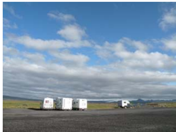
Sosta notte a Gullfoss

Sabato 09-08-08 Gullfoss – Thiodveldisbaerinn