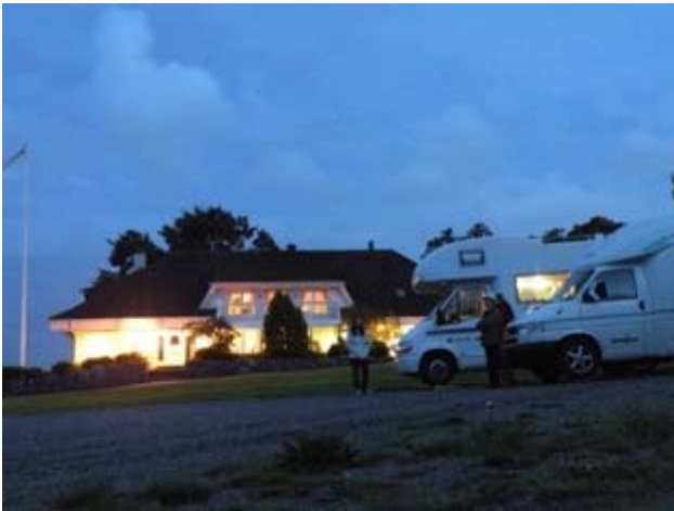
Sosta notte a Kungsbacka

Quando lo ringraziamo ci risponde che lui trascorre le sue vacanze in Toscana e vuole contraccambiare l'ospitalità che ha ricevuto in Italia. Ci accompagna fino al molo, sul fiordo dove parcheggiamo avvisando gli altri proprietari che siamo suoi amici. Passiamo una notte tranquilla .