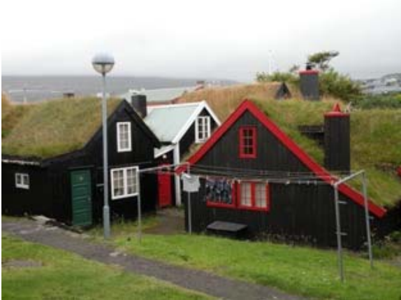
Casa di Thorshavn

Piove 13 gradi, abbiamo dormito bene, il calduccio del camper ci impigrisce; restiamo a letto più del solito. Facciamo il pieno di acqua potabile sul porticciolo di Kvivik. Torniamo a Thorshavn per visitare la città, bellissima la parte antica con le sue casette colorate dal tetto di erba. Sostiamo per il pranzo sul porto, poi visitiamo la Casa Nordica, progettata come centro di ritrovo polifunzionale. Ormai il tempo si è guastato; pioggia e vento. Appena si sale sulle montagne una nebbia fittissima rende difficoltosa la guida. Con un tempo da tregenda giungiamo a Kirkjubourg muniti di ombrello e ben coperti visitiamo le rovine della cattedrale di S. Magno e la casa in legno con arredi d'epoca di Roykostova (recintata con ossa di balena), da ultimo la suggestiva chiesetta in riva al mare. Sosta notte in riva al mare con pioggia e vento.