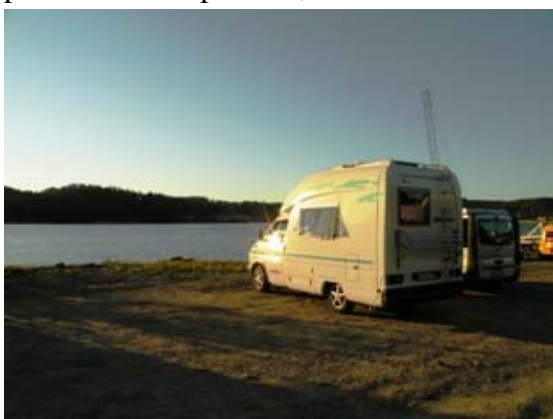
Sosta a Ljusmile

camper stazionano nei pressi. Il posto è bellissimo con una bella passeggiata lungo il fiordo, che percorriamo dopo cena, al tramonto.