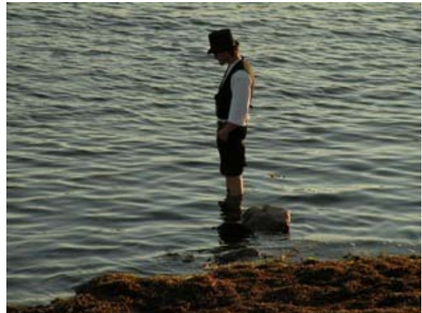
Personaggio a Faro