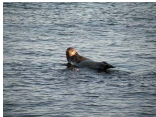
Foche sugli scogli