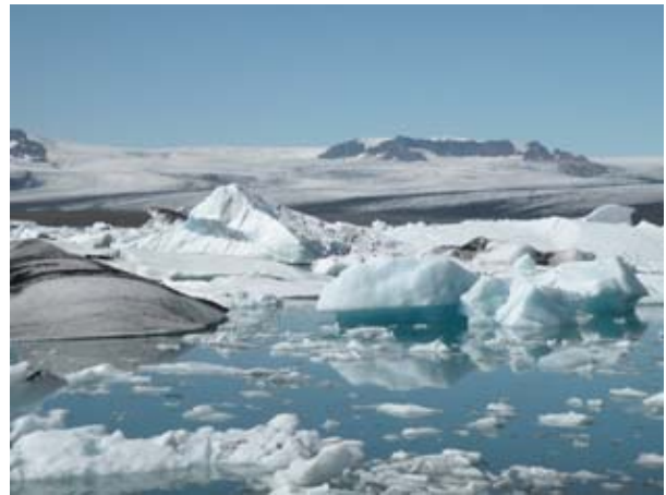
Immagini di Jokulsarion

Riprendendo il viaggio carichiamo una coppia francese con tenda, che fa autostop, facciamo un bel tratto di strada assieme poi li lasciamo nei pressi di un camping. La costa per giungere a Djupivogur è molto bella con vista su un mare blu , ma con tratti imprevisi di sterrato. La giornata è sempre serena (11 gradi) ma con vento. Sostiamo fuori dal paese in un punto panoramico, nel paese è meglio non sostare per la presenza di un camping (è quello in cui abbiamo lasciato la coppia francese).