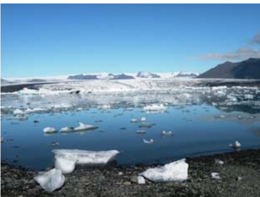
La laguna a Jokulsarion

Riprendendo il viaggio carichiamo una coppia francese con tenda, che fa autostop, facciamo un bel tratto di strada assieme poi li lasciamo nei pressi di un camping. La costa per giungere a Djupivogur è molto bella con vista su un mare blu , ma con tratti imprevisi di sterrato. La giornata è sempre serena (11 gradi) ma con vento. Sostiamo fuori dal paese in un punto panoramico, nel paese è meglio non sostare per la presenza di un camping (è quello in cui abbiamo lasciato la coppia francese).