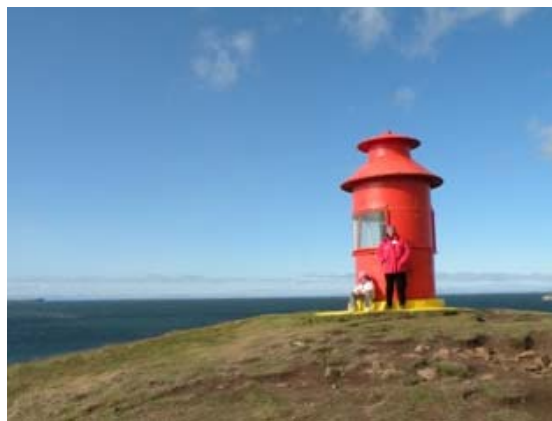
Il faro a Stykkisholmur