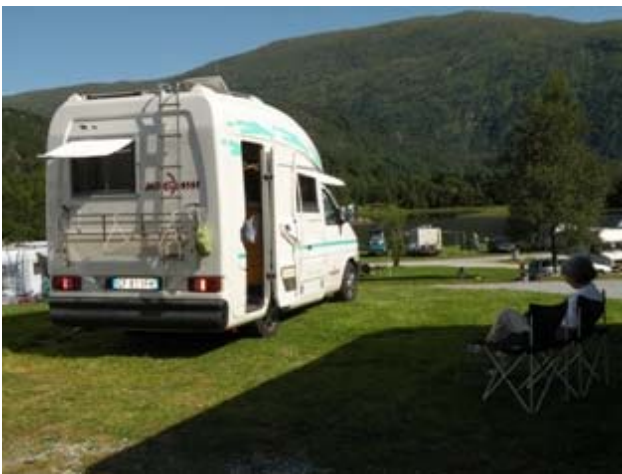
Sosta al Camping Lona

Verso le tre del pomeriggio prendiamo il traghetto appena dopo Eidfjord. Passiamo Granvin poi giungiamo a Bergen. L'arrivo a Bergen non è dei più felici; sbagliamo strada e, dopo aver percorso un lungo tunnel ci troviamo sul porto, anziché al Camping Lone (si pronuncia Luna). Chiediamo informazioni (è sabato incontriamo solo extracomunitari che non conoscono la città) e, dopo aver girato a vuoto per un po', riusciamo ad avere l'indirizzo del camping che inseriamo sul navigatore e finalmente arriviamo alla meta. Ci sistemiamo sull'erba, di fronte al laghetto come facemmo qualche anno fa, sono quasi le venti, il sole è ancora alto, ceniamo e completiamo la giornata con una passeggiata rilassante. La parte più impegnativa del viaggio di trasferimento è completata. Alle ventidue è ancora giorno, ma noi alziamo gli scuri del camper e andiamo a letto perché siamo stressati.