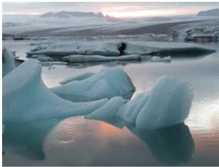
Gli Iceberg di Jokulsarion

Martedì 12-08-08 Jokulsarion – Djupivogur