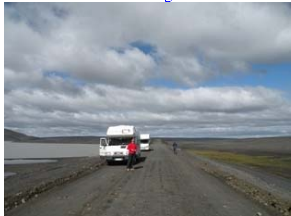
La strada per Landmannalaugar

Domenica 10-08-08 Thiodveldisbaerinn – Reynisfjara