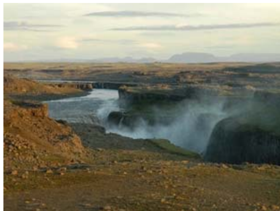
La cascata a Dettifoss