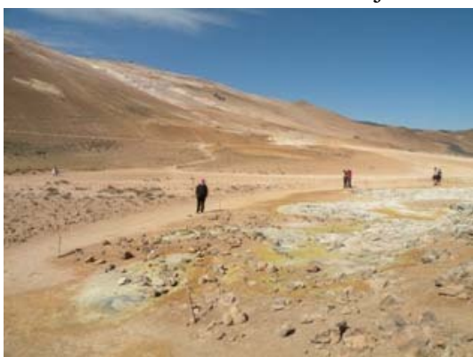
Panorama di Hverarondvellir

Riprendiamo l'asfalto per poi lasciarlo nuovamente per una sterrata che ci porterà ai piedi di un vulcano spento, parcheggiamo i mezzi e a piedi ci inerpiciamo verso la vetta del cono vulcanico. Da quassù si gode un panorama splendido; tutto intorno a noi montagne aride e distese desertiche rese bellissime dal sole. Terminata l'escursione riprendiamo la strada per la zona delle solfatare di Hveravellir. Parcheggiamo nel piazzale e dopo aver pranzato, visitiamo i luoghi dove si verifica questo straordinario spettacolo della natura, dove la terra assume tonalità che vanno dal giallo oro al verde pastello, all'arancione. Fumarole e soffioni ci accompagnano durante tutto il percorso. Sono caratteristici il rumore simile ai jet in decollo e l'acre odore di zolfo.