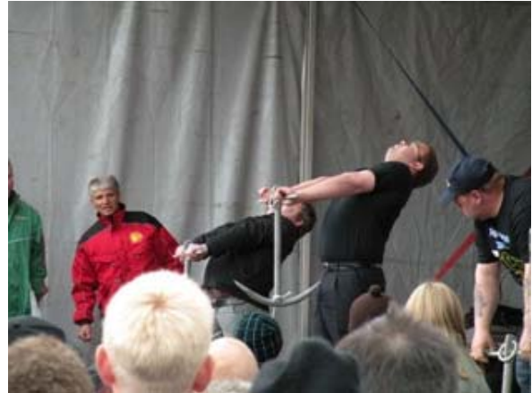
Immagini della Sagra a Klaksvik