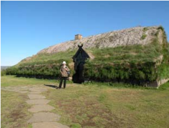
Fattoria di Thiodveldisbaerinn