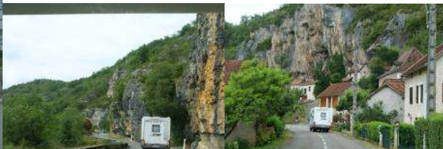
Il ponte di Carjac