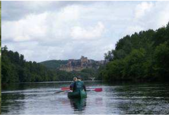
lungo il fiume