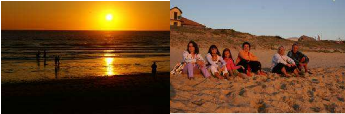
Tramonto sull' Atlantico