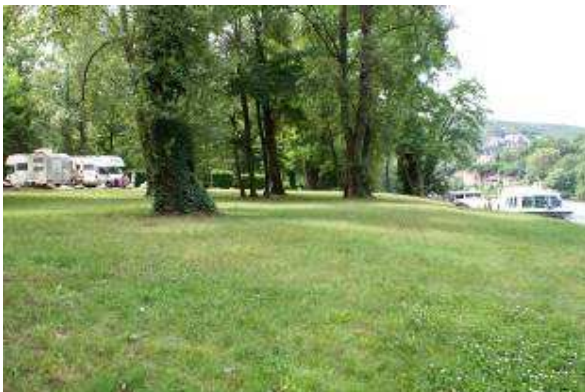
Area di sosta sul Lot