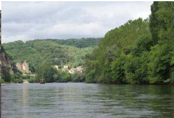
la Dordogna in Gabarre