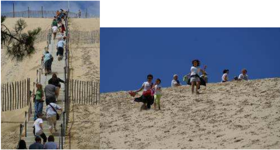
La salita ...