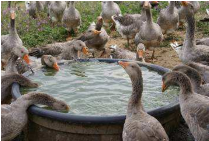
Le oche del Perigord