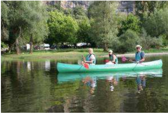
In canoa con i camper sullo sfondo