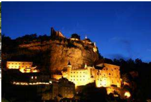
Rocamadour by night