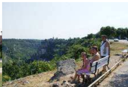
L'ingresso del Gouffre