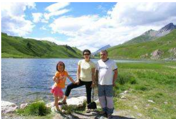
Il colle della Maddalena

Dopo cena qualche gioco simpatico (mimi ecc.), le bambine iniziano il loro quaderno di viaggio E poi a letto.