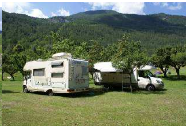
l'area di sosta