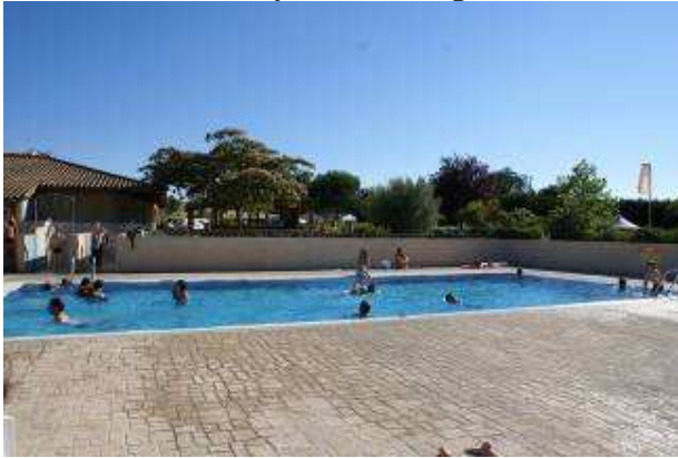
La piscina del "furto"

Valutiamo anche l'opportunità di restare viste le zanzare, le formiche e la quantità di gente presente. Si decide di ripartire domattina, purtroppo senza aver visto il paese. Ci ripromettiamo di tornare magari in un periodo meno affollato, anche perché il paesaggio che abbiamo visto arrivando, i cavalli, i fenicotteri pensiamo valgano un'altra vacanza.