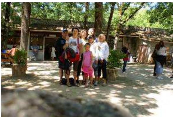
Davanti alle Grotte

Pensiamo di fare un giro per vedere il paese illuminato e veniamo a sapere che alle 21.30 passa proprio qui davanti un trenino che con 5 euro per gli adulti e 2.50 per i bambini ci porta sin giù e poi in una posizione ottimale per ammirare Rocamadour in tutto il suo splendore. Vederla di notte illuminata è veramente imperdibile!