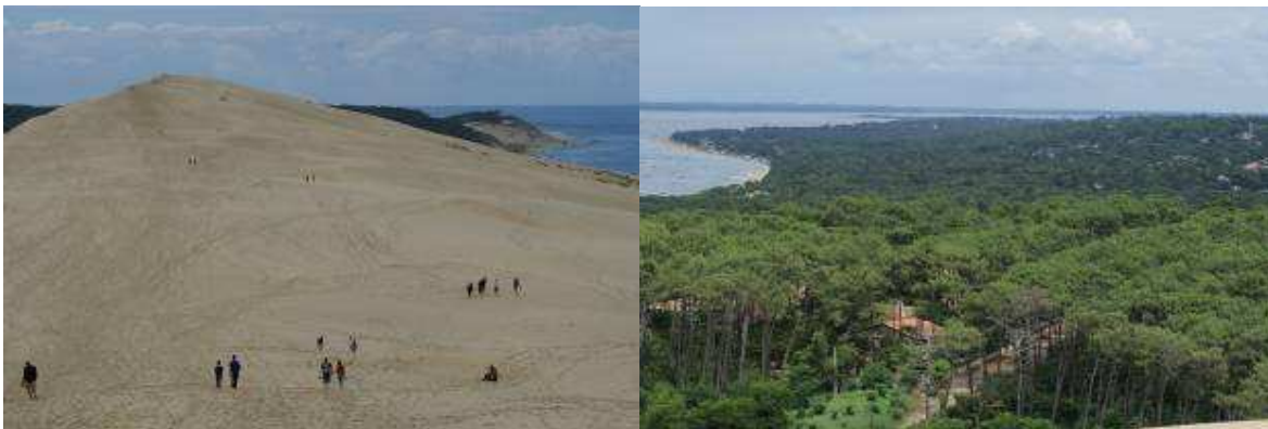
Lo spettacolo della natura