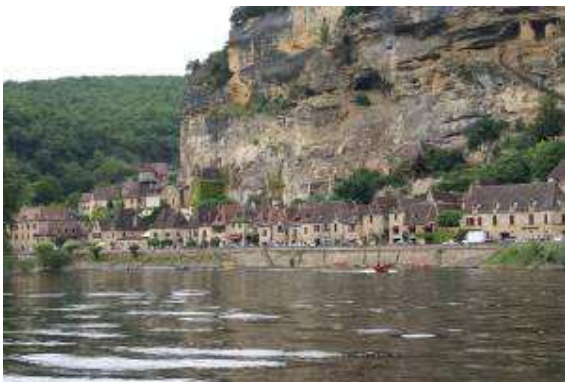
La Roque Gageac