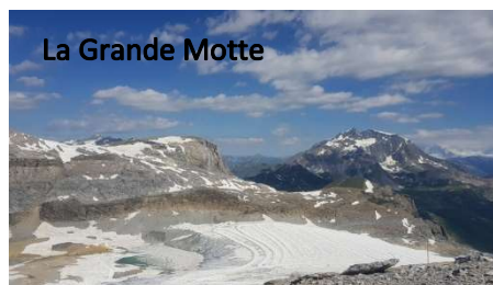
La Grande Motte