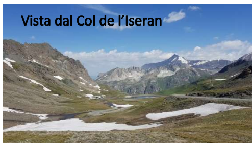
Vista dal Col de l'Iseran

Partiamo verso le 9,00 e poco dopo ci fermiamo al caratteristico villaggio di Bonneval sur Arc (km 10), per acquistare le baghette e le brioches più buone di Francia!! Proseguiamo per il Col de l'Iseran che raggiungiamo verso le 10,30. La giornata è splendida e le vedute panoramiche pure. Siamo a 2770 msl e in