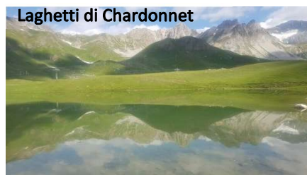
Lagheti di Chardonnet

Dal parcheggio prendiamo un sentiero che ci conduce in un'ora ai Lagheti di Chardonnet . La salita è a tornanti e molto ripida, ma arrivati in cima il percorso spiana fino a quando si imbecca la strada sterrata per il ritorno (10 km). Ci sono numerosi tracciati per le Bike e greggi di pecore al pascolo. Nel pomeriggio invece ci