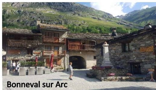
Bonneval sur Arc