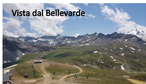
Vista dal Bellevarde