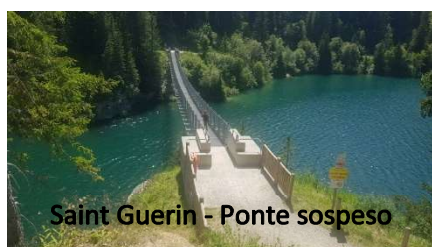
Saint Guerin - Ponte sospeso

Al mattino scendiamo a Beaufort , dove ha origine uno dei tanti famosi formaggi di Francia. Lasciamo il