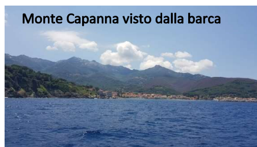
Monte Capanna visto dalla barca