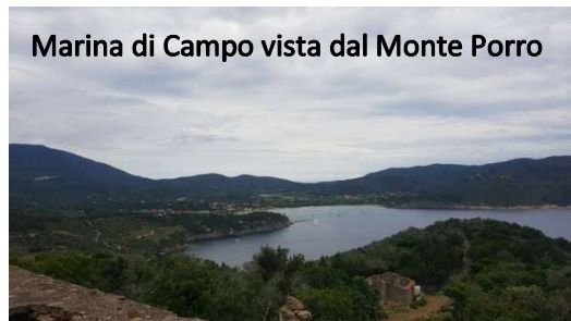
Marina di Campo vista dal Monte Porro