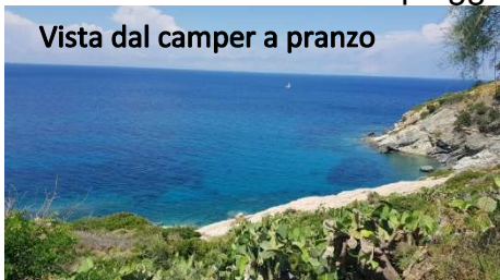
Vista dal camper a pranzo

Alle otto si parte per Pomonte dove arriviamo alle 9,30. Lasciamo il camper, come sempre, parcheggiato lungo la strada e scendiamo alla spiaggia sassosissima del