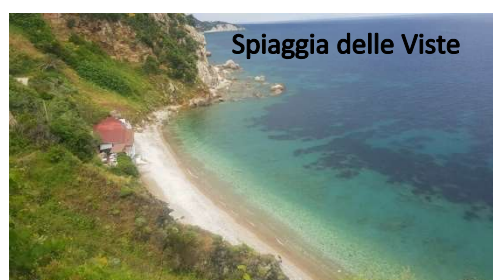
Spiaggia delle Viste

bella). Risaliamo dopo un'oretta ed entriamo tranquillamente nella Villetta dei Mulini (5€/cad). Non è molto grande ma carina, con pannelli esplicativi dei vari locali che la compongono.