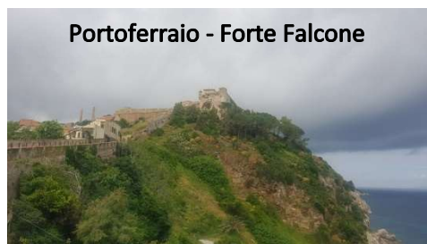
Portoferraio - Forte Falcone

Alle 9,30 (orario di apertura della biglietteria) entriamo a visitare il " Forte Falcone " (7€/cad): si sale gradatamente sui vari livelli dei bastioni fino ad arrivare all'edificio del forte. All'interno si trova una piccola area museale. Proseguiamo per la visita del vicino " Forte Stella " (2€/cad): poco da vedere tranne il panorama. Torniamo al camper per il pranzo e alle 14,00 raggiungiamo, sempre a piedi, la " Villetta dei Mulini ", dove Napoleone esiliato ha dimorato per nove mesi. C'è una coda lunghissima per l'acquisto dei biglietti, quindi decidiamo di scendere alla Spiaggia delle Viste (molto