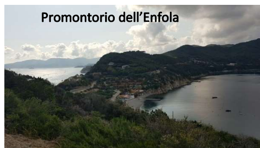
Golfo di Viticcio visto dall'Enfola

In mattinata, a piedi, seguiamo le indicazioni per il percorso ad anello di 5 km sul promontorio di Capo d'Enfola . Lungo la salita è possibile scorgere dei ruderi bellici risalenti al sistema difensivo della seconda guerra mondiale e scorci panoramici tra il golfo di Viticcio , le spiagge di Portoferraio , il canale di Piombino e il Continente . A circa metà percorso una deviazione scende alle falesie a picco sul mare dove nidificano diversi specie di uccelli marini. L'intero tracciato è quasi