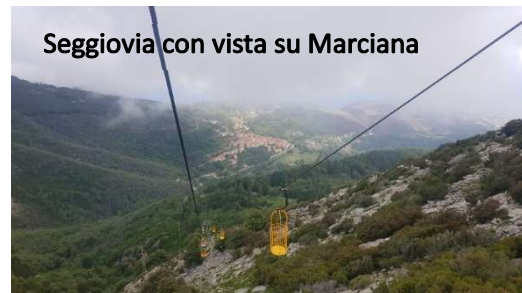
Seggiovia con vista su Marciana