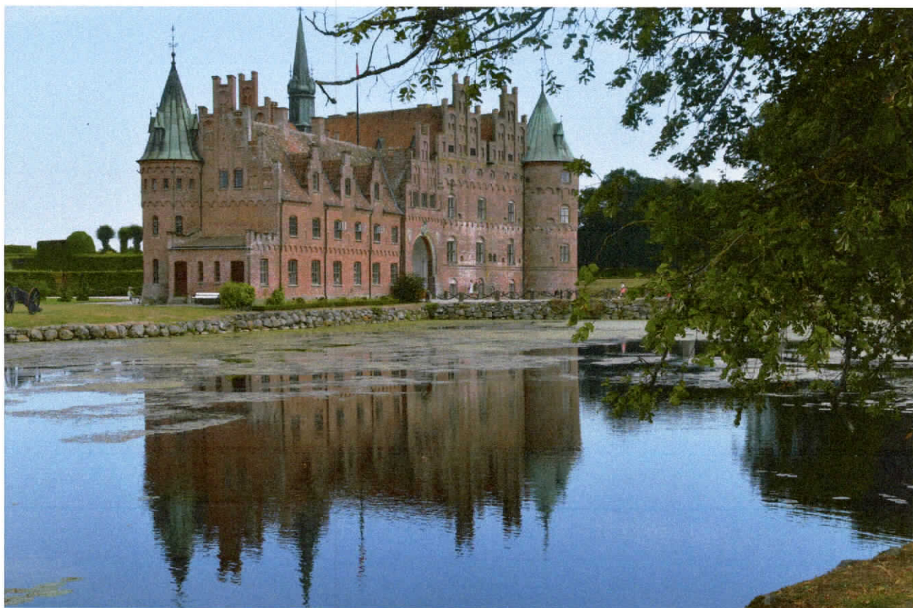
Castello di Egeskov

15 Agosto, Aarhus – Egeskov – Odense: partenza al mattino dopo colazione, purtroppo la sosta non è stata molto buona, troppo rumore della strada e dei gabbiani. Gasolio € 97,00 poi direzione castello di Egeskov, ampio parcheggio molto comodo, l'ingresso € 70,00 x due persone (un po' troppo caro), comunque il castello è molto bello, molto bella la collezione di auto e moto d'epoca veramente d'effetto. Pranzo all'interno del parco € 21,50 e dopo 3 ore ritorno al camper per dirigerci nel centro di Odense. Il centro è molto frequentato da turisti, bello e caratteristico, non siamo entrati nella casa di Andersen perché troppo affollata. Ripartiamo per dirigerci in area sosta per la notte, piccolissima area sperduta nella campagna però graziosissima € 21,00 con tutti i servizi. Nyborg 55.2938, 10.71281. Tot. € giorno 209,50. Km giorno 240€ 1.269,50 Km 2.830