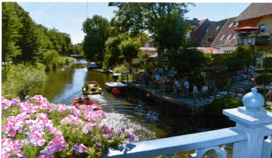
Foto di Friedrichstadt

10 Agosto: Brema – Friedrichstadt – Hojer, Tappa abbastanza lunga anche per il traffico, sosta in autostrada x il pranzo e piccola spesa € 28,50 poi arrivo a Friedrichstadt, uno degli ultimi paesi prima della Danimarca. Paesino molto grazioso circondato da canali su cui si gira in canoa o barconi, pieno di localini, ottimo. Ripartenza, gasolio € 80,00, per l'arrivo in Danimarca a Hojer dove si trova il più grande mulino. Area sosta nel paradiso, immersi nella natura nel più assoluto silenzio, una grossa fattoria Hotel e parcheggio camper con docce bagni e corrente € 24,00 Hojer, 2 Siltofvej 54.955172, 8.68245 Tot. € giorno 132,50. Tot. Km giorno 360 € 656,50 Km 1700