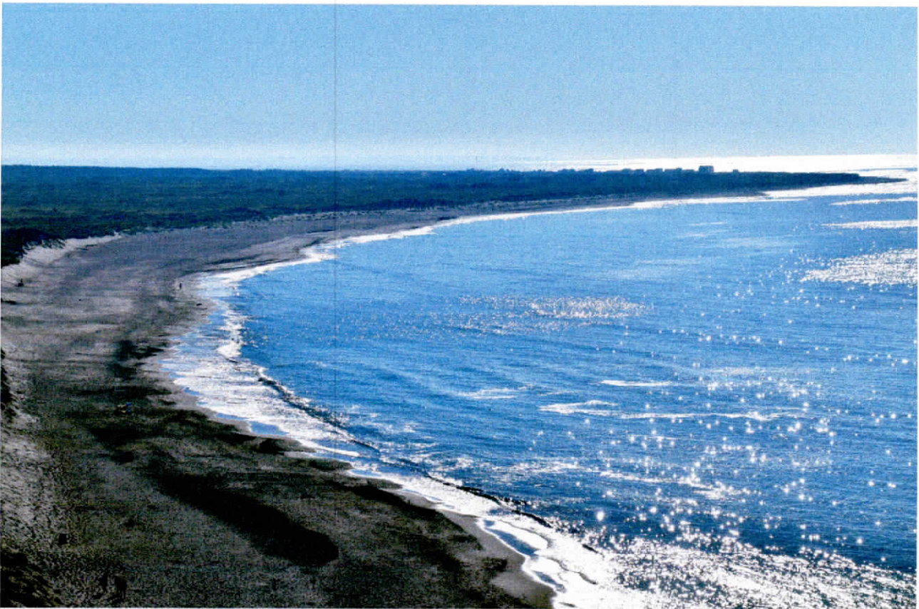
Scogliera di Bulbjerg

12 Agosto: Ringkebing – Thyboron – Spottrup – Bulbjerg, partenza dal campeggio percorrendo tutta la litoraneo fino a Thyboron, caratteristica cittadina sul mare famosa per la casa ricoperta di conchiglie. Seconda tappa il castello di Spottrum, prima piccola sosta per il pranzo in una delle bellissime aree lungo la strada. Il castello merita la visita € 20,00 in due. Ripartiamo per recarci sulla costa a visitare le famose scogliere di Bulbjerg, gasolio € 98,00. Le scogliere valgono sicuramente la visita, c'è il parcheggio ma non si può sostare la notte quindi ci spostiamo in una piccola area sosta lungo la strada dove regna la più assoluta tranquillità € 17,00 per la notte compreso corrente carico e scarico, Vust Gamle Station 57.099297, 9.07683. Consigliata. Tot € giorno 135,00 Tot Km giorno 310. € 900,50 km 2200