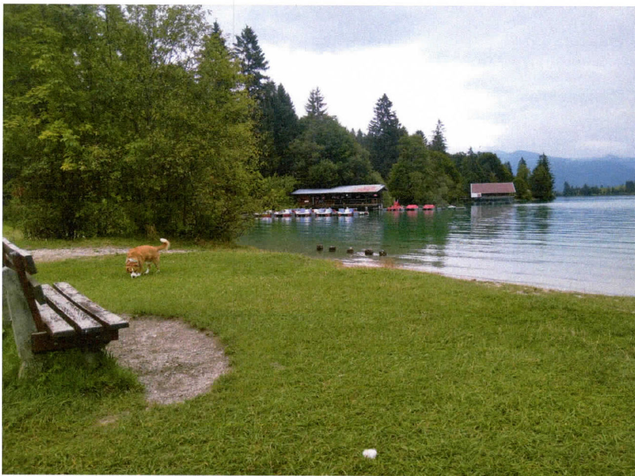
Foto della Area Sosta

7 Agosto: ore 10,30 finalmente partenza da Pozzuolo Martesana (MI) direzione Walchensee (piccolo lago in Germania) a nord di Innsbruck. € 88,00 gasolio, 9,80 Vignetta x Austria, 5,00 pedaggio. Parcheggio nell'area camper senza servizi ma perfetta per una notte € 10,00 47.569302, 11.3029. Parcheggio senza servizi. Tot. € giorno 112,80 Tot. Km giorno 450. € 112,80 Km 450