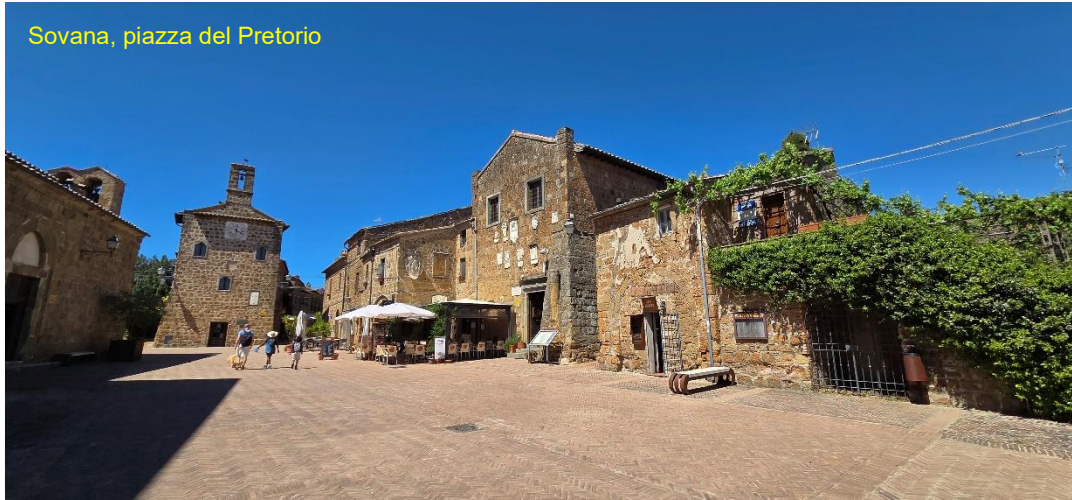
Sovana, piazza del Pretorio

Dopo colazione, siamo già in viaggio per Sorano , che raggiungiamo in circa 1 ora di viaggio, sosta in un comodo parcheggio all'ingresso del paese 42.681006 , 11.711401 gratuito, senza servizi, anche notte.