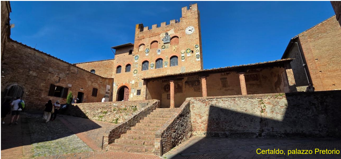
Certaldo, palazzo Pretorio

I nostri vicini "affumicatori" se ne vanno prima di noi, fortunatamente abbiamo già terminato colazione e stiamo per pagare e partire, perché negli interminabili minuti in cui scaldano il loro motore, hanno