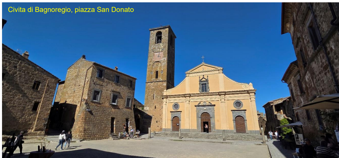
Civita di Bagnoregio, piazza San Donato

frazionabili, notte gratuita). a circa 1.8km dall'ingresso al borgo di Civita . Paghiamo la sosta fino alle 9 di domattina, e facciamo online i biglietti per la visita alla parte storica del paese. Dopo pranzo, in circa 30