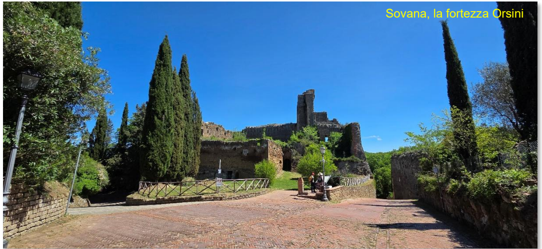
Sovana, la fortezza Orsini

proseguiamo fino al Masso Leopoldino , sulla cui sommità si trova un enorme terrazzo che permette di apprezzare una splendida visuale sul paese e sulle valli circostanti. Perderci per questi vicoli è come fare un viaggio nel tempo, superata la Porta dei Merli , saliamo fino alla Fortezza Orsini , realizzata dalla famiglia Aldobrandeschi , oggi ospita il Museo Civico Archeologico .