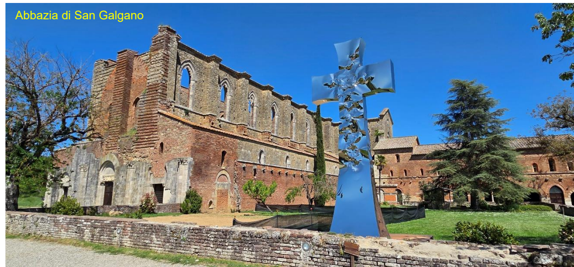
Abbazia di San Galgano

precedenti, in un piccolo ma comodo spiazzo sulla strada 43.179085, 11.547080 , ed in 10 minuti di camminata siamo all'abbazia. Ci sono i bagni, visitiamo la chiesa e la cantina che produce e vende una