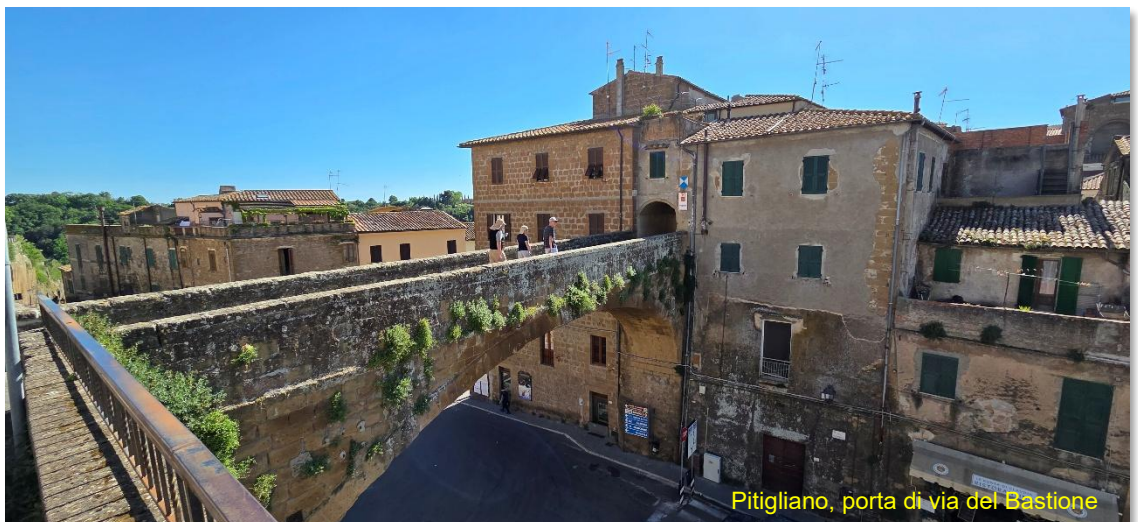
Pitigliano, porta di via del Bastione

a pagamento di giorno (fino a 12 euro, frazionabili), gratuito dalle 20.00 alle 08.00, CS gratuito, ma purtroppo anche qui il tombino è colmo e quindi non utilizzabile, acqua a pagamento, ma ho letto che fornisce pochi litri.