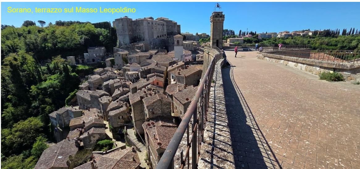
Sorano, terrazzo sul Masse Leopoldino

Meraviglia storica destinata ad un lento quanto inevitabile declino, in un futuro purtroppo già scritto. Per