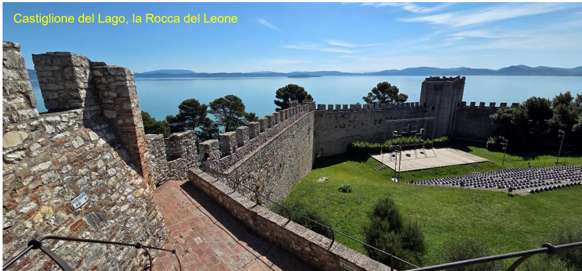
Castiglione del Lago, la Rocca del Leone

Bella giornata e bellissimo sole, quasi nessuno in giro, visitiamo il centro storico, passeggiamo lungo via Vittorio Emanuele e via del Forte , in piazza Gramsci apprezziamo splendide visuali mozzafiato dai