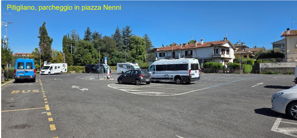
Pitigliano, parcheggio in piazza Nenni

una rapida visita al vicino supermercato Coop , qualcosa in cambusa manca sempre (bugia). Nel tardo pomeriggio, anche per non trovare eccessiva calura, andiamo a visitare il paese. Pitigliano è uno dei borghi più belli di tutta la Maremma , costruita sul tufo, conosciuta anche come La Piccola Gerusalemme per la