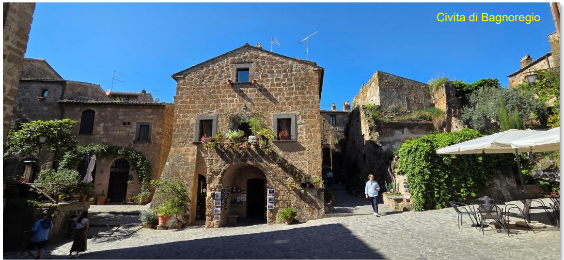
Civita di Bagnoregio

La famosa “ Città etrusca che muore ”, Civita di Bagnoregio è così chiamata perché la collina su cui sorge, sta subendo da secoli una lenta ma inarrestabile erosione, causata dalla friabilità del materiale argilloso di cui è composta.