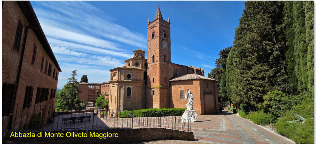
Abbazia di Monte Oliveto Maggiore

Dopo colazione si parte per l'abbazia di Monte Oliveto Maggiore , che raggiungiamo in poco meno di un'ora di viaggio, non si può arrivare in camper fino ai parcheggi a pagamento previsti (specifico segnale di divieto di accesso). Meglio così, lo lasciamo nello stesso posto delle visite