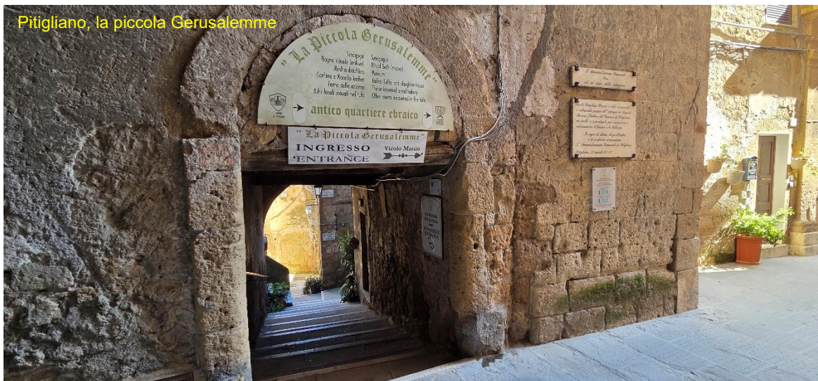
Pitigliano, la piccola Gerusalemme

Santa Maria Maggiore, che visitiamo, la giornata è molto calda e soleggiata, il fresco dell'interno è rigenerante. Nonostante il paese sia piccino, ci sarebbe tanto altro da visitare, ad esempio la necropoli ed il museo di