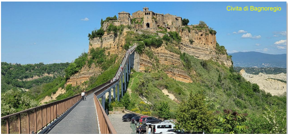
Civita di Bagnoregio

centro storico sono più alti, e si torna al camper. Direzione Civita di Bagnoregio , una volta arrivati, tra le varie opzioni di sosta, preferiamo il parcheggio 42.629773, 12.092473 , anche camper, a pagamento automatizzato (7 euro dalle 08.00 alle 20.00, anche