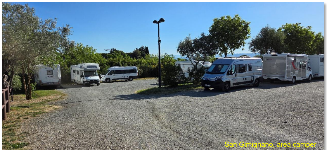
San Gimignano, area camper

desiderio di mettersi con gli ingressi vis a vis. Tra urla e manovre non trovava pace, in un continuo su e giù dalle zeppe a pochi centimetri da noi. Ma quel che è peggio, grazie al loro vecchio motore fumante sempre accelerato, sono riusciti anche ad impestare di smog tutta l'area. Il