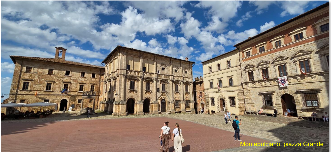
Montepulciano, piazza Grande

polvere in quantità e forti vibrazioni, hanno shakerato per benino noi, ed il nostro camper fino