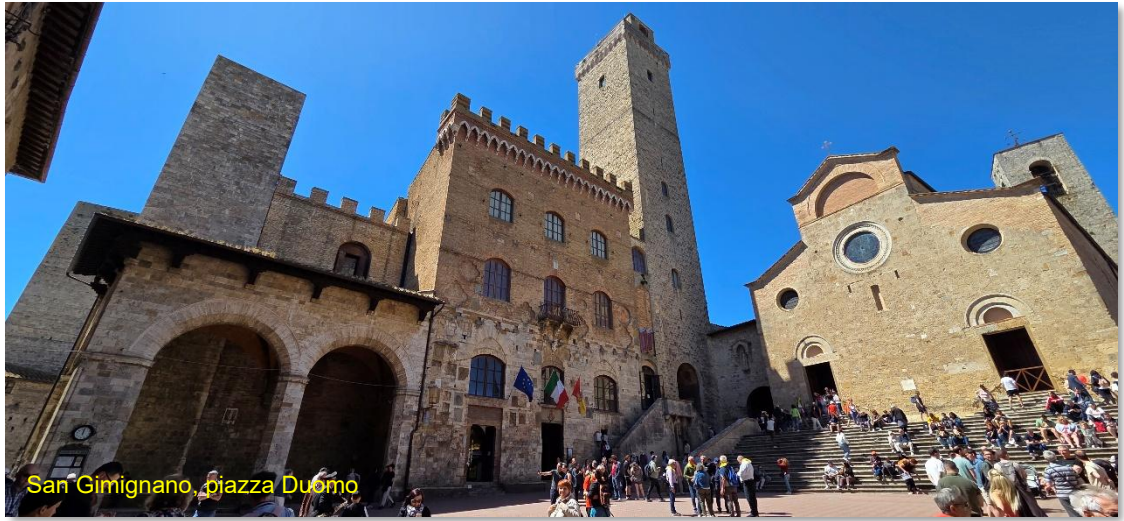
San Gimignano, piazza Duomo

Consumiamo le nostre ottime schiacciate seduti al sole in piazza Luigi Pecori, proseguiamo perdendoci nelle