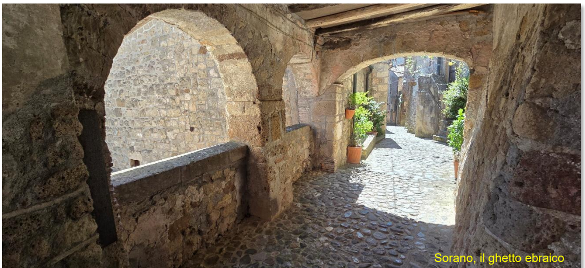
Sorano, il ghetto ebraico

l'avanzamento dell'erosione viene costantemente monitorato. Rientro lungo corso Giuseppe Mazzini e sosta per una veloce spesa alla Conad del paese.