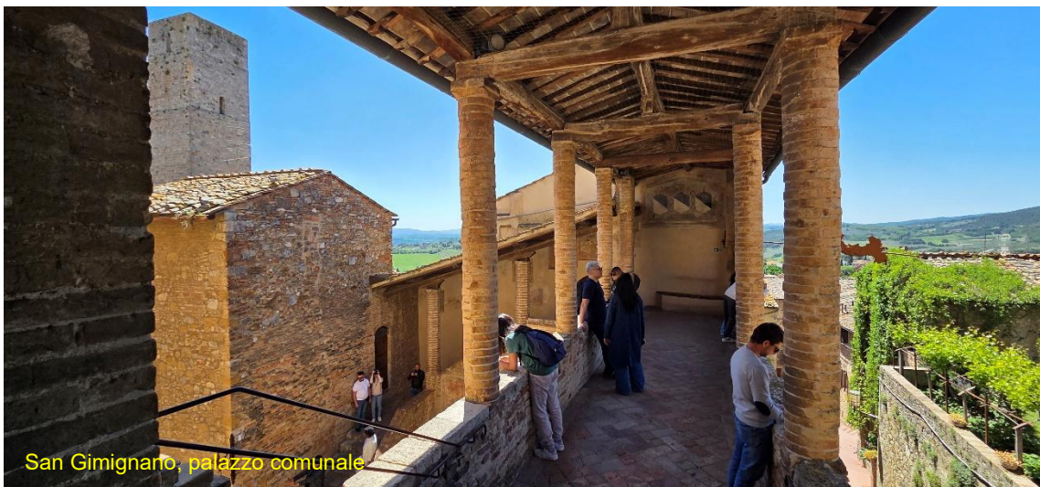
San Gimignano, palazzo comunale

stradine e sul sentiero di ronda attorno alle mura. Un gelato, ma non alla famosa gelateria Dondoli, perché davanti c'è la solita ed immensa fila. Posso assicurare che il nostro era comunque ottimo. Saliamo fino al parco della Rocca, per una visita dal terrazzo del belvedere e per rilassarci all'ombra, oggi il sole