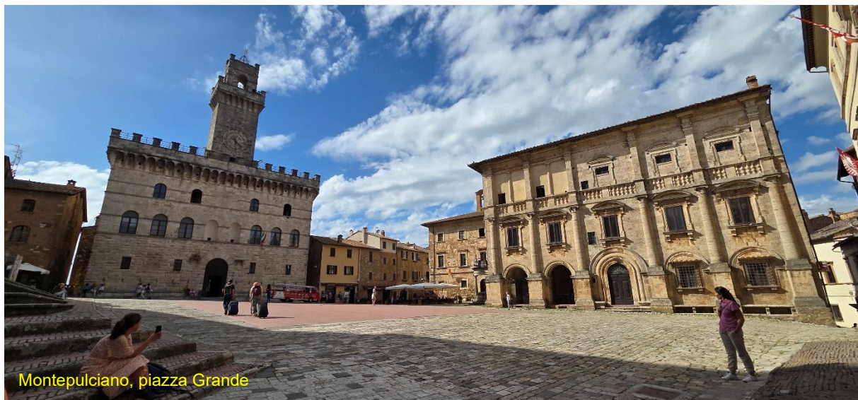
Montepulciano, piazza Grande

semplicemente spettacolare, spaziosa, zone in ombra, CS pulitissimo, ampio ed efficiente, tutto gratuito, al momento gli attacchi elettrici non funzionano. Approfittiamo della sosta tecnica per visitare questo borgo antico che già dalla cura (ed offerta gratuita) dell' AA , sembra promettere molto bene. E così è, arrivati in piazza Garibaldi , ci rendiamo conto delle bellezze, il museo delle miniere, vicoli medioevali che si diramano sotto piccole volte, la chiesa del Suffragio e la chiesa di Santa Clara . Scendiamo fino ad arrivare alla chiesa della Madonna della Neve , al cui interno una parte del pavimento in vetro, permette di