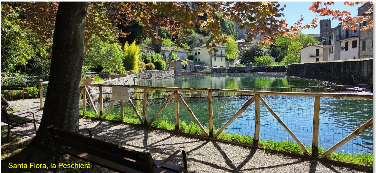
Santa Fiora, la Peschiera

ma con questi paesaggi, il tempo scorre serenamente e non si sente nemmeno troppo la fatica della guida. A Santa Fiora entriamo nell' AA del paese