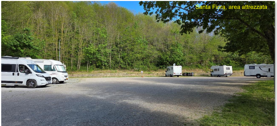
Santa Fiora, area attrezzata

Mediceo e superata piazza della fortezza Orsini , ci immergiamo nelle antiche viuzze lungo via Zuccarelli fino al museo ebraico che, a causa dell'attuale momento politico, è presidiato da militari in divisa con fucili spianati. Visitiamo la