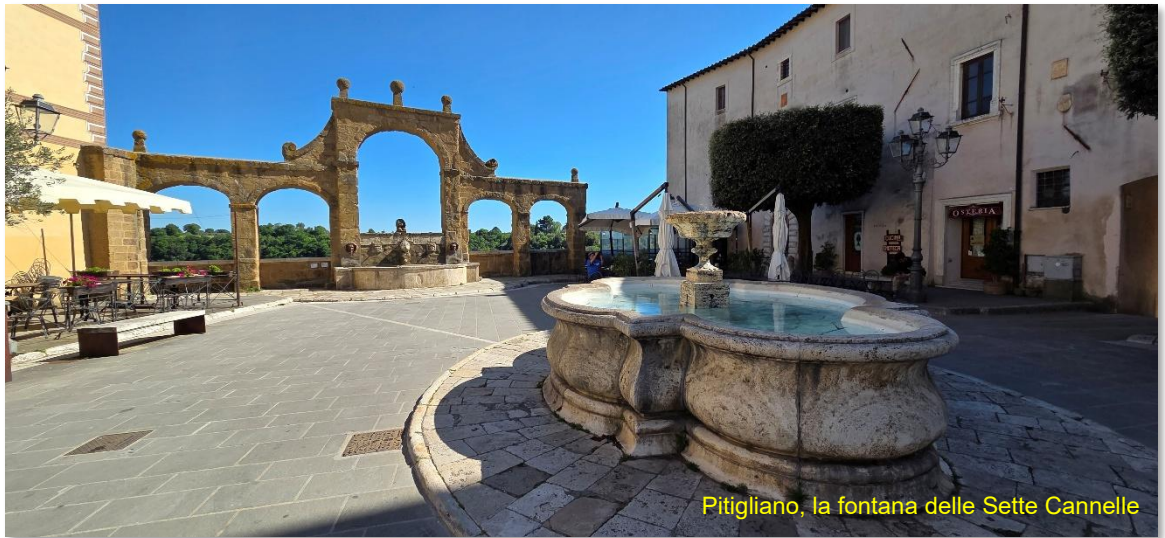
Pitigliano, la fontana delle Sette Cannelle

Sovana, Sorano e Pitigliano, sono i tre gioielli medioevali della Maremma, chiamate anche Città del tufo, perché costruite su speroni di roccia vulcanica. Il paesino si