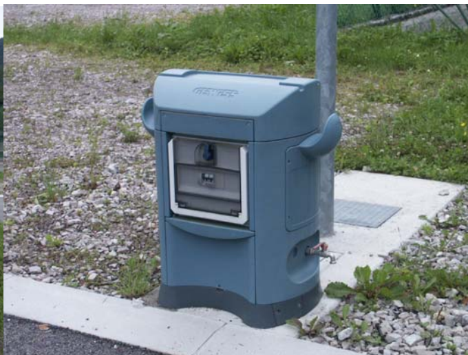
I SERVIZI IN PIAZZOLA