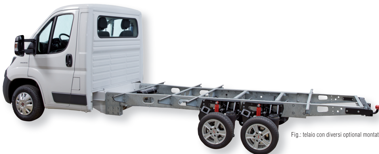
Fig.: telaio con diversi optional montati.