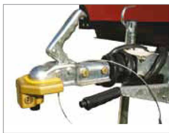
Antifurto standard a perno con serratura a chiave