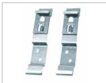
Fissaggio rapido targa ripetitrice