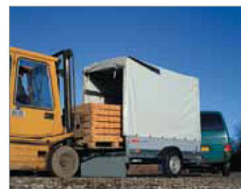
Centina e telo