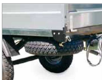
Ruota di scorta