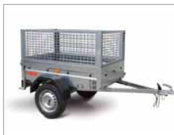
Sovrasponda in rete metallica