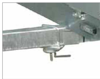
Supporto ruota di scorta