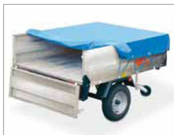
Copertina telata parisponda