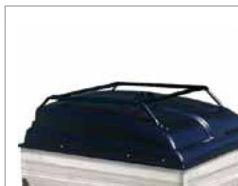
Portabici con coperchio