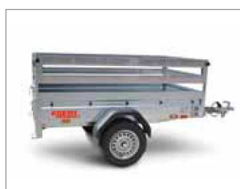
Sovrasponda a scala in alluminio