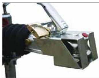
Antifurto per piccoli giunti con lucchetto

Tutti i modelli di rimorchi per il tempo libero presentati in questo catalogo sono disponibili con un allestimento base. In funzione delle proprie esigenze qualsiasi utilizzatore può, all'atto dell'acquisto o successivamente, personalizzare il proprio rimorchio scegliendo tra la vasta gamma di accessori disponibili.