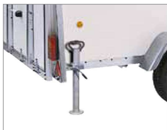
Piedi di stazionamento