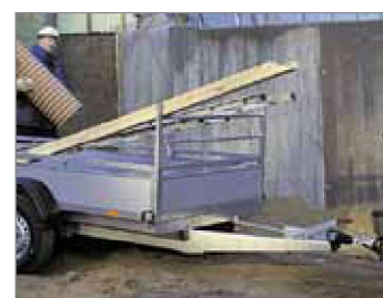
Sovrasponda anteriore a tubi