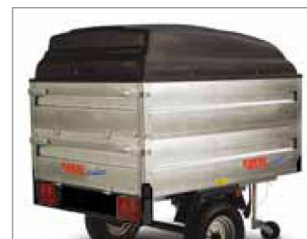
Coperchio e sovrasponde