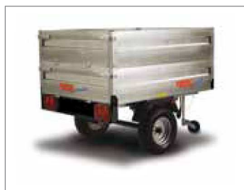
Sovrasponda in acciaio