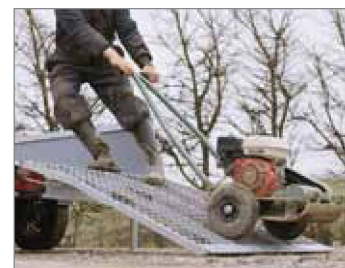
Rampa di salita