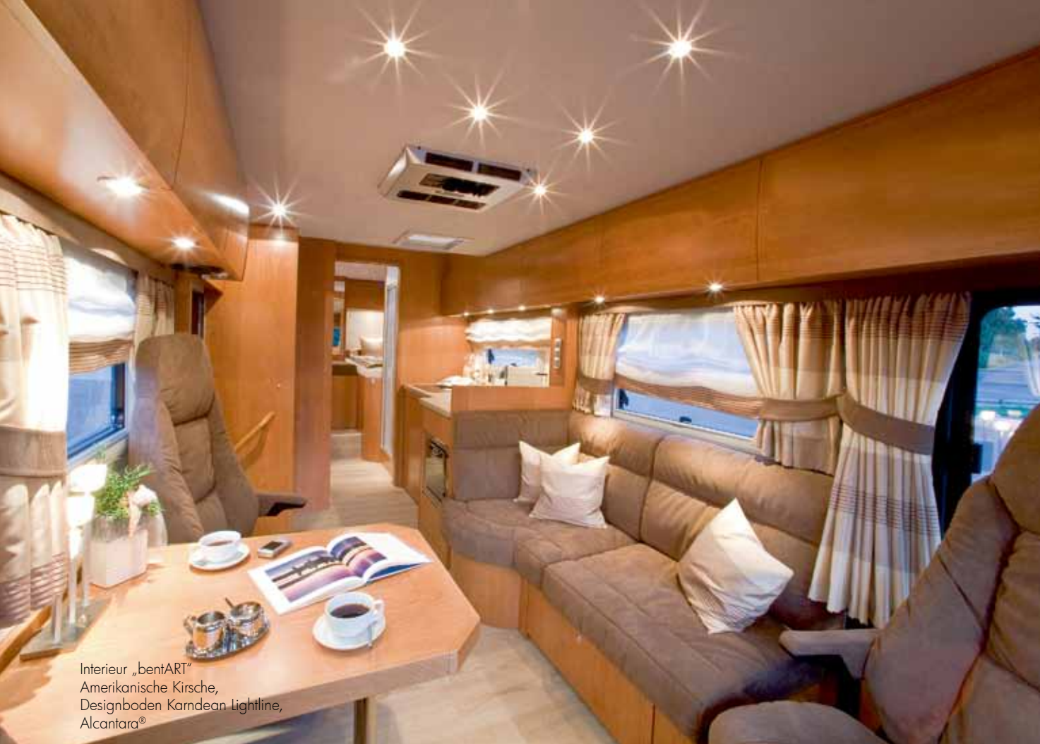
Interieur „bentART“ Amerikanische Kirsche, Designboden Kardean Lightline, Alcantara®