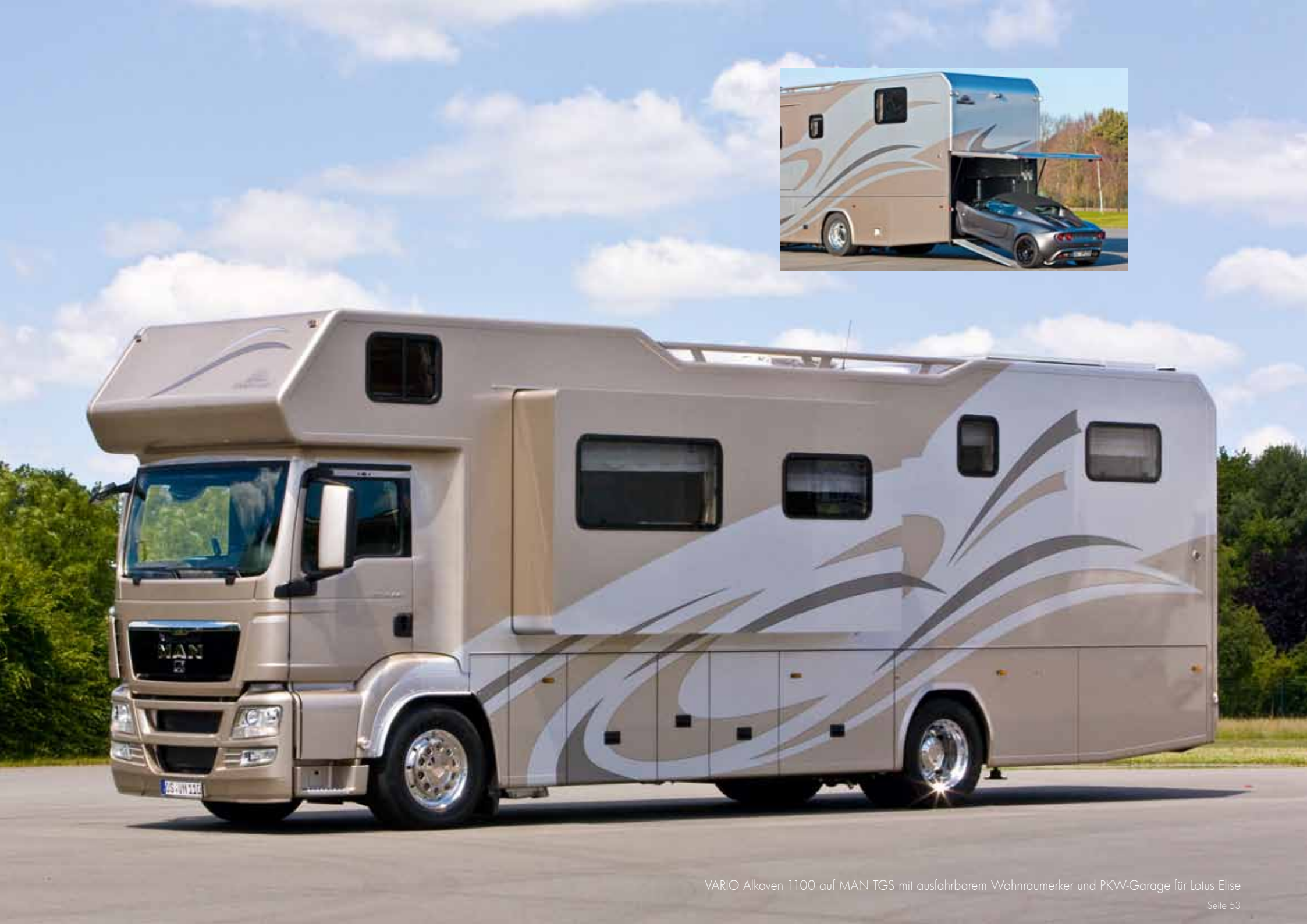
VARIO Alkoven 1100 auf MAN TGS mit ausfahrbarem Wohnraumerker und PKW-Garage für Lotus Elise