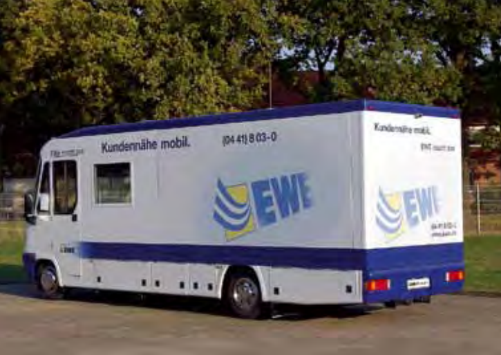
VARIO 1100 TI auf MAN TGS