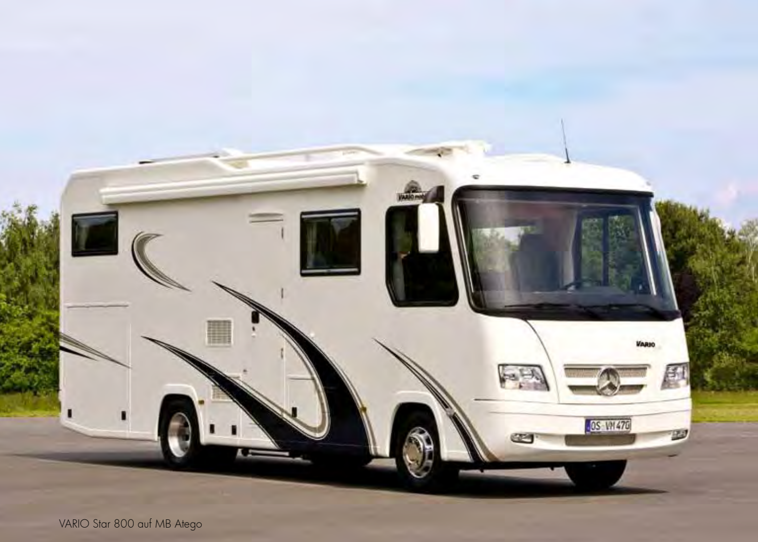
VARIO Star 800 auf MB Atego