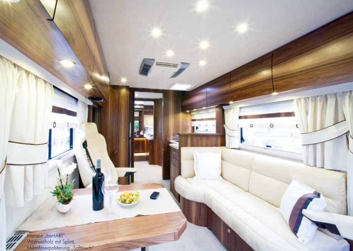
Interieur „bentART“ Walnussholz mit Splint, Mikrofaserpolsterung „Softtouch“