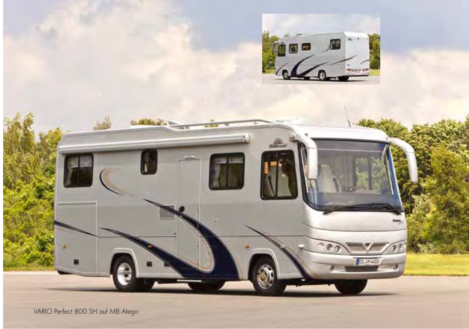
VARIO Perfect 800 SH auf MB Atego