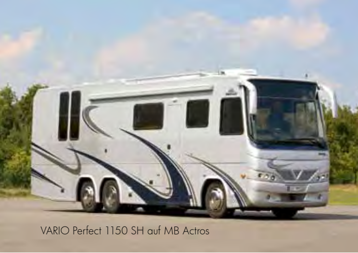
VARIO Perfect 1150 SH auf MB Actros