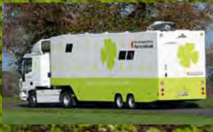
Rollende Geschäftsfilialen - als VARIO-Kofferaufbau und VARIO-Sattelaufleger auf IVECO Daily