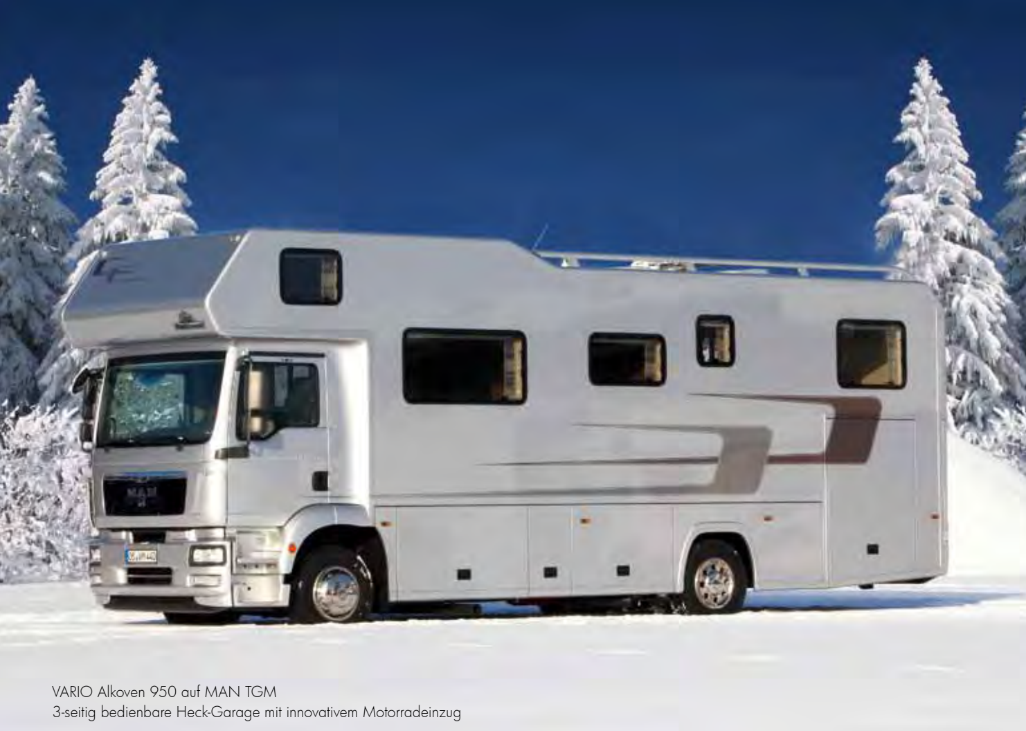
VARIO Alkoven 950 auf MAN TGM 3-seitig bedienbare Heck-Garage mit innovativem Motorradeinzug