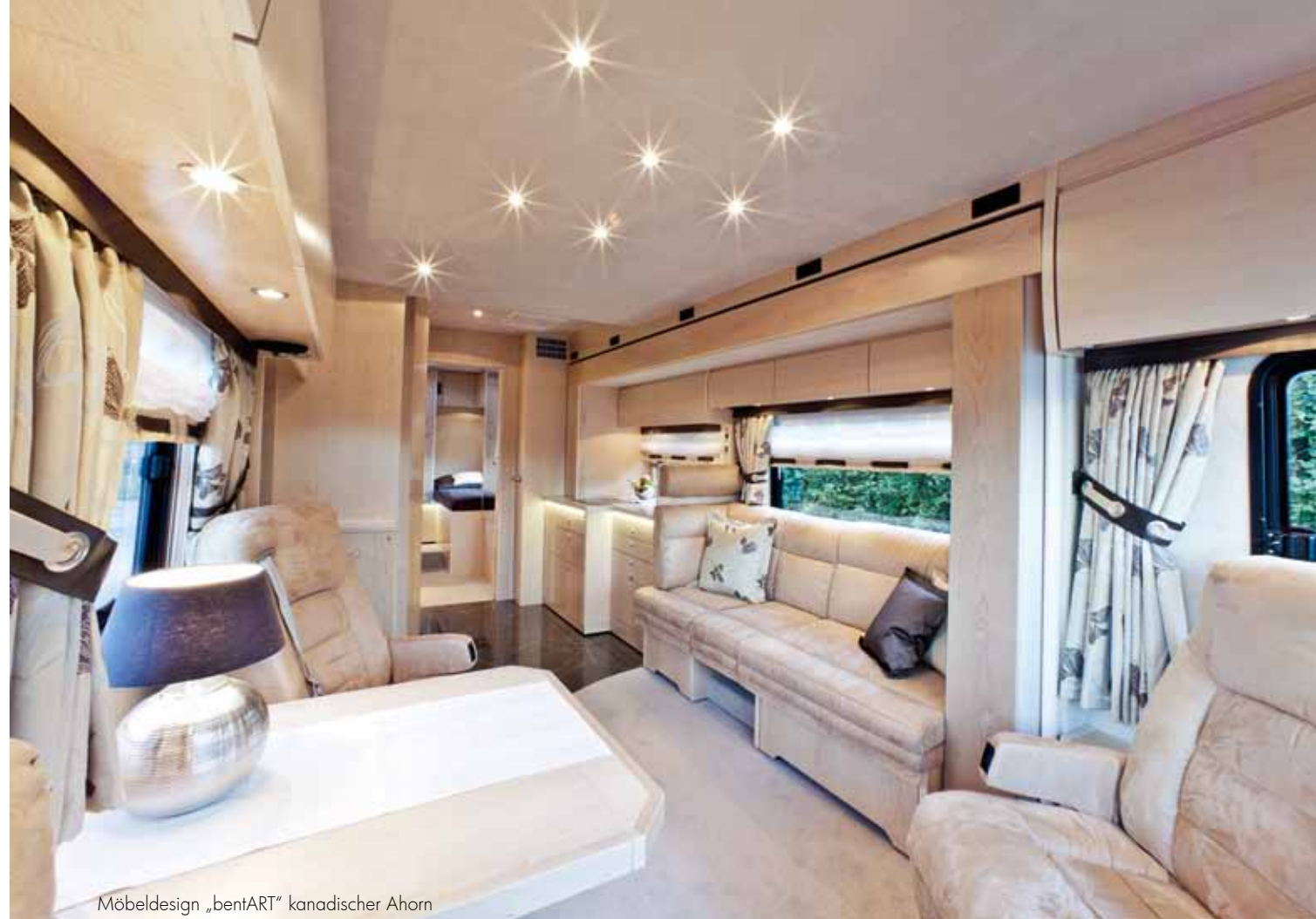
Möbeldesign „bentART“ kanadischer Ahorn