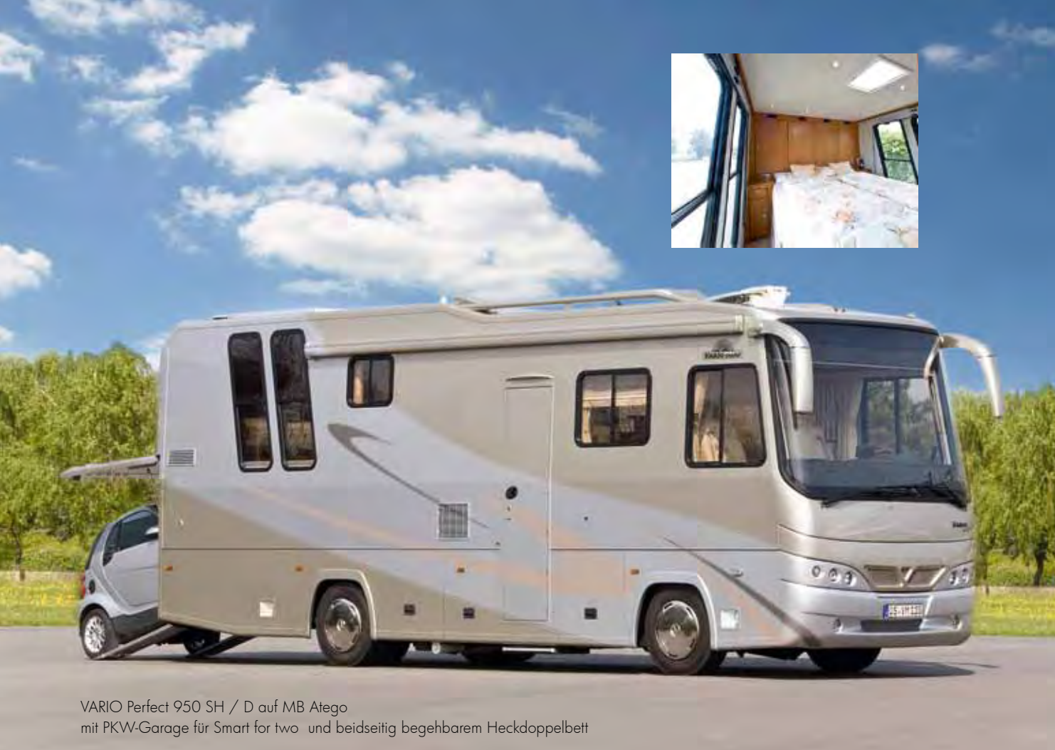
VARIO Perfect 950 SH / D auf MB Atego mit PKW-Garage für Smart for two und beidseitig begehbares Heckdoppelbett