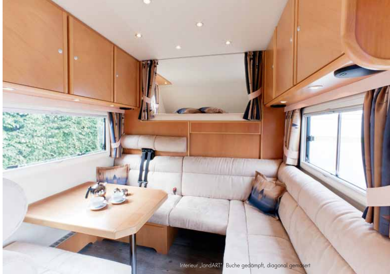
Interieur „landART“ Buche gedämpft, diagonal gemasert