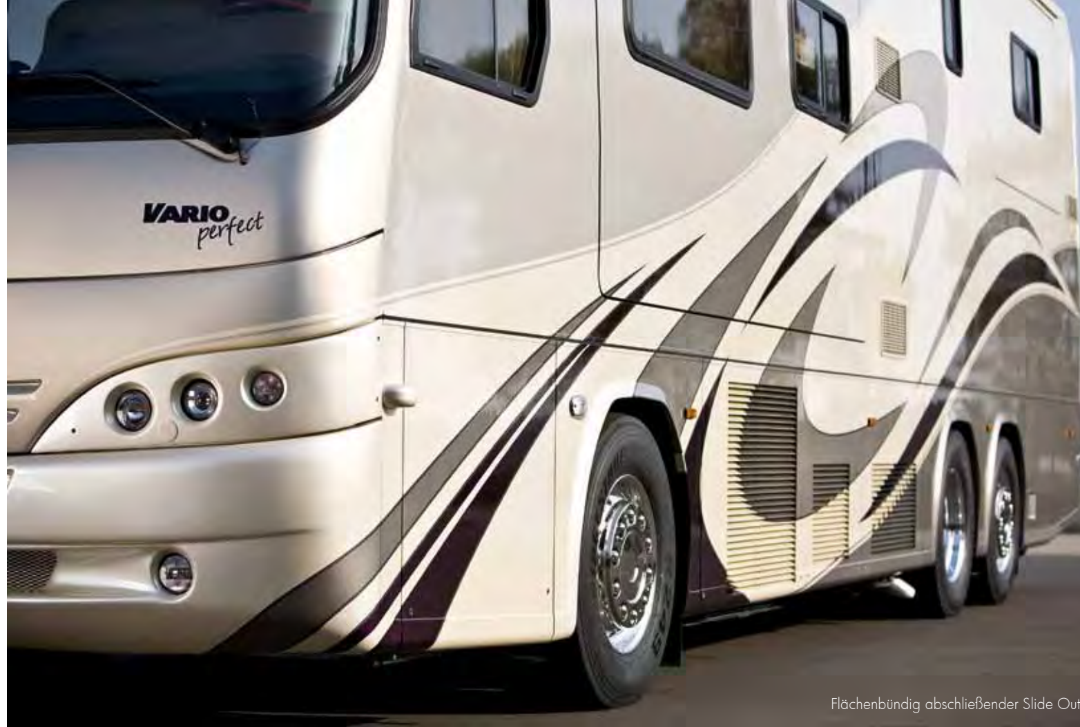
Flächenbündig abschließender Slide Out