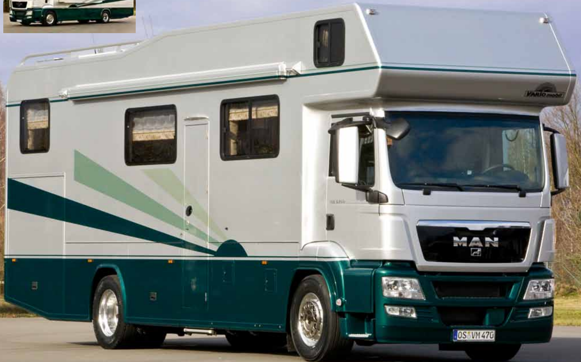
VARIO Alkoven 1000 auf MAN TGS mit ausfahrbarem Wohnraumker