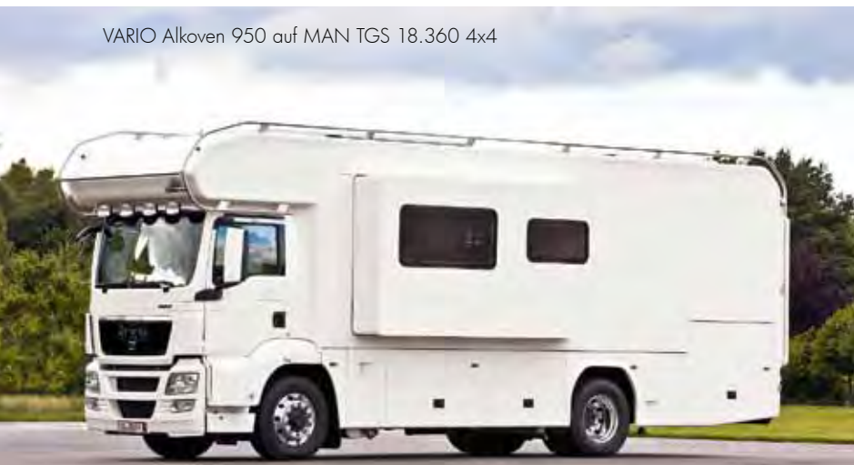
VARIO Alkoven 950 auf MAN TGS 18.360 4x4

The VARIO alcove coachwork, alternatively from aluminium or glass fibre reinforced plastic (GRP) distinguish itself through the high stability of the full-isolated, warp resistant bodywork. Because of application of high-quality glues all curves are laminated by hand. The roof is fully loadable on the hole surface, so also heavy loads can be transported on it.