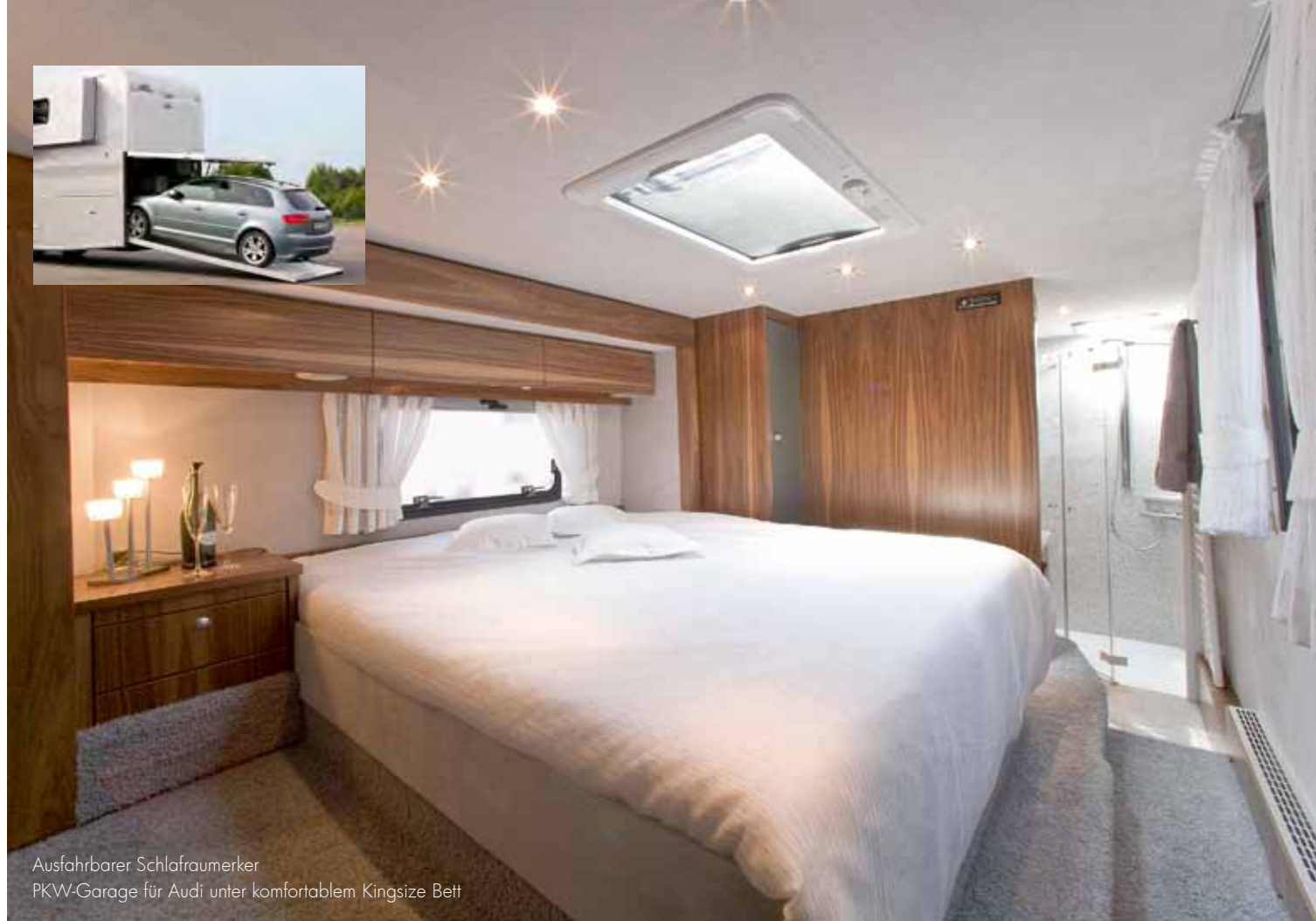
Ausfahrbarer Schlafraumerker PKW-Garage für Audi unter komfortablem Kingsize Bett