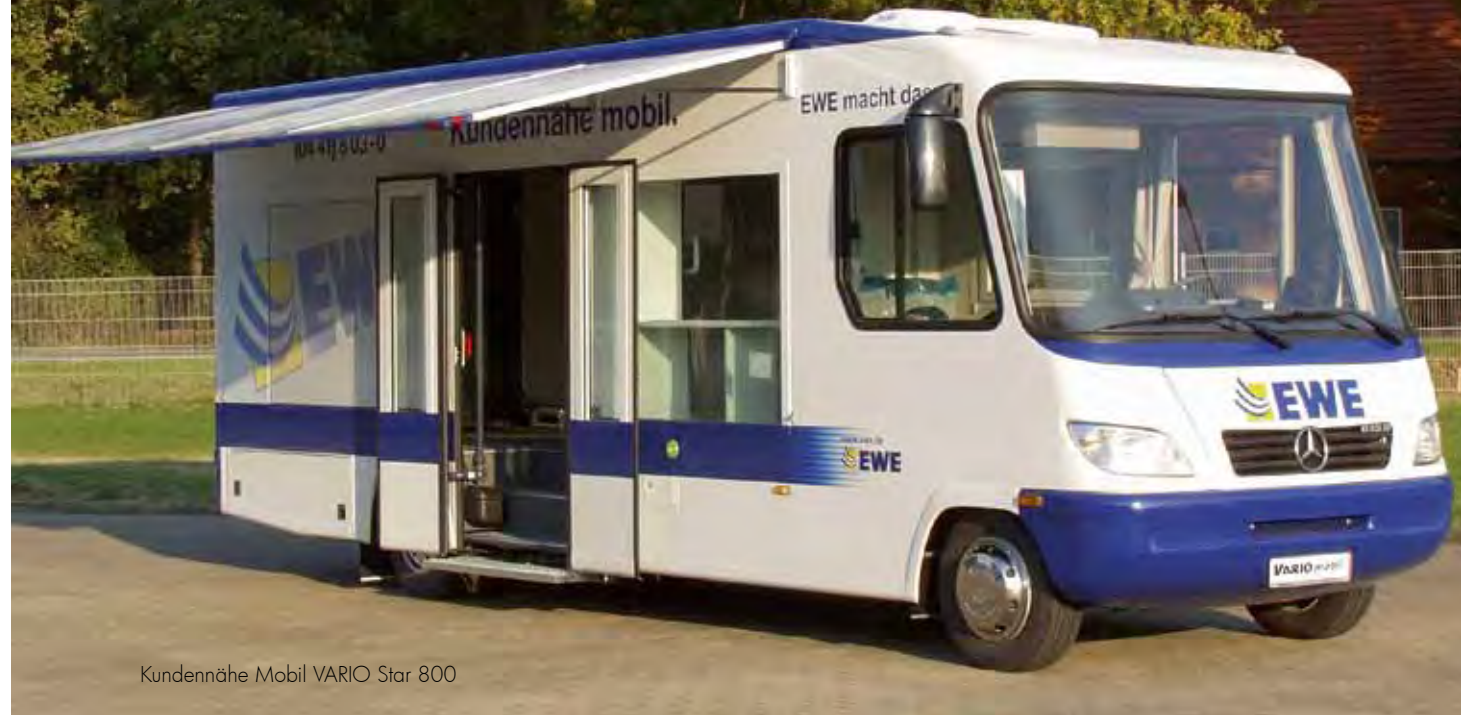
Kundennähe Mobil VARIO Star 800