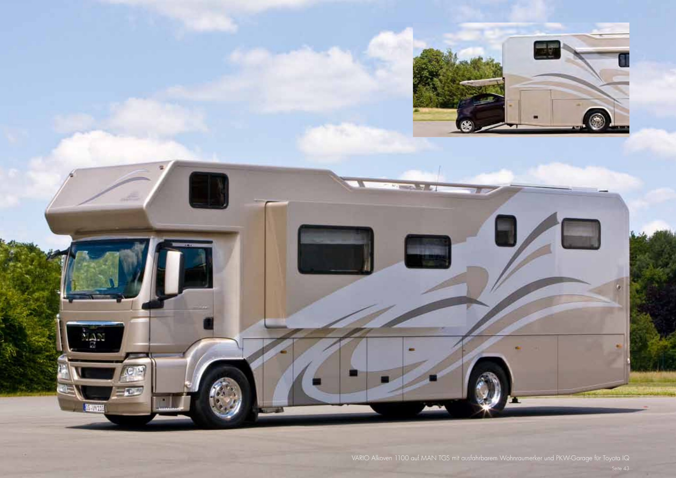
VARIO Alkoven 1100 auf MAN TGS mit ausfahrbarem Wohnraumerker und PKW-Garage für Toyota IQ