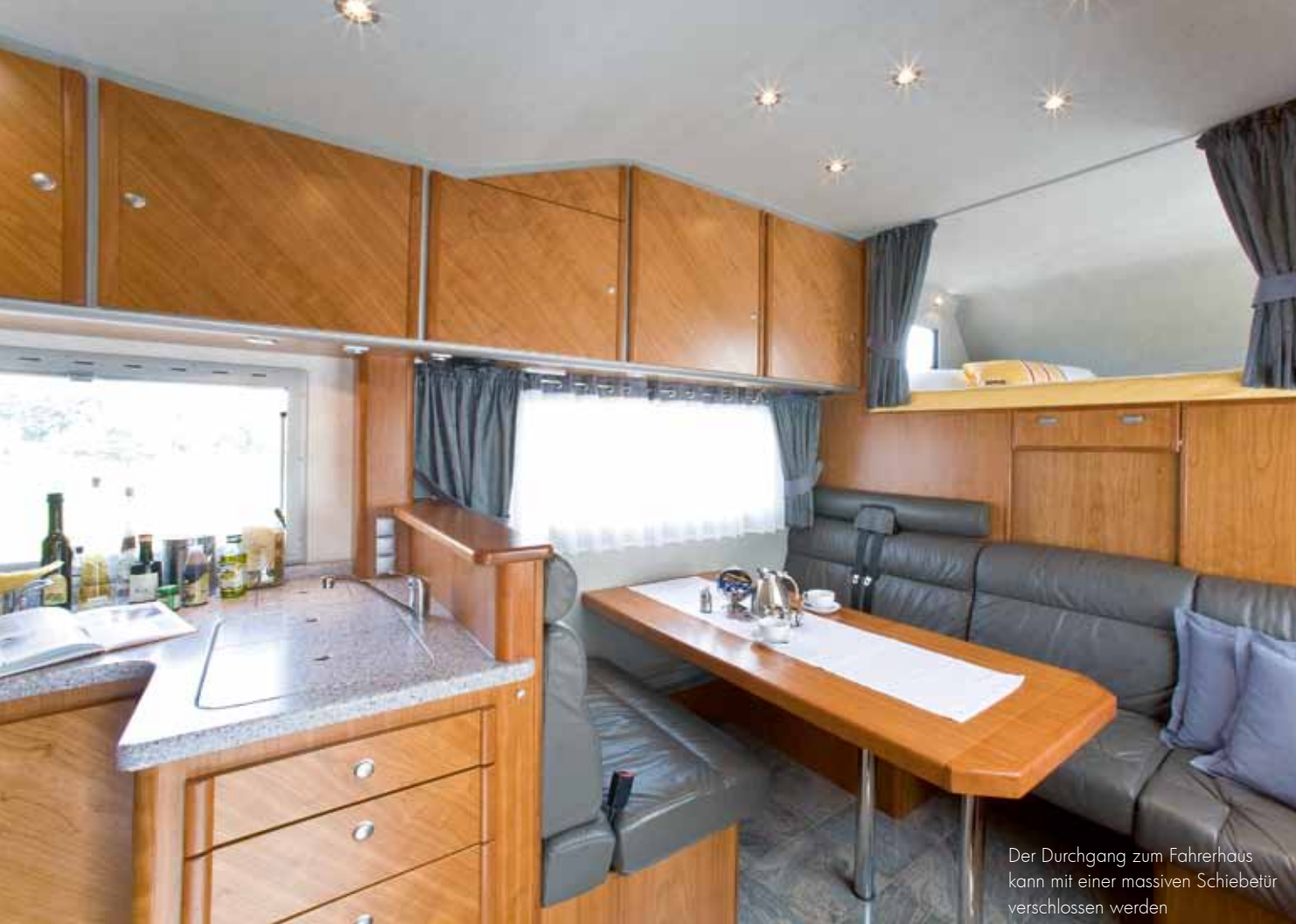
Der Durchgang zum Fahrerhaus kann mit einer massiven Schiebetür verschlossen werden