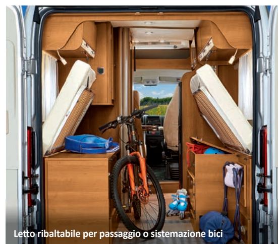
Letto ribaltabile per passaggio o sistemazione bici