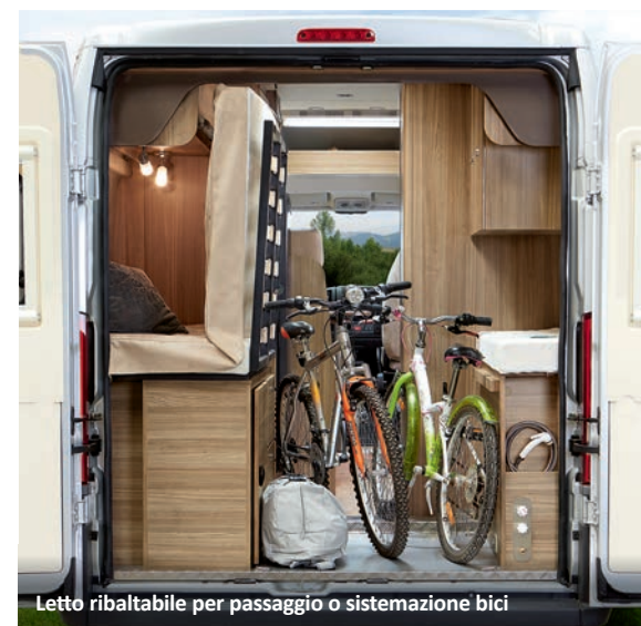
Letto ribaltabile per passaggio o sistemazione bici