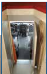
1 + 12