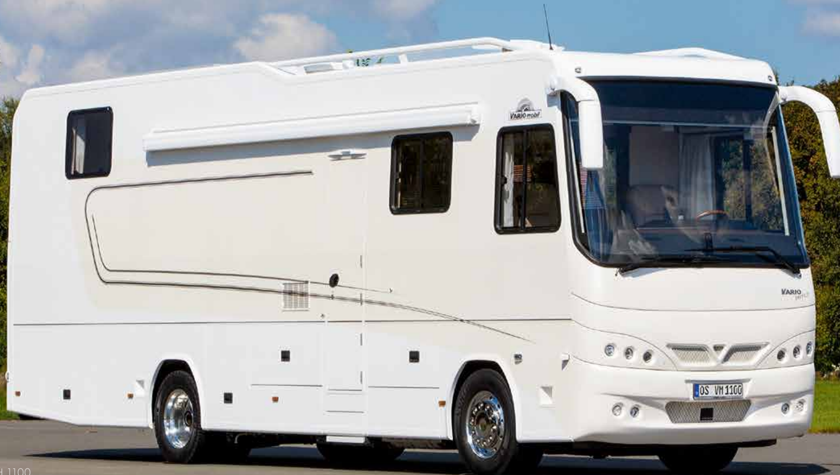
VARIO Perfect SH 1100 mit PKW-Garage unter beidseitig begehbarem Heckdoppelbett