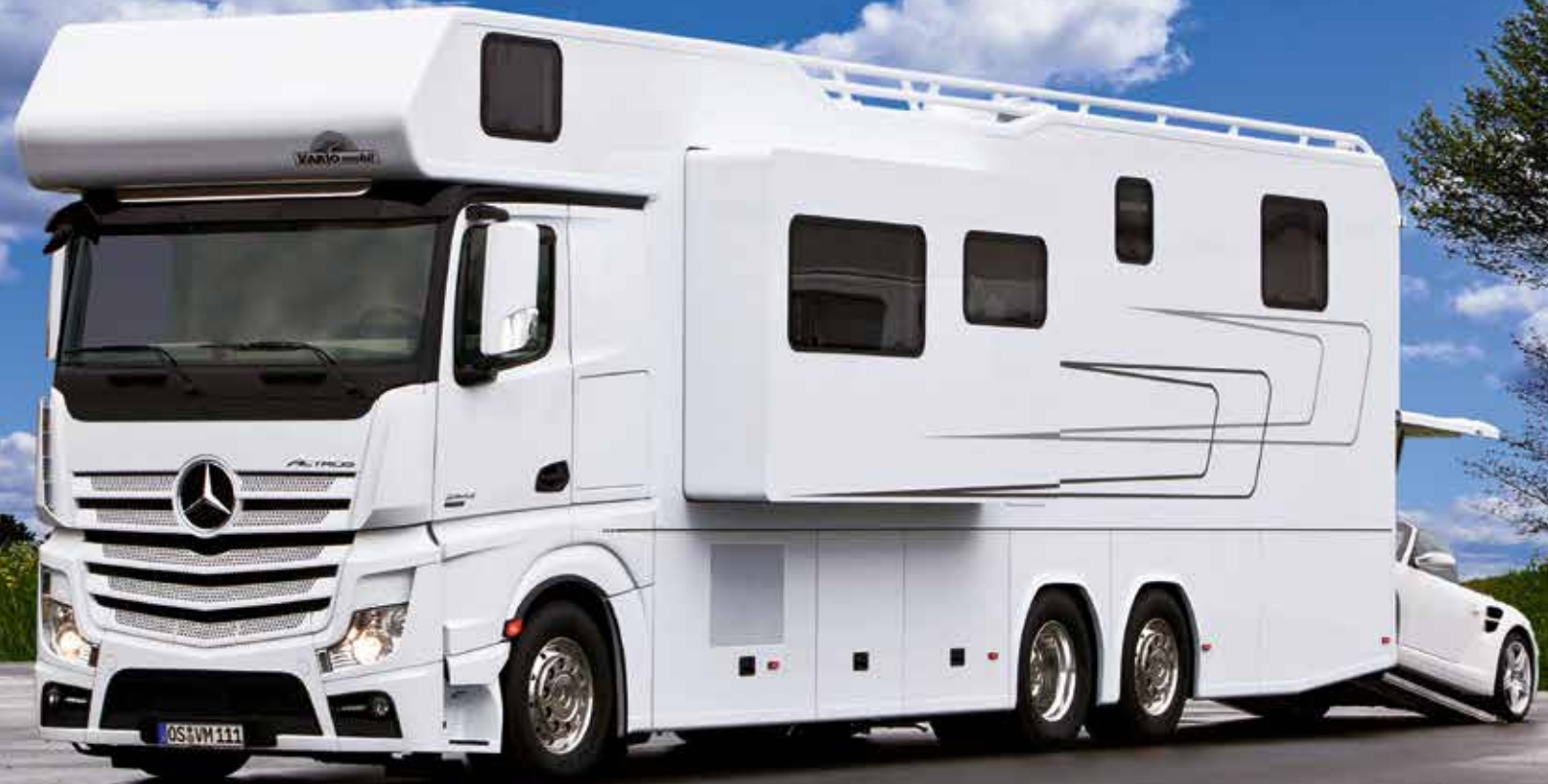
VARIO Alkoven 1200 - MB Antos / Actros 2543 LLL . Ausfahrbarer Wohnraumker und PKW-Garage.

Das innovativ gestaltete Fahrerhaus mit insgesamt vier Sitzplätzen unter dem klappbaren Alkovenbett verschmilzt durch einen extragroßen Durchgangsbereich optisch mit der großzügigen Wohnlandschaft – ähnlich wie bei einem integrierten Reisemobil.