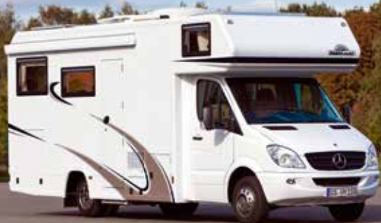
VARIO Alkoven 750 - MB Sprinter 519 CDI