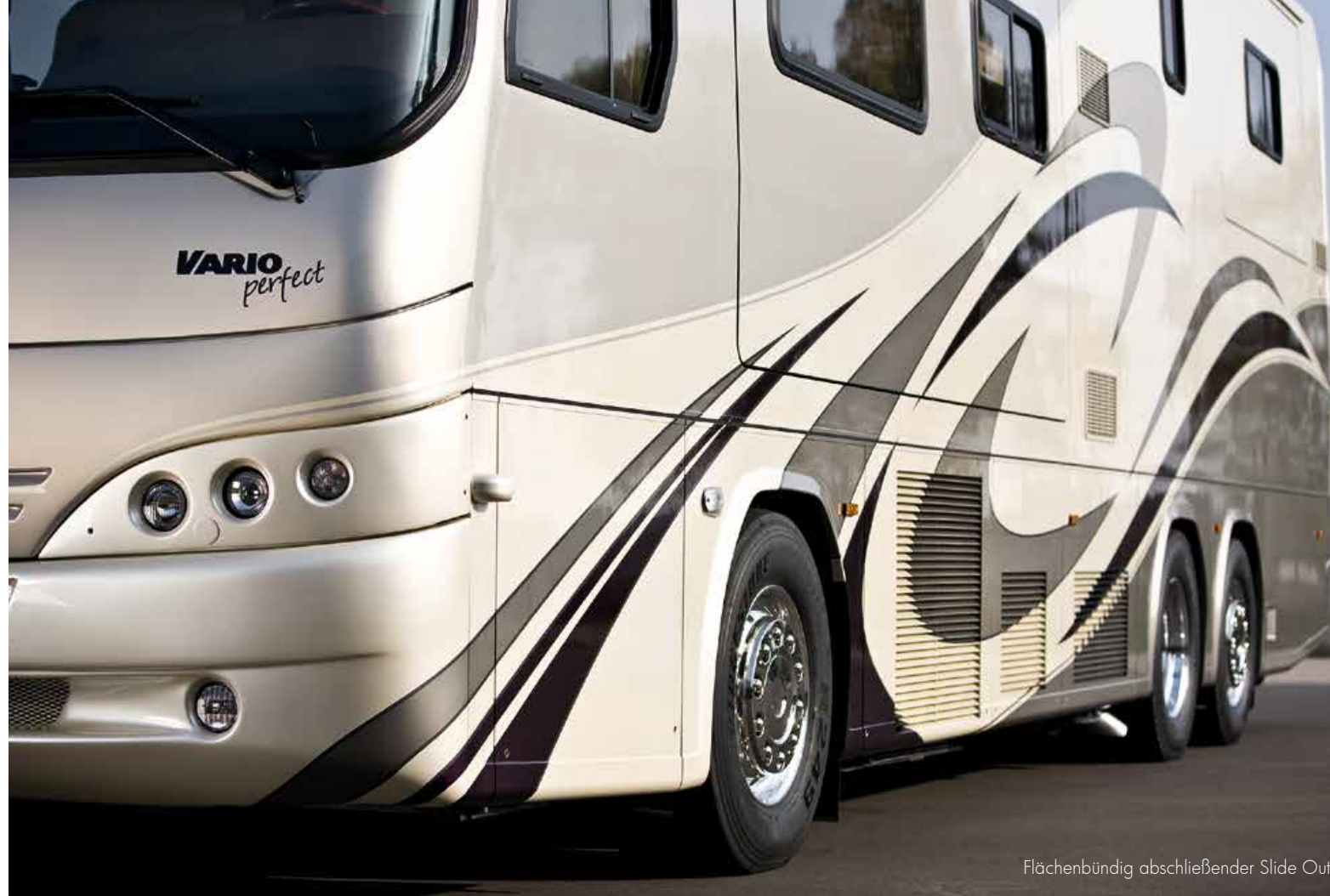
Flächenbündig abschließender Slide Out