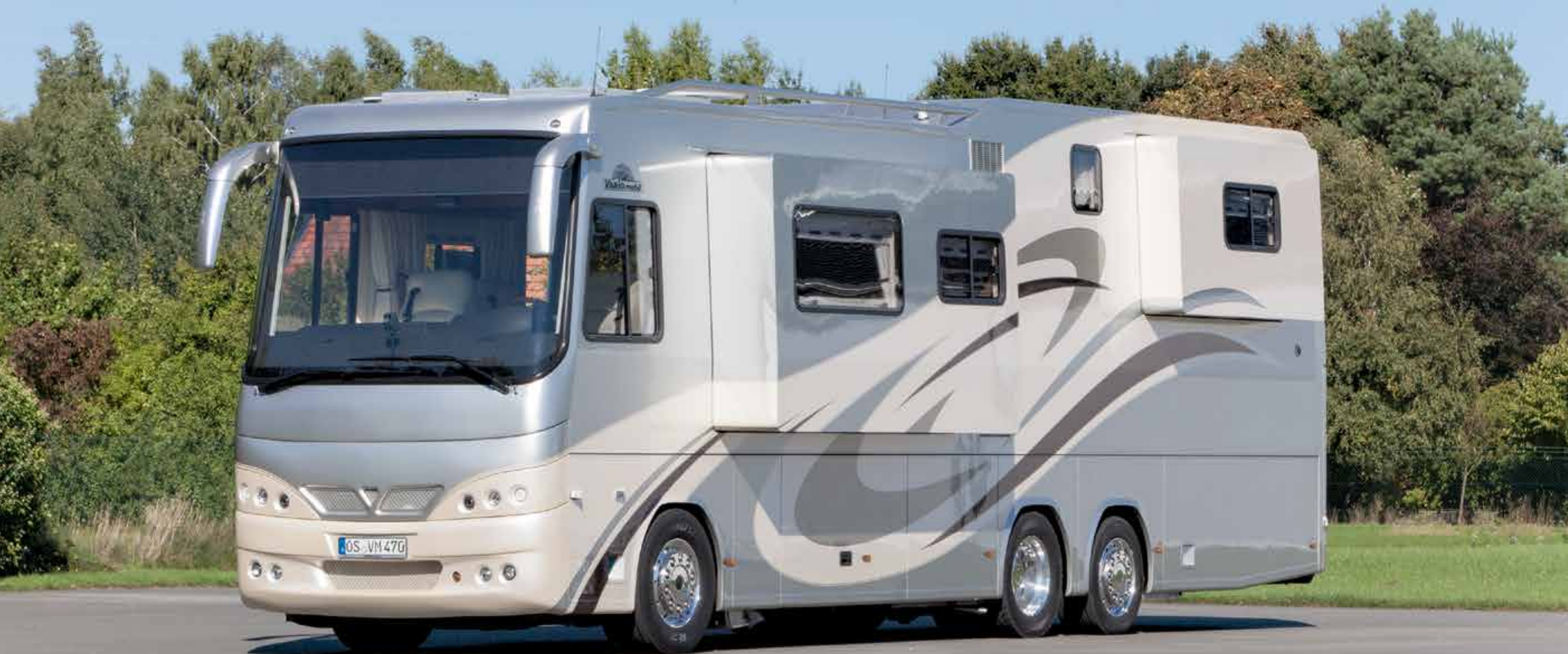
VARIO Perfect 1200 Platinum