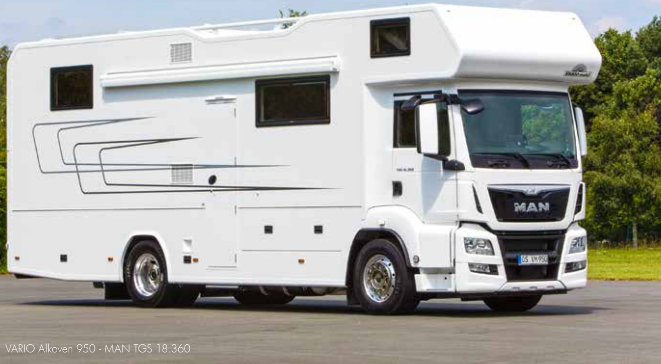
VARIO Alkoven 950 - MAN TGS 18.360