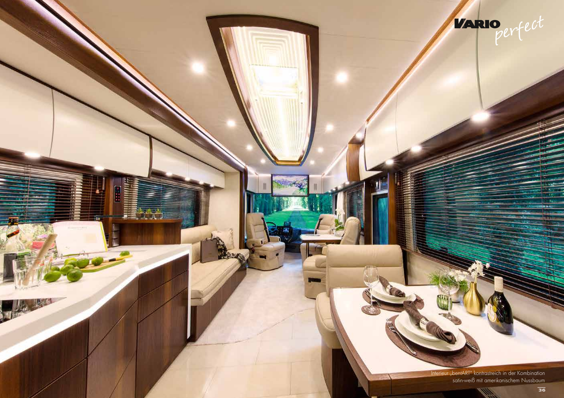
Interieur „bentART“ kontrastreich in der Kombination satin-weiß mit amerikanischem Nussbaum