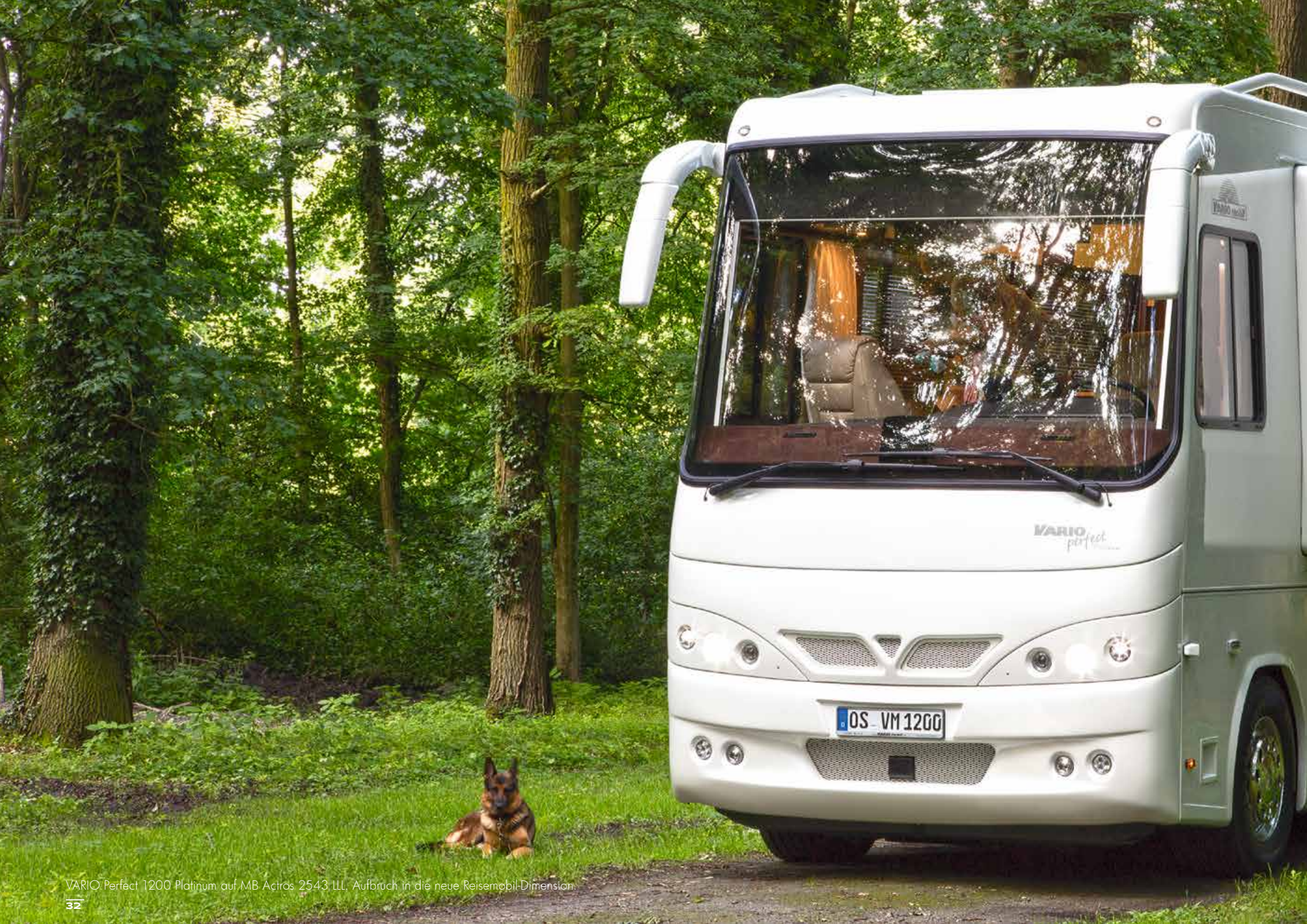
VARIO Perfect 1200 Platinum auf MB Actros 2543 LLL. Aufbruch in die neue Reisemobil-Dimension.