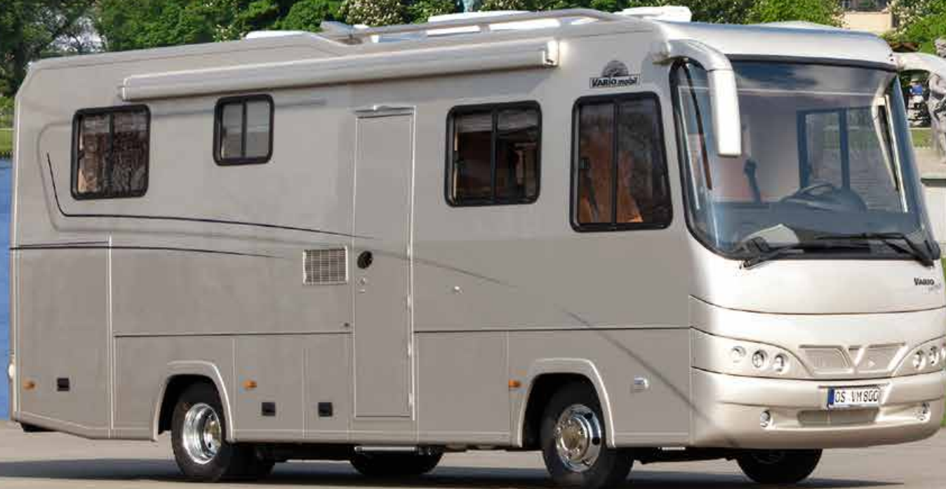
VARIO Perfect 800 SH - MAN TGL 8.250