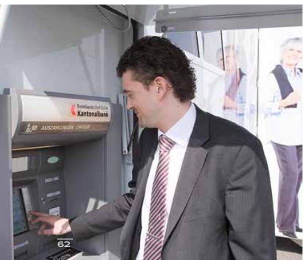
Sattelaufleger VARIO Dynamic - MB Atego - mobile Bankfiliale