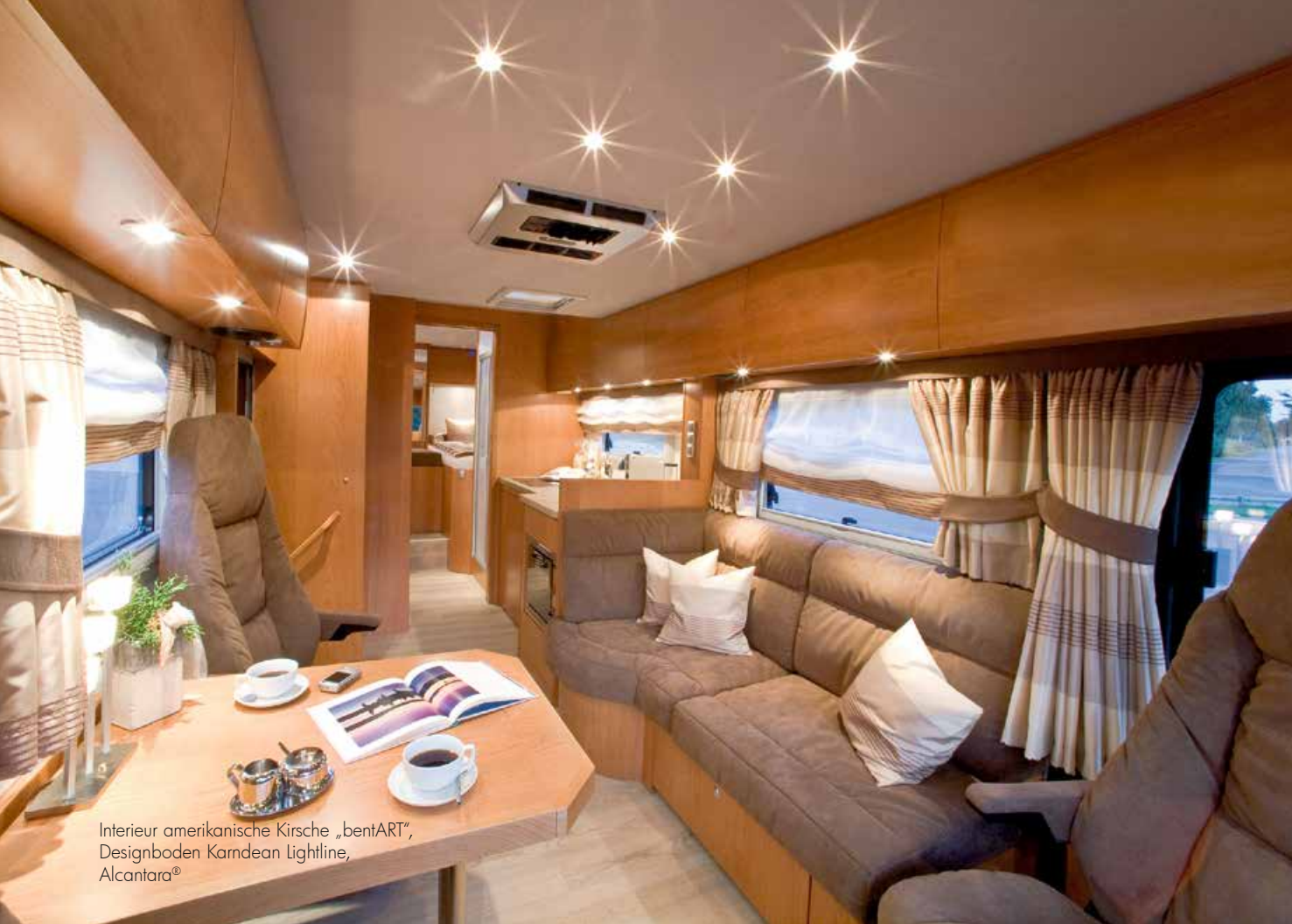
Interieur amerikanische Kirsche „bentART“, Designboden Karndean Lightline, Alcantara®