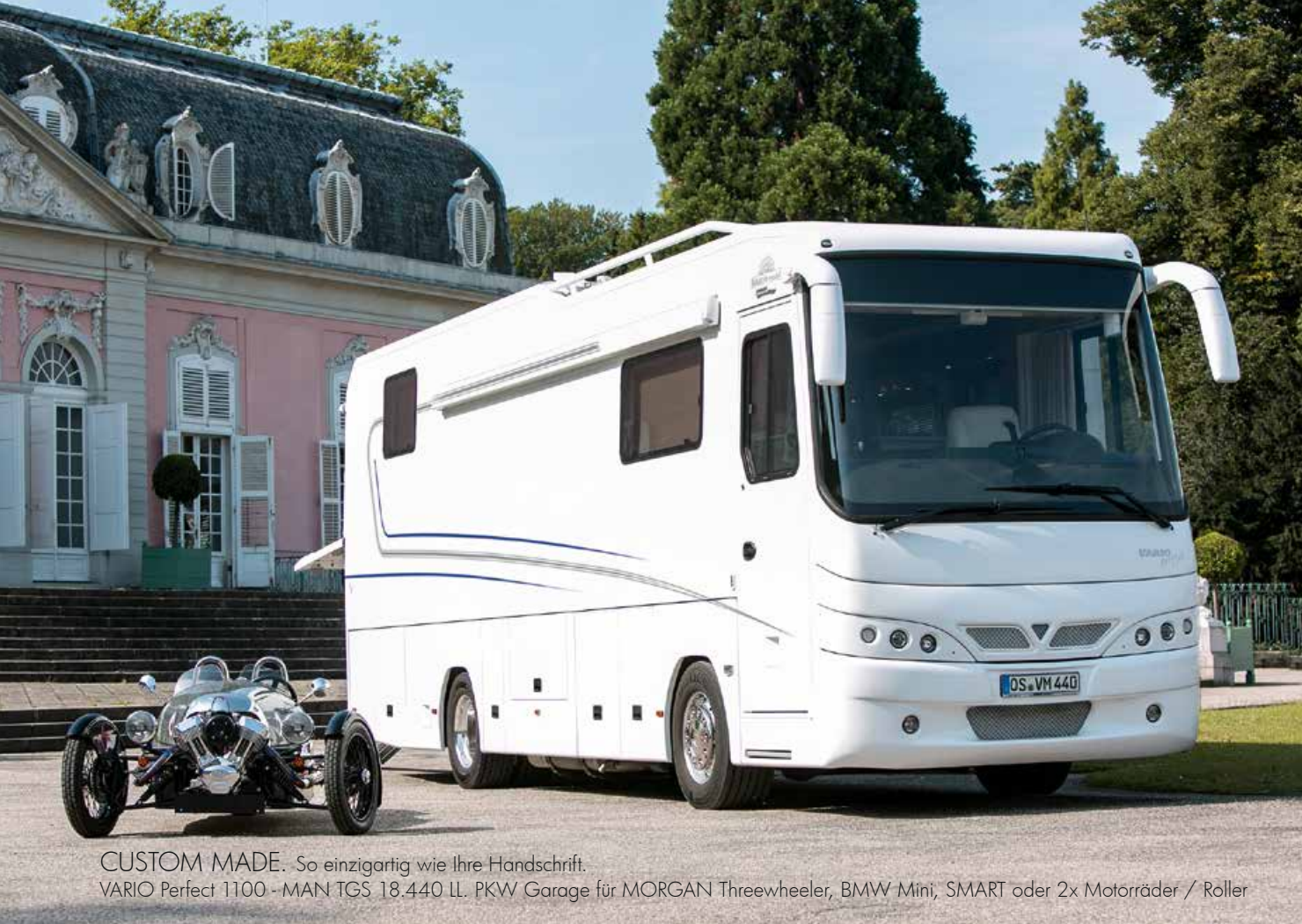
CUSTOM MADE. So einzigartig wie Ihre Handschrift. VARIO Perfect 1100 - MAN TGS 18.440 LL. PKW Garage für MORGAN Threewheeler, BMW Mini, SMART oder 2x Motorräder / Roller