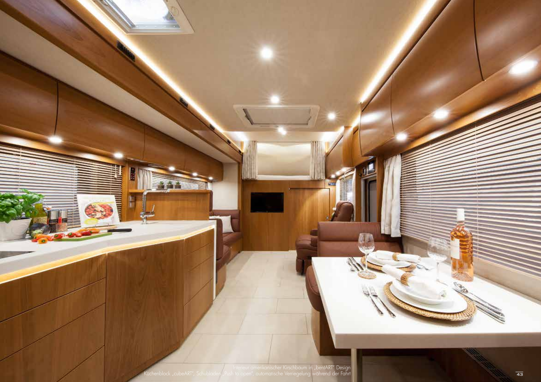
Interieur amerikanischer Kirschbaum in „bentART“ Design Küchenblock „cubeART“, Schubladen „Push to open“, automatische Verriegelung während der Fahrt