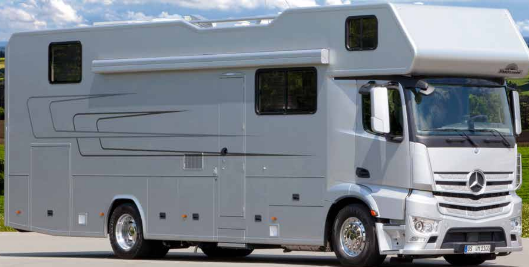
VARIO Alkoven 1100 - MB Antos. Mehr als 1 m komfortable Alkovenhöhe für viel Kopffreiheit im Mobil