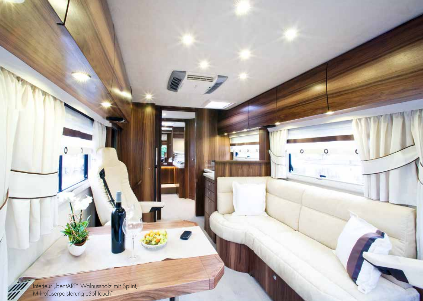
Interieur „bentART“ Walnussholz mit Splint, Mikrofaserpolsterung „Softtouch“