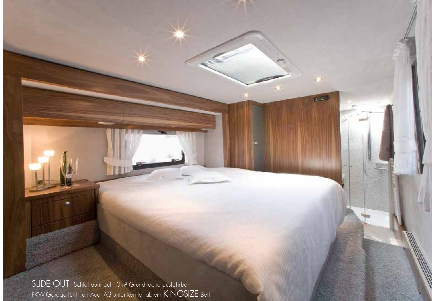
SLIDE OUT. Schlafräum auf 10m 2 Grundfläche ausfahrbar. PKW-Garage für Ihren Audi A3 unter komfortablem KINGSIZE Bett