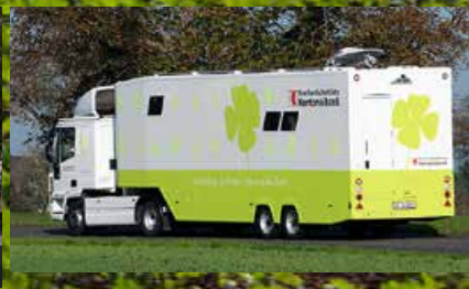
Rollende Geschäftsfilialen, VARIO-Kofferaufbau und VARIO-Sattelaufleger - IVECO Daily