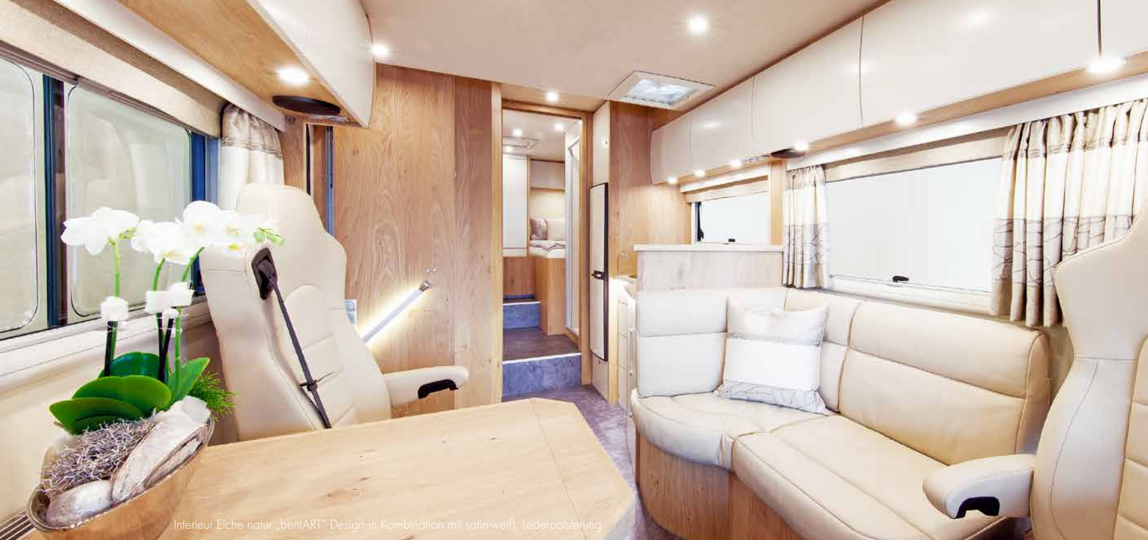
Interieur Eiche natur „bentART“ Design in Kombination mit satin-weiß, Lederpolsterung