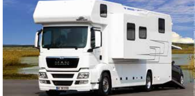
VARIO Alkoven 1050 - MAN TGS 18.440