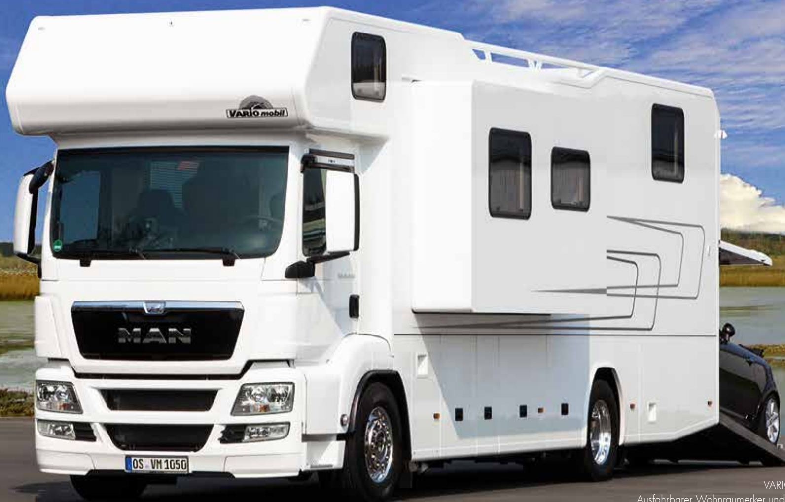
VARIO Alkoven 1050 - MAN TGS Ausfahrbarer Wohnraumerker und PKW-Garage für BMW Mini

Auch der übrige Wohnbereich bietet standesgemäßen Luxus mit einer Winkelküche und großzügiger Essecke.