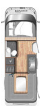
I 650 G