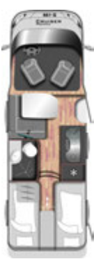
T 661 G