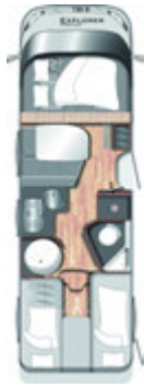
I 730 G