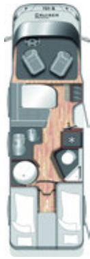
T 731 G