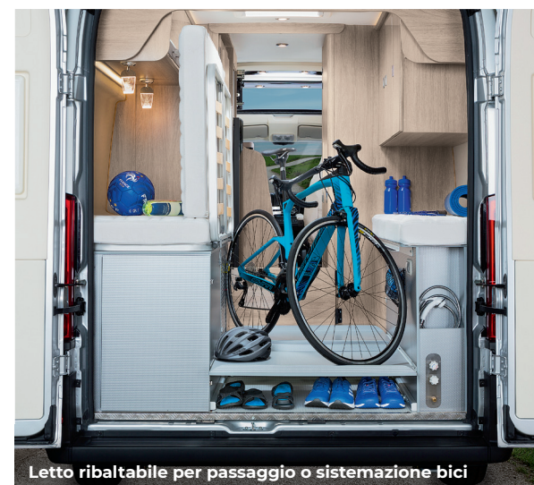
Letto ribaltabile per passaggio o sistemazione bici