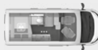
BOXLIFE 540 MQ