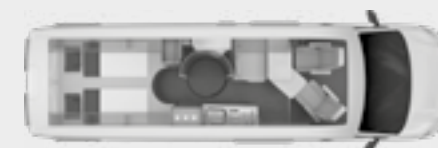
BOXDRIVE 680 ME