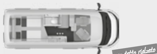
BOXSTAR 600 LIFETIME XL