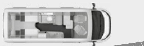
BOXSTAR 630 FREEWAY