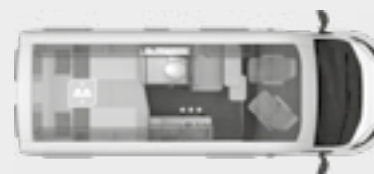
BOXLIFE 600 ME