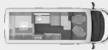
BOXLIFE 600 MQ