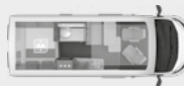
BOXLIFE 600 DQ