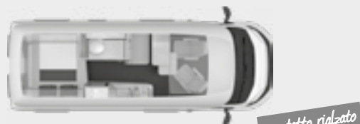
BOXSTAR 600 STREET XL