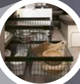
Accessori per dentro e fuori