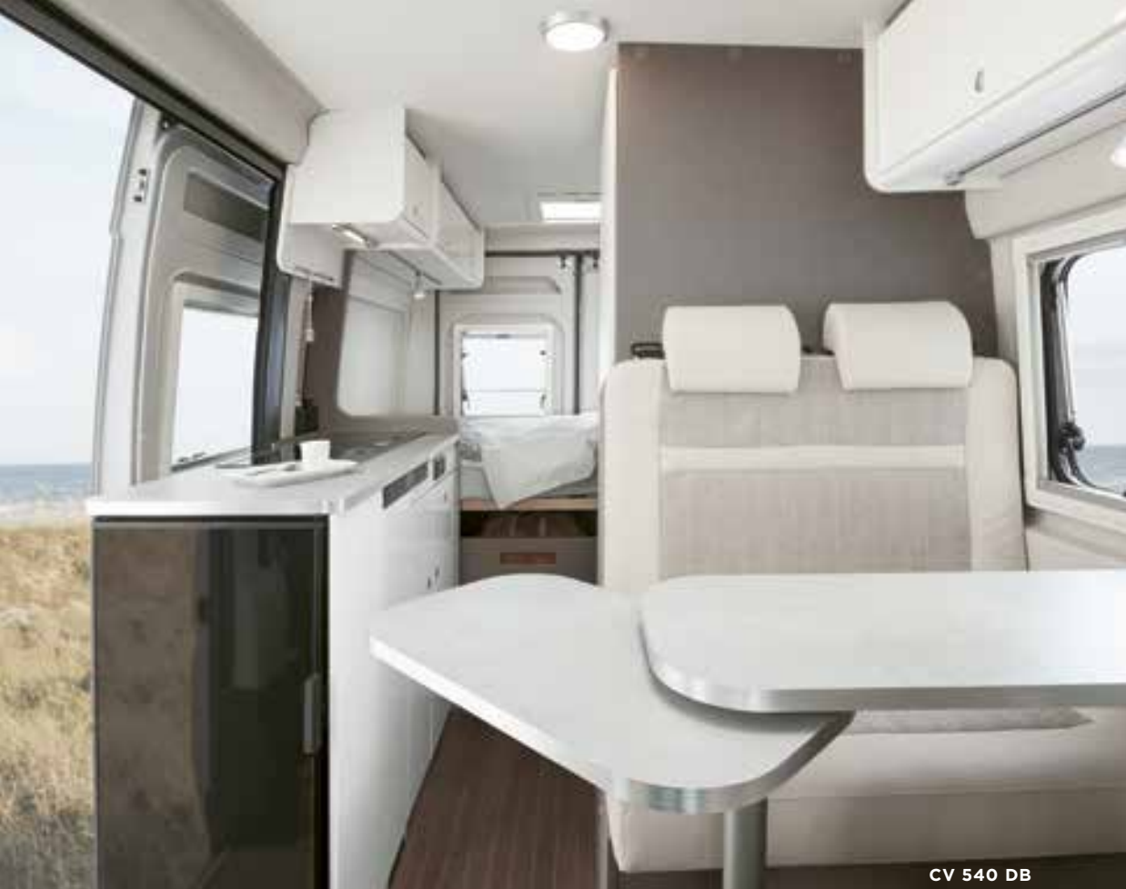
CV 540 DB