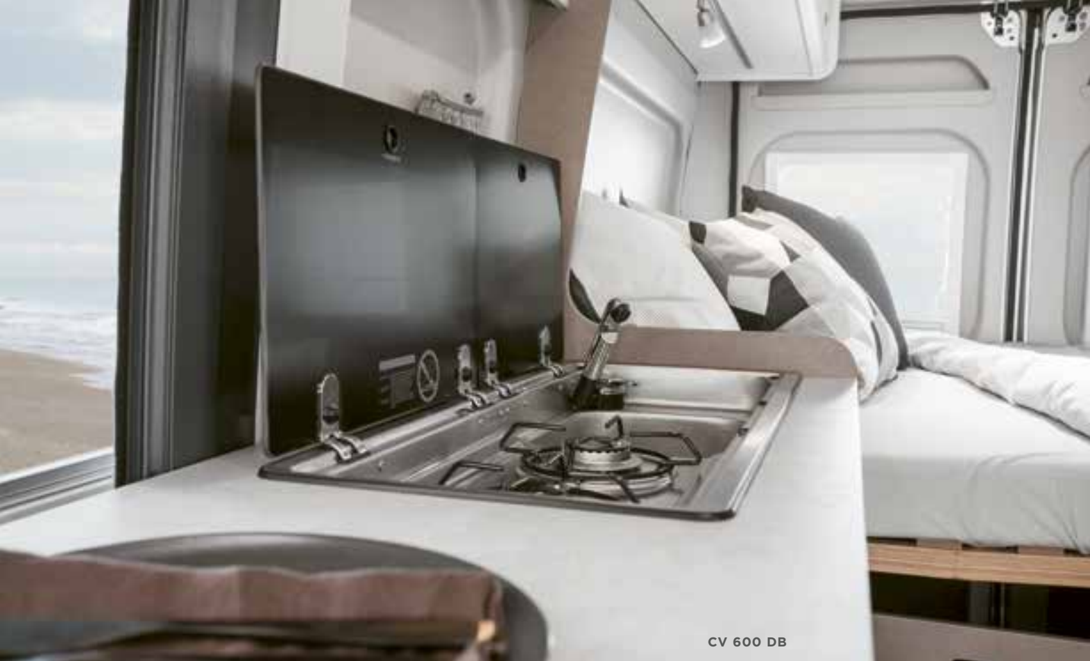
CV 600 DB