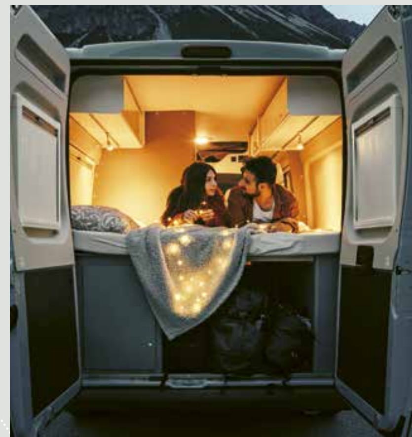
CV 640 SB