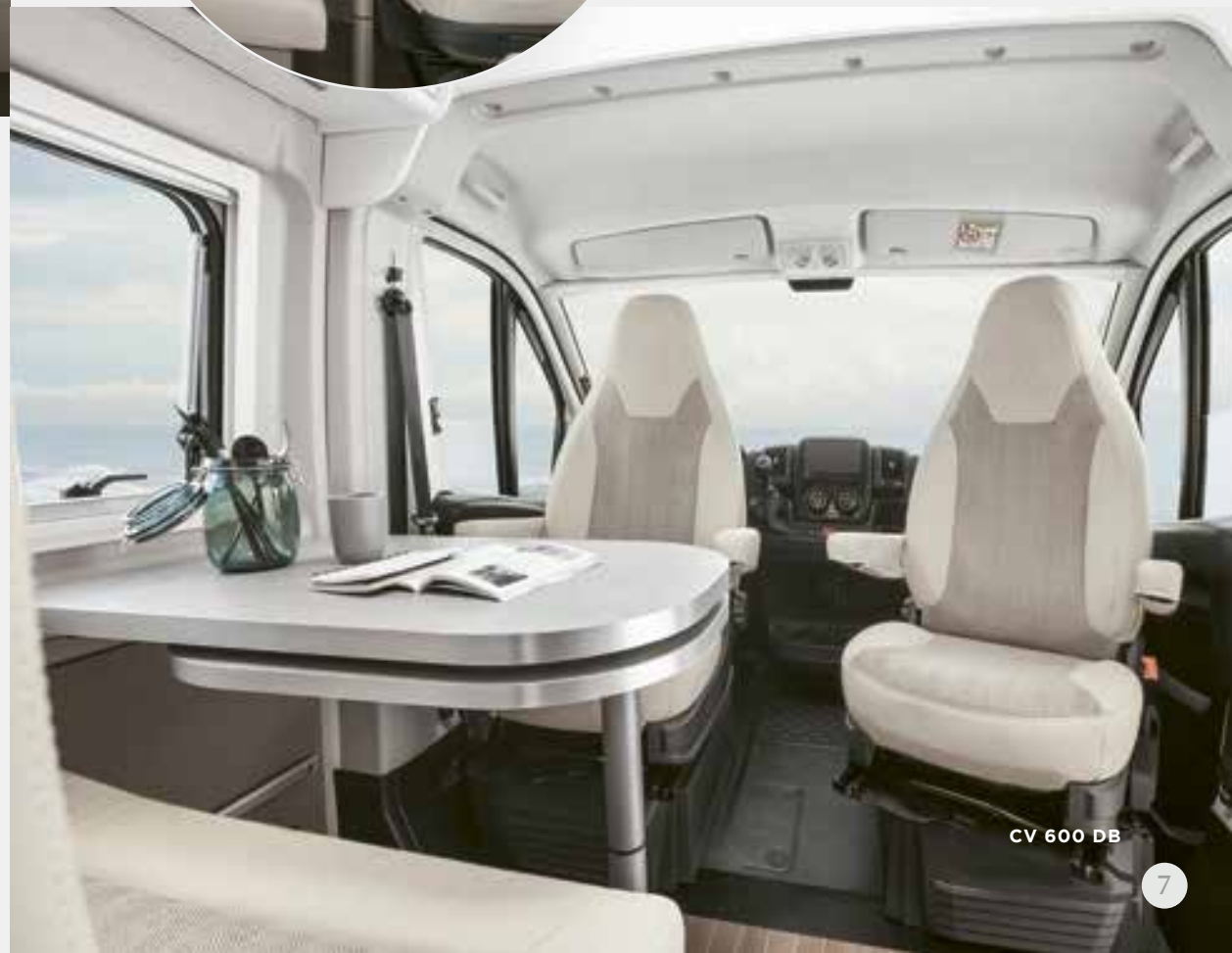
CV 600 DB

Girare i sedili del conducente e del passeggero di 180 gradi, mettere in posizione il tavolo e.... buon appetito! Visuale molto ampia. Design alla moda. Fermare il tempo e godersi il momento.