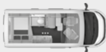
BOXSTAR 540 ROAD