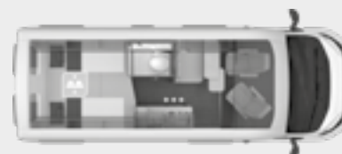
BOXLIFE 600 ME