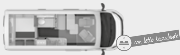
BOXSTAR 600 SOLUTION