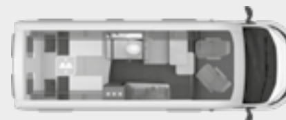
BOXLIFE 630 ME

Raffigurazioni non vincolanti: per quanto riguarda la rappresentazione delle piantine sopra riportate, trattasi di raffigurazioni schematiche. Le effettive caratteristiche delle dotazioni e dei veicoli stessi possono pertanto differire. Determinate caratteristiche dei veicoli e delle dotazioni non sono sempre raffigurabili in piantina e queste non possono pertanto essere prese come base. Vi preghiamo pertanto di richiedere sempre informazioni al vostro concessionario di fiducia prima dell'acquisto, in merito alle concrete caratteristiche del veicolo e delle dotazioni prescelte.