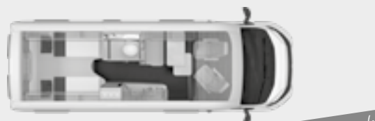
BOXSTAR 630 FREEWAY