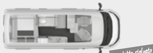
BOXSTAR 600 STREET XL