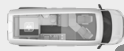
BOXDRIVE 600 XL