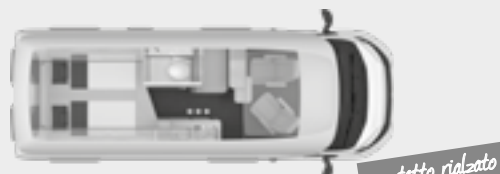
BOXSTAR 600 LIFETIME XL