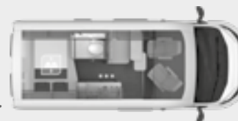
BOXLIFE 540 MQ