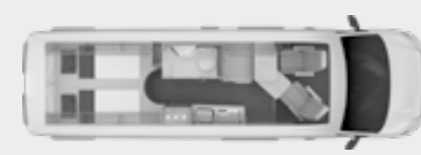
BOXDRIVE 680 ME