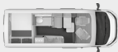
BOXSTAR 600 FAMILY