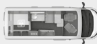
BOXLIFE 600 MQ