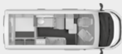
BOXSTAR 600 STREET