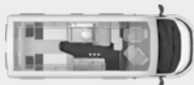
BOXSTAR 600 LIFETIME