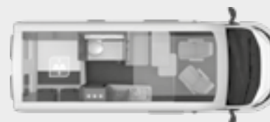
BOXLIFE 600 DQ